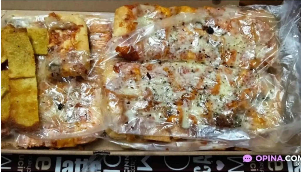
The house pando