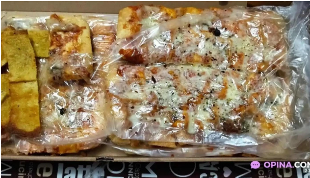
The house todas