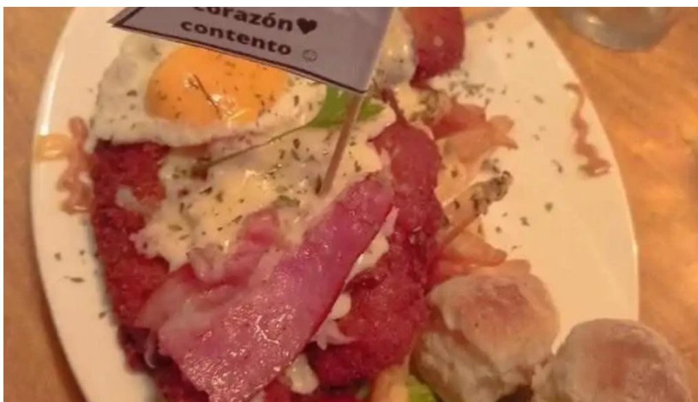
The house comida y bebida