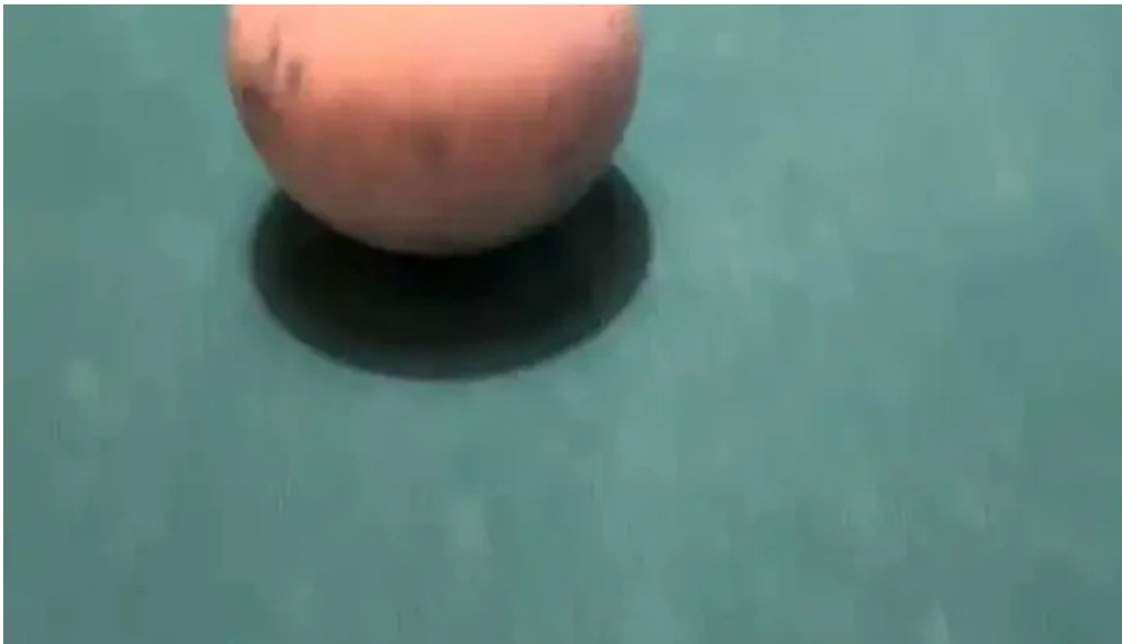
The house videos