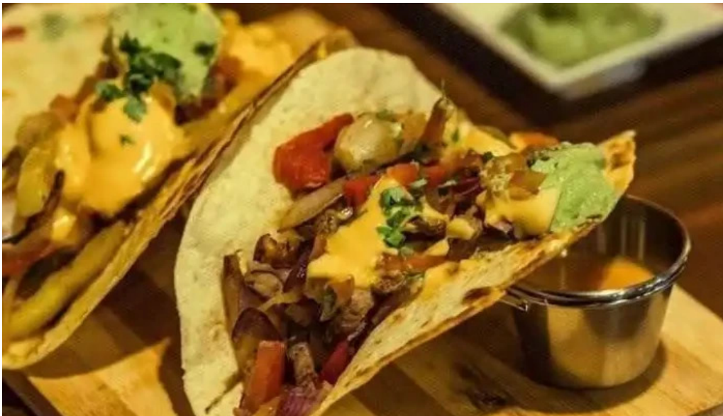
Submarino peral comida y bebida