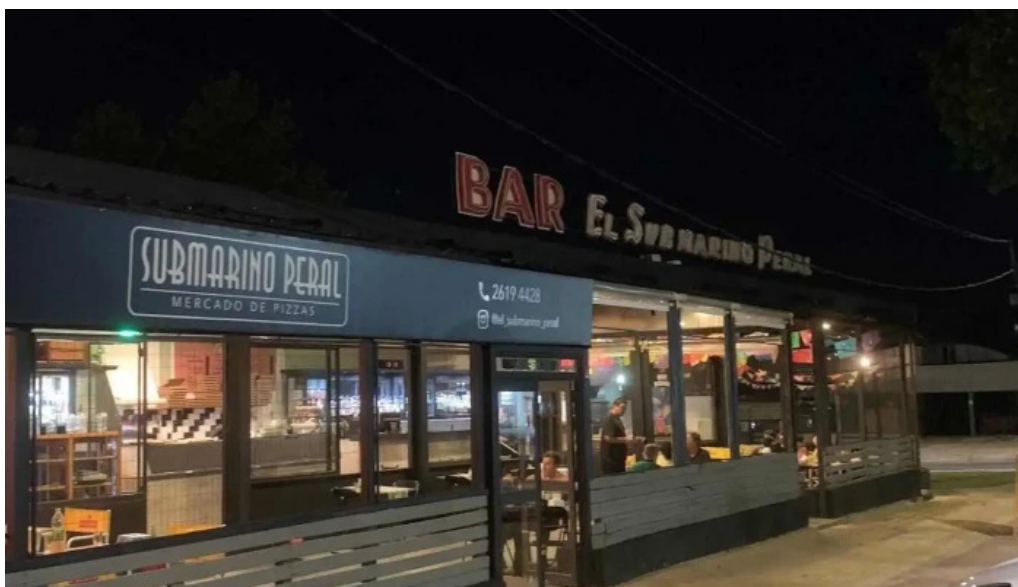
Submarino peral todas