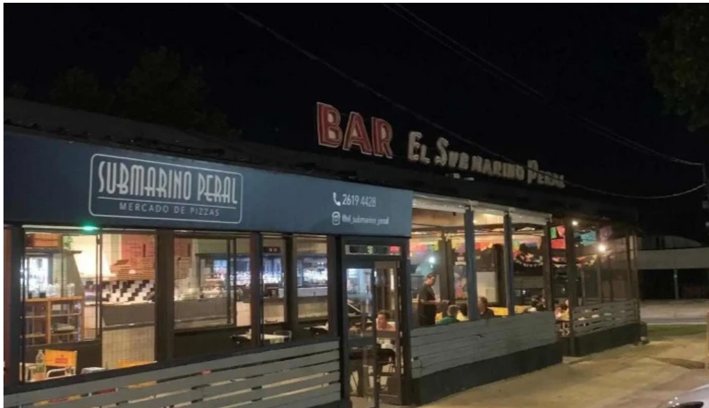
Submarino peral montevideo