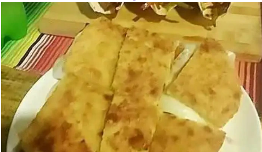
Submarino peral videos