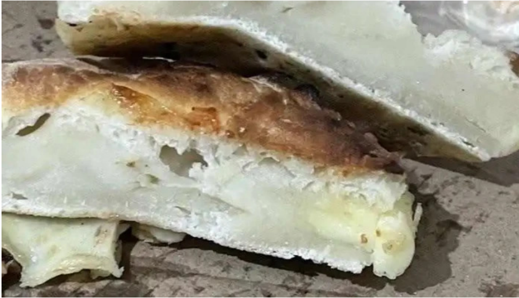
Submarino peral mas recientes