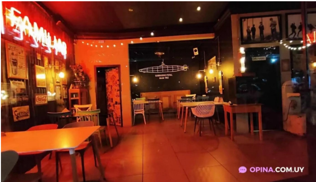
Submarino peral ambiente