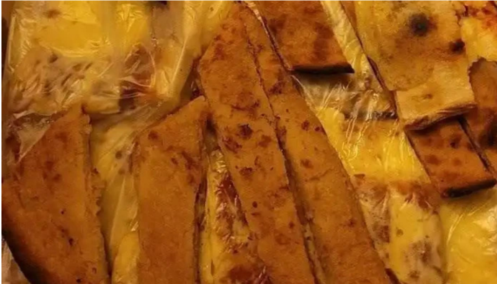
Pizzeria ramito comida y bebida