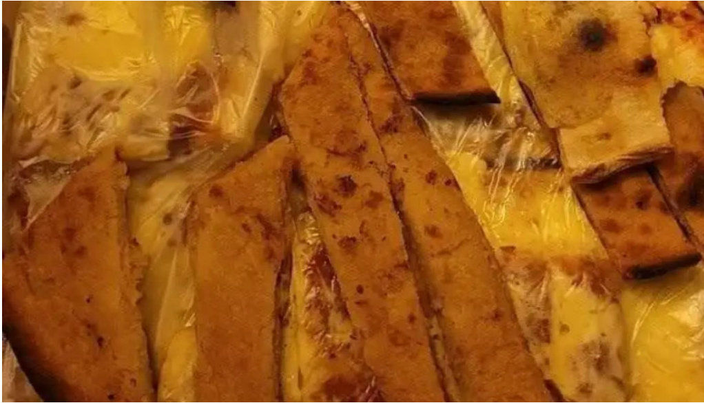
Pizzeria ramito todas