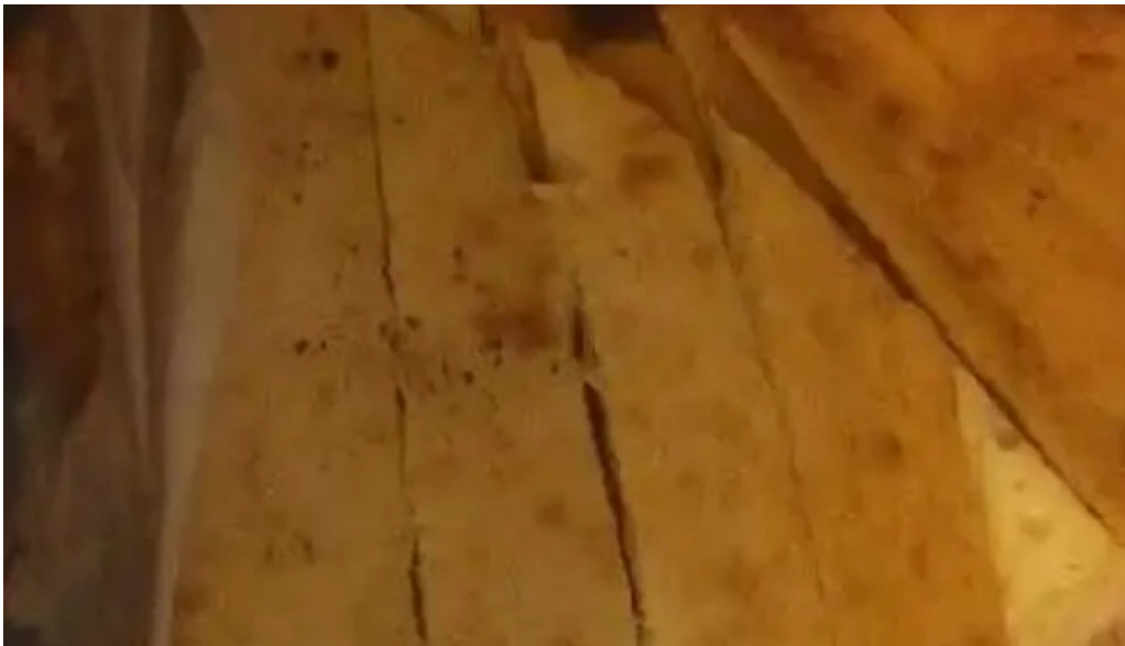
Pizzeria ramito mas recientes