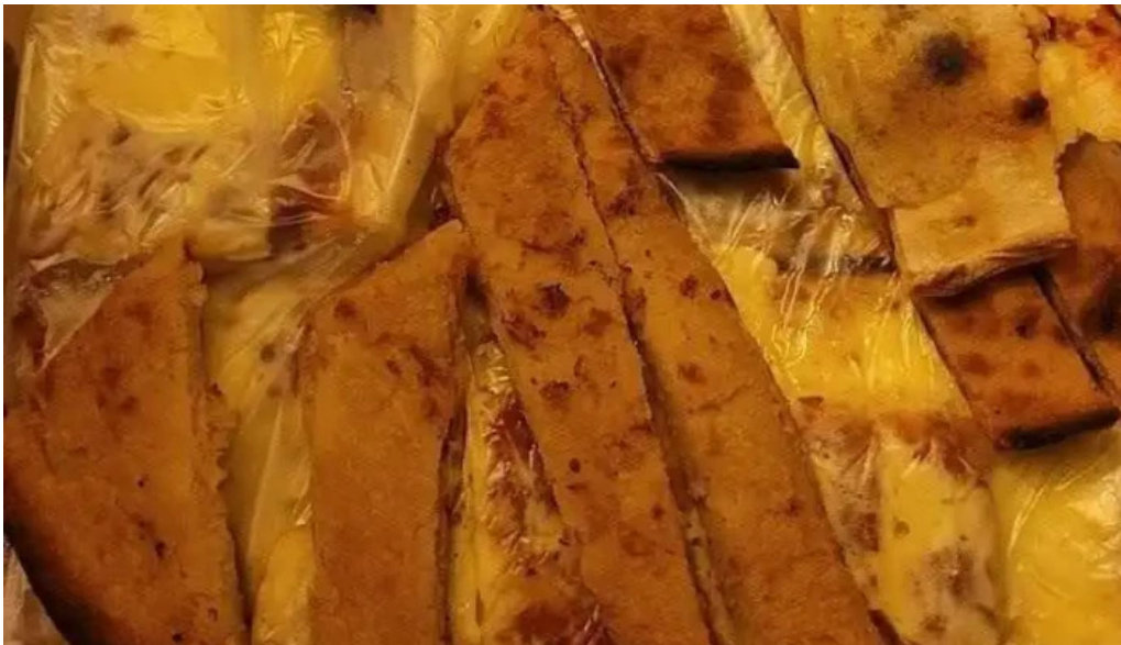
Pizzeria ramito pando