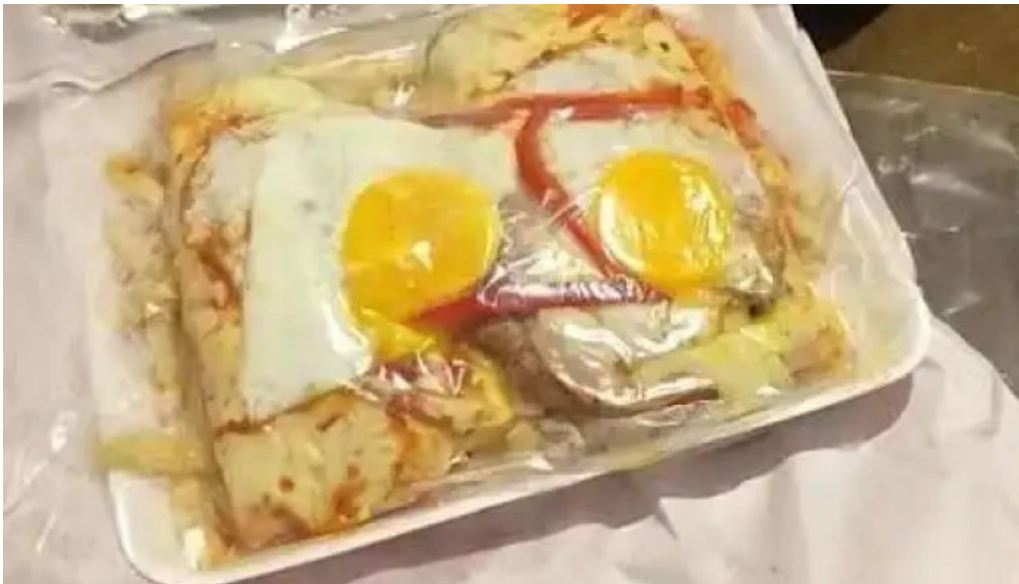
Pizzeria pazal comida y bebida