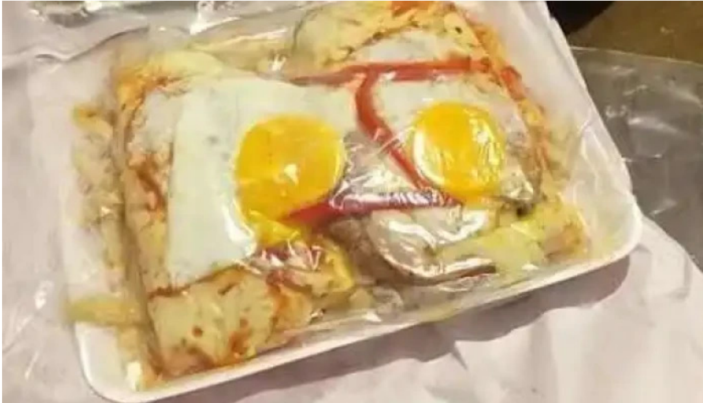
Pizzeria pazal estacion atlantida