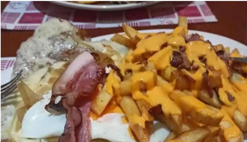
Pizzeria old cat comida y bebida