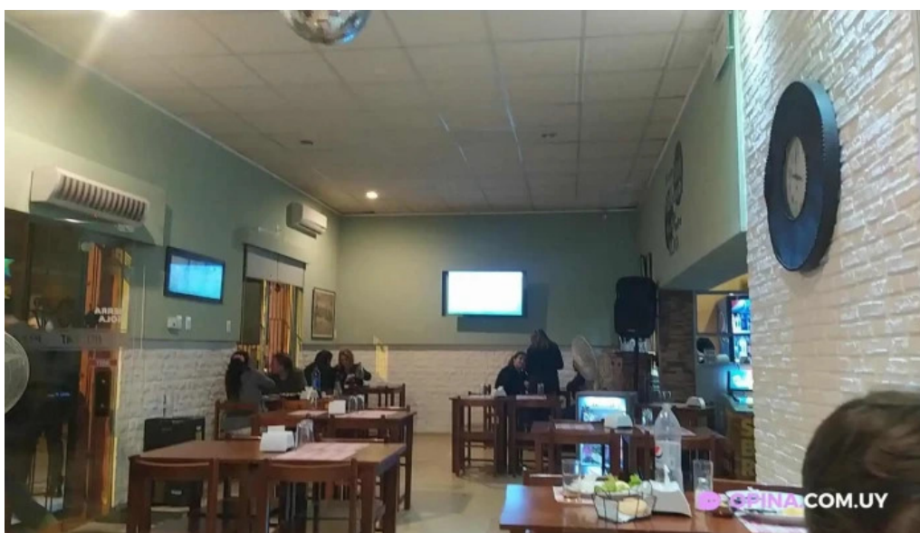
Pizzeria old cat ambiente