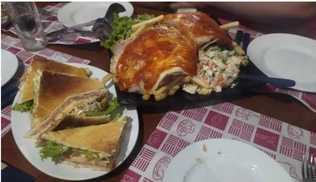
Pizzeria old cat todas