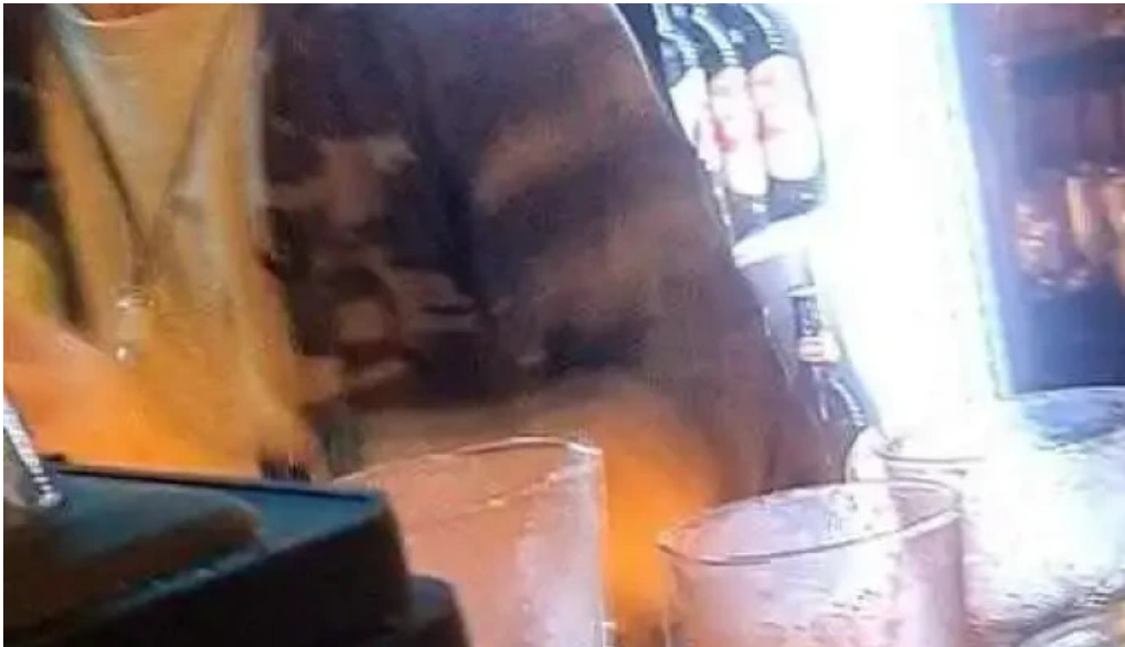
Pizzeria old cat videos