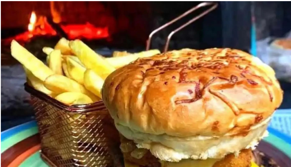
Pizzeria los panca del propietario