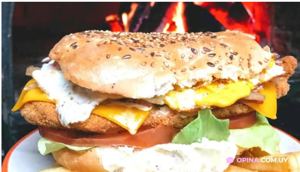
Pizzeria los panca hamburguesa