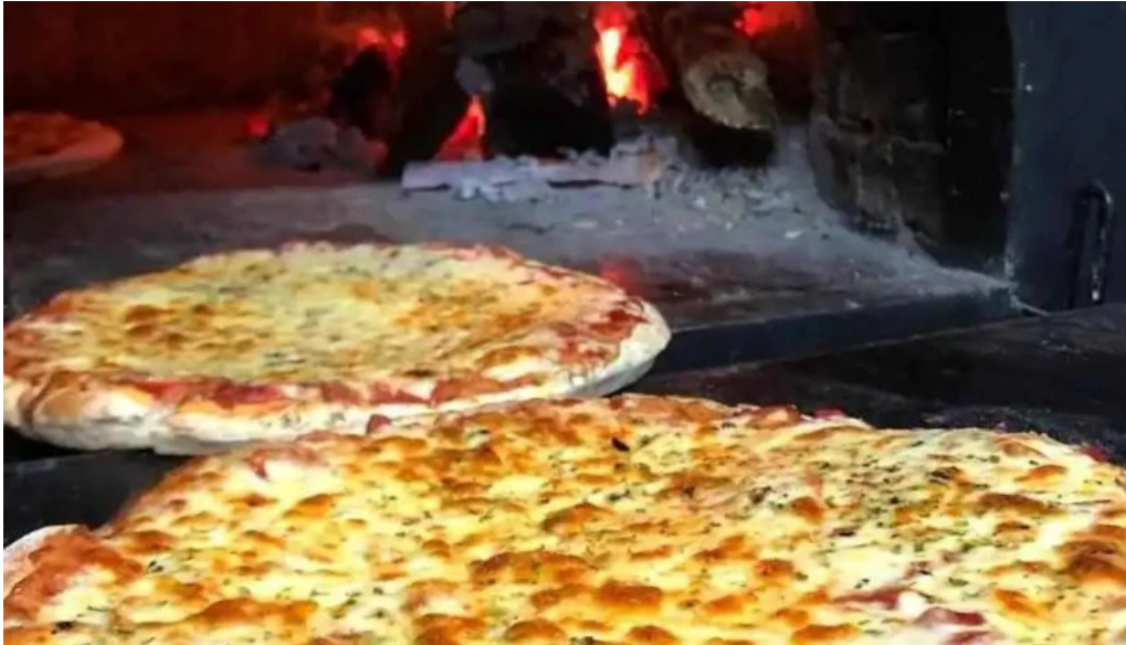
Pizzeria los panca comida y bebida