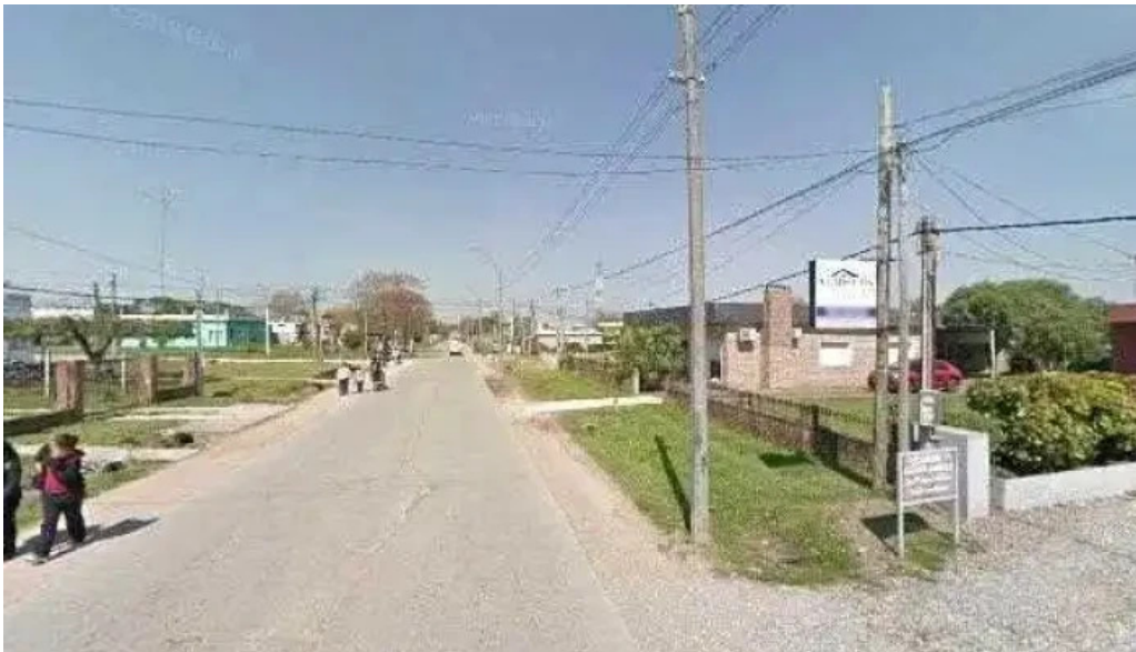
Pizzeria los panca street view y 360