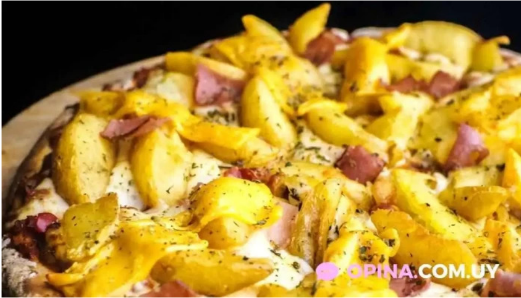
Pizzeria los panca todas