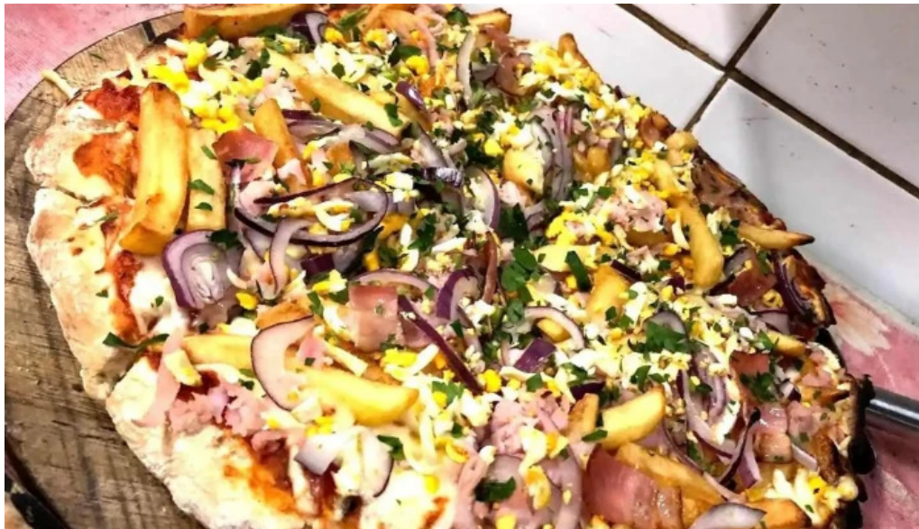
Pizzeria los panca pizza