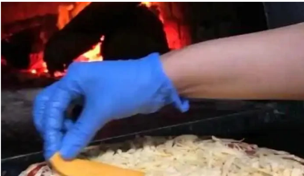
Pizzeria los panca videos