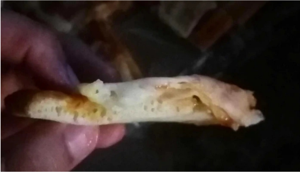
Pizzeria la estacion comentario 8