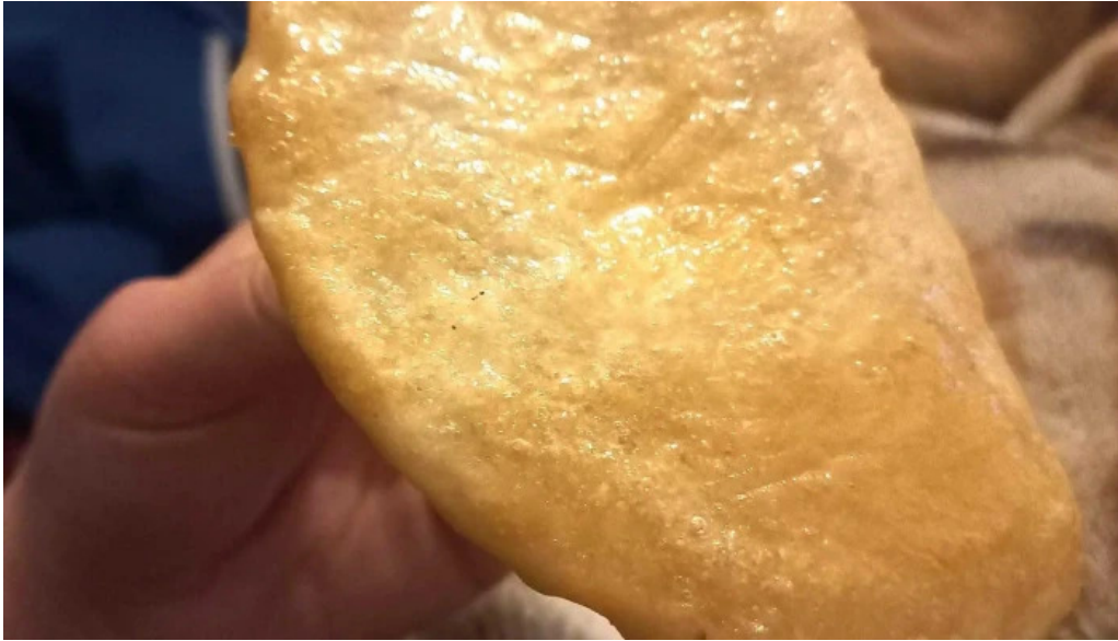
Pizzeria la estacion comentario 6