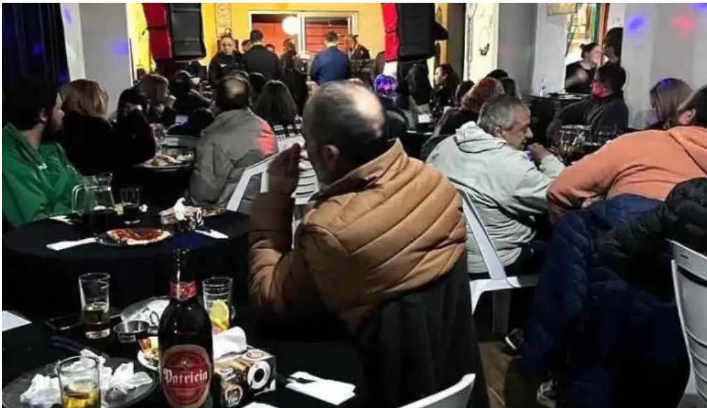
Pizzeria la estacion todo