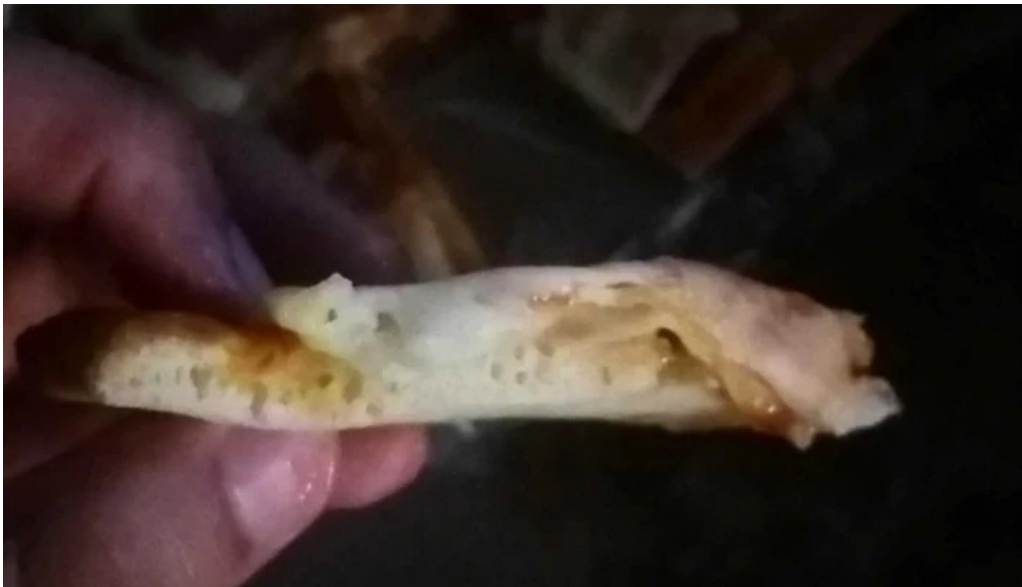
Pizzeria la estacion comentario 5