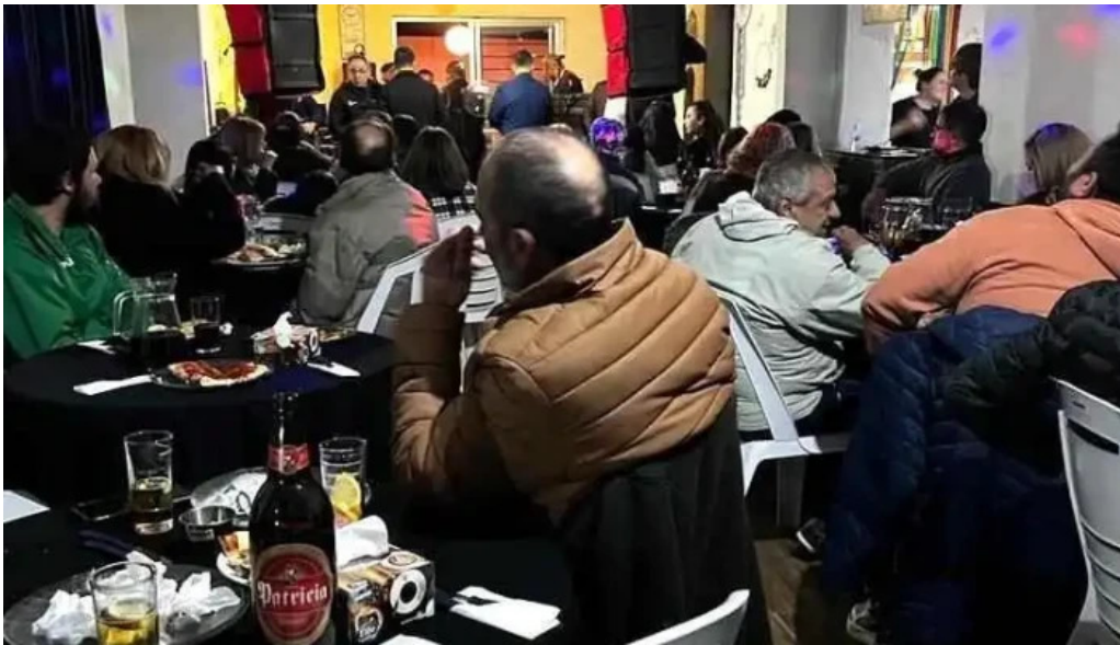
Pizzeria la estacion montevideo