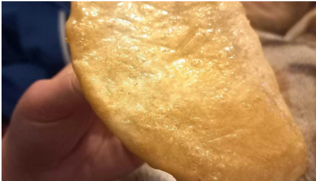
Pizzeria la estacion comentario 9