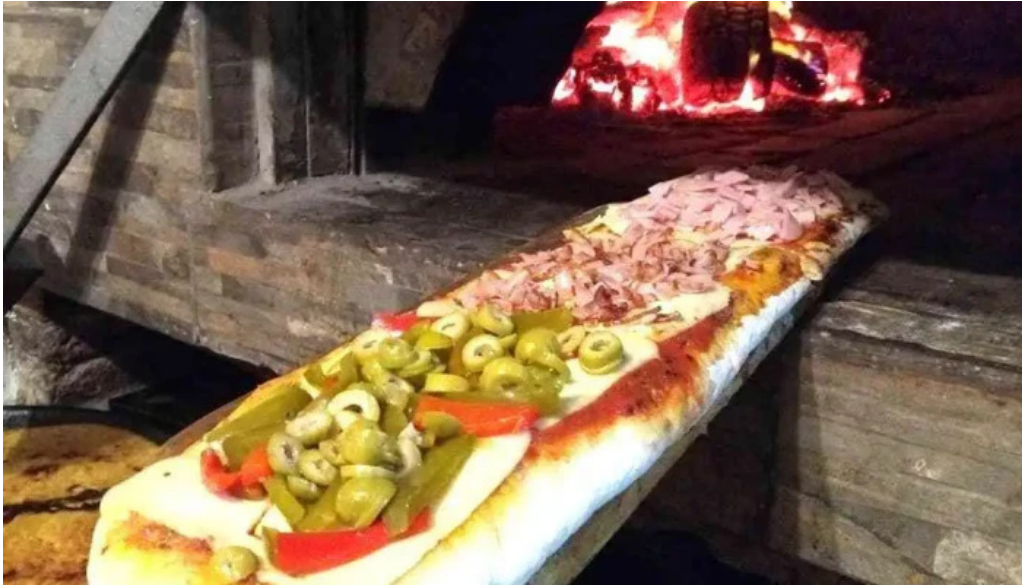
Pizzeria la estacion pizza