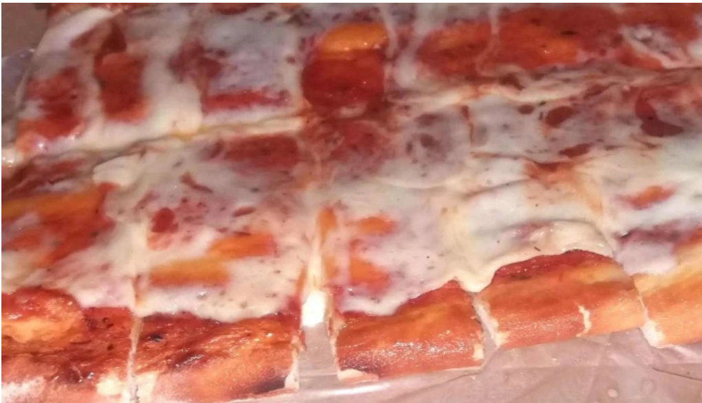
Pizzeria la estacion comentario 7