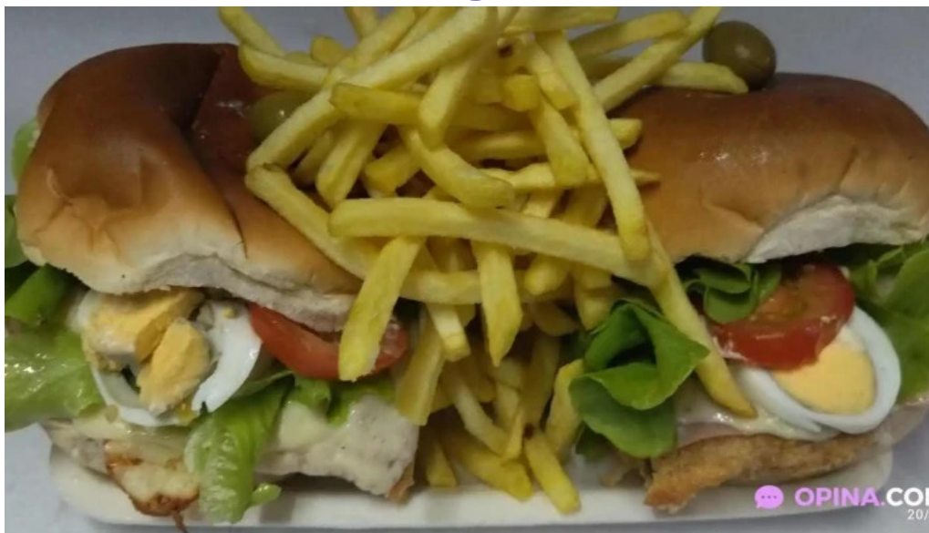
Pizzeria estadio todas