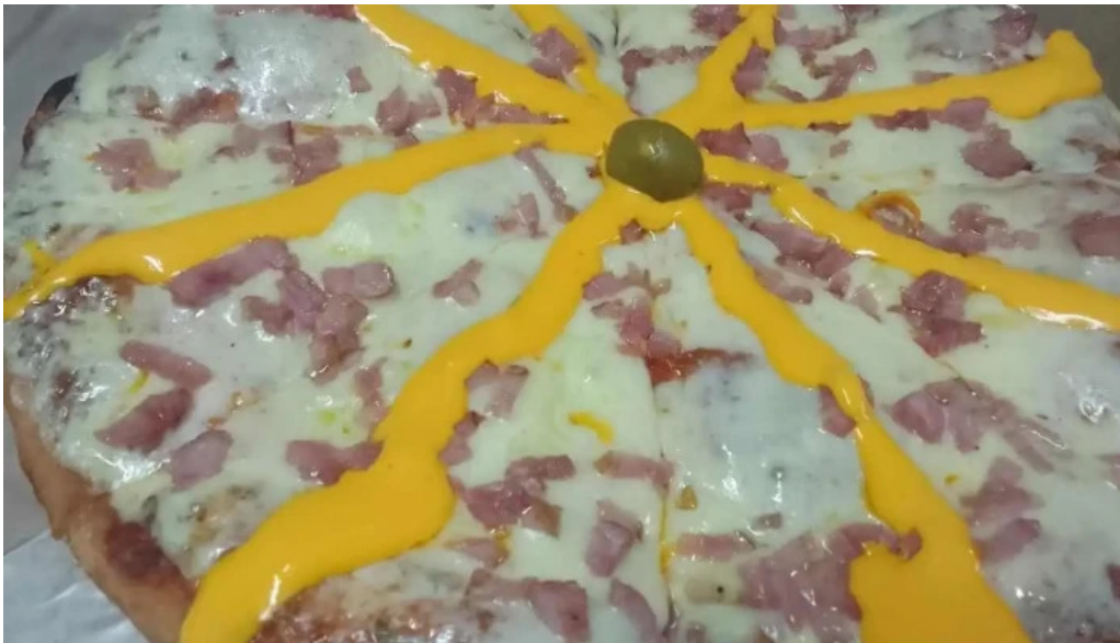
Pizzeria estadio pizza