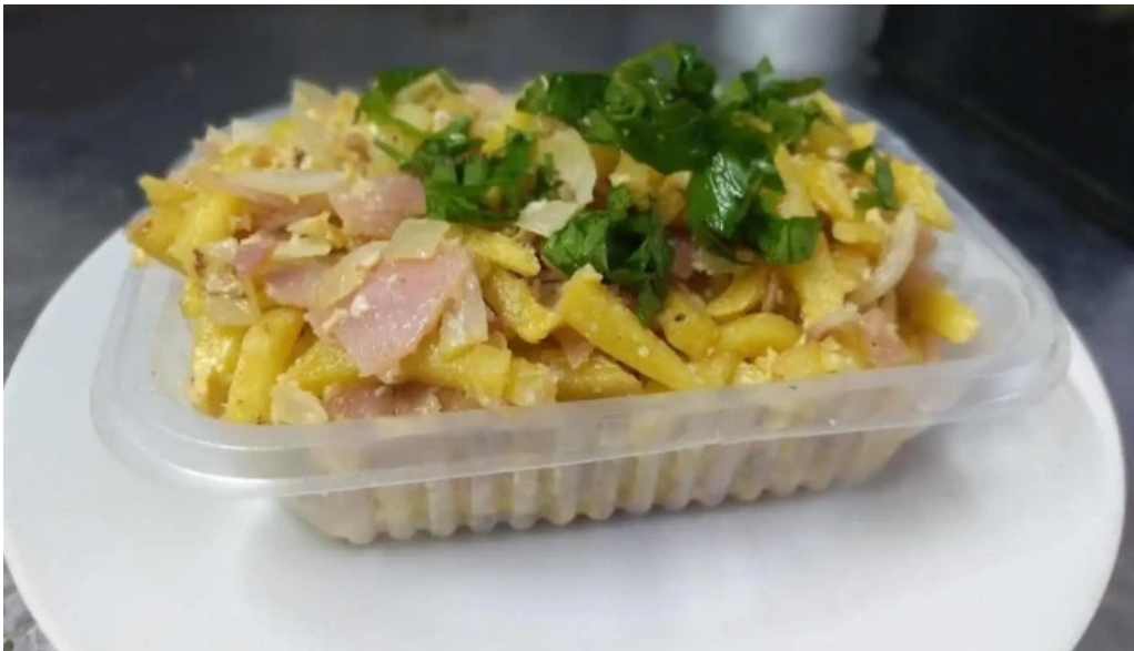
Pizzeria estadio pando