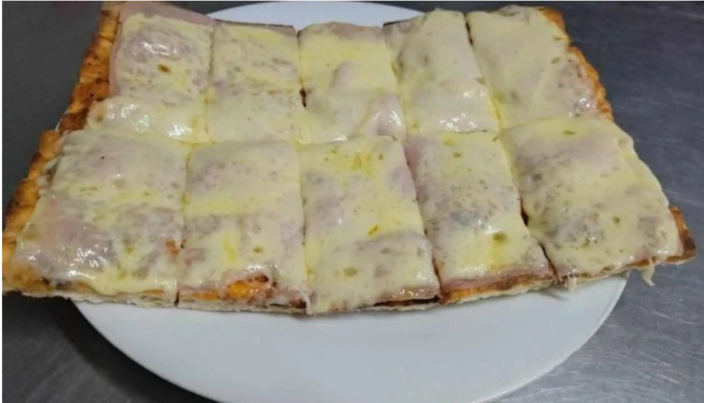
Pizzeria estadio del propietario