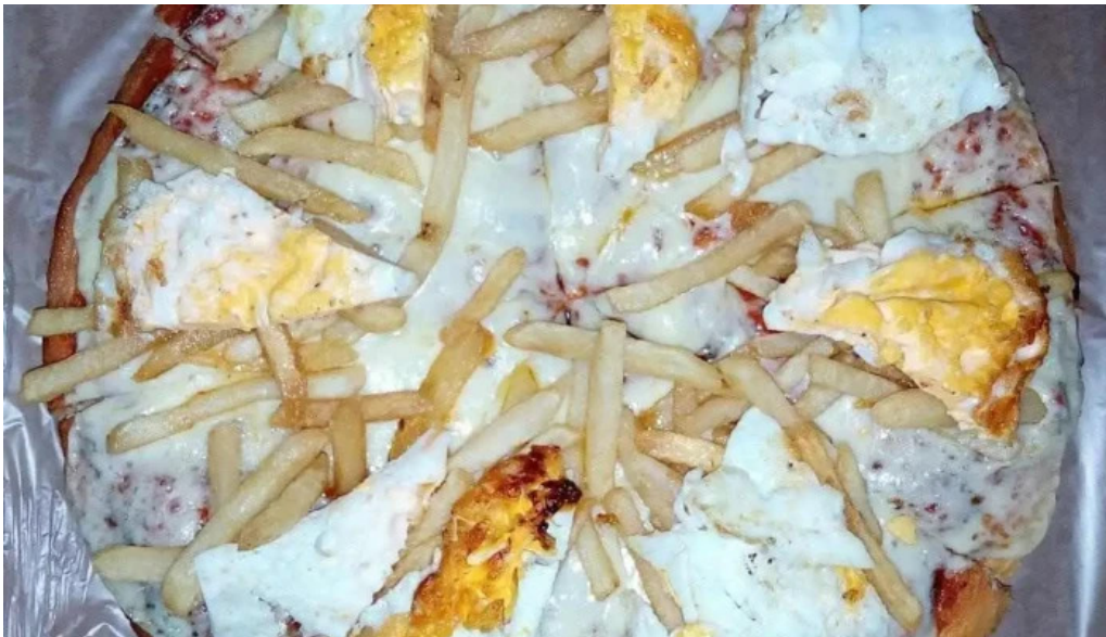
Pizzeria estadio comida y bebida