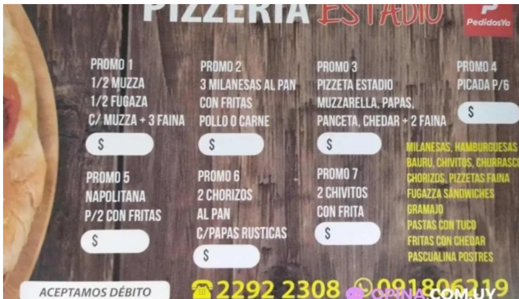
Pizzeria estadio menu