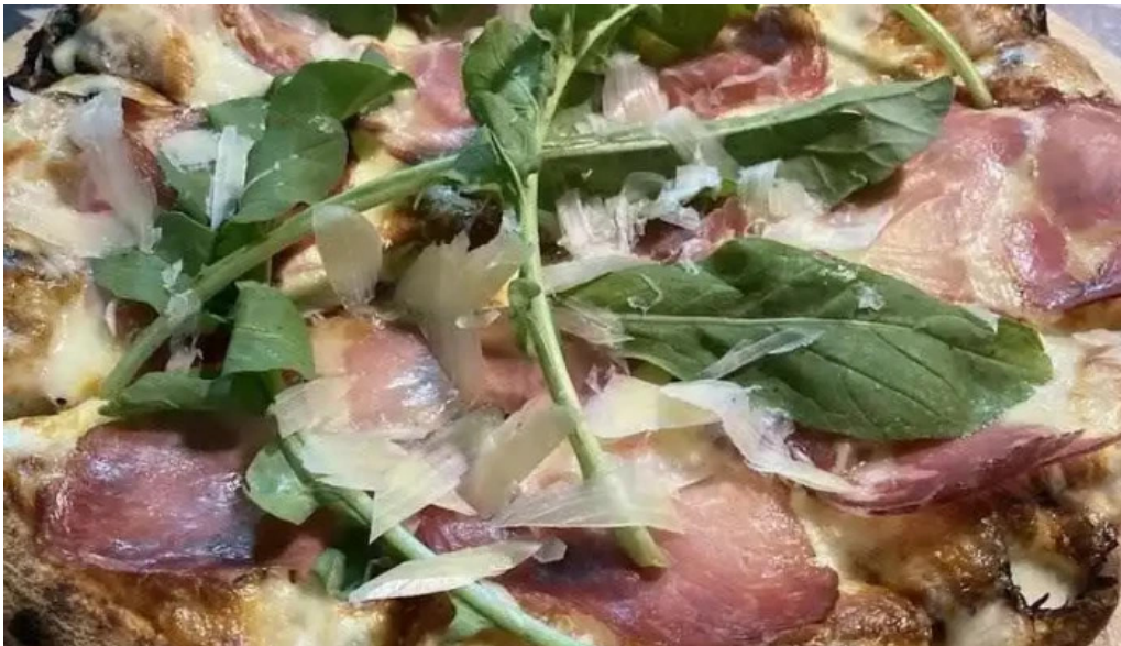
Pizzeria el horno de soca comida y bebida