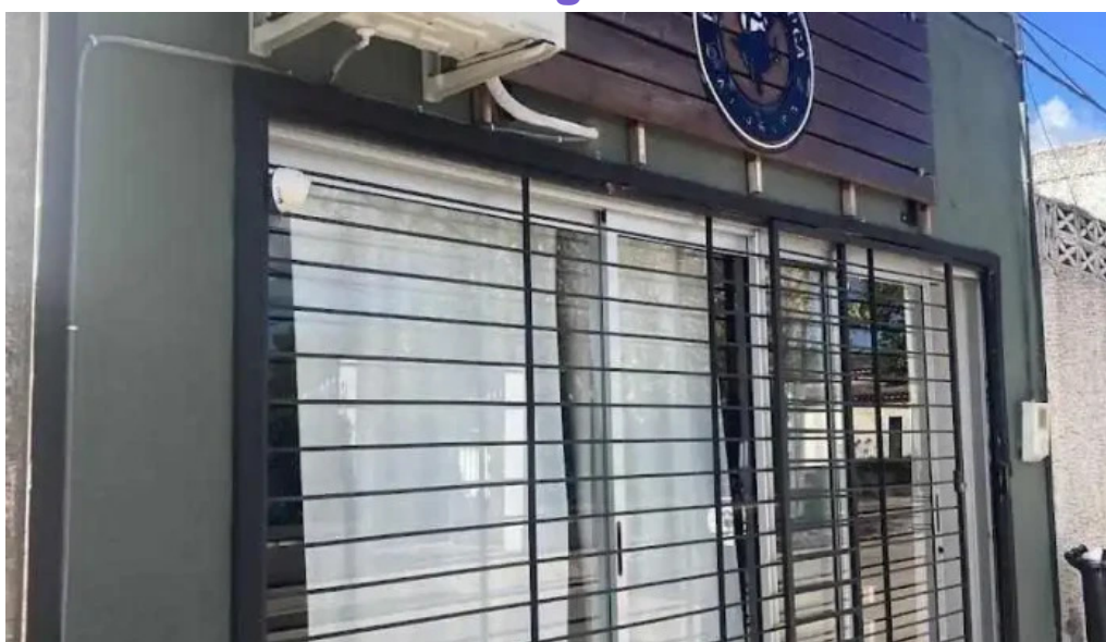
Pizzeria el horno de soca todas