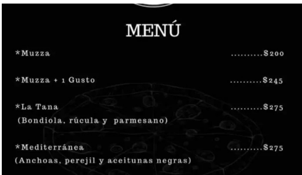
Pizzeria el horno de soca menu