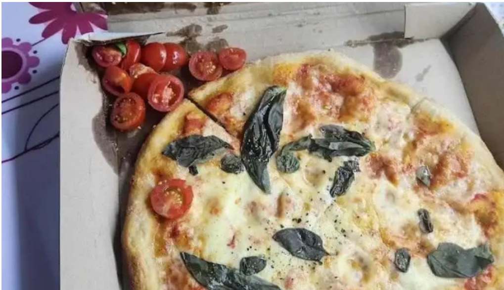
Pizza rosa comida y bebida