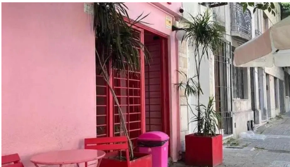
Pizza rosa ambiente