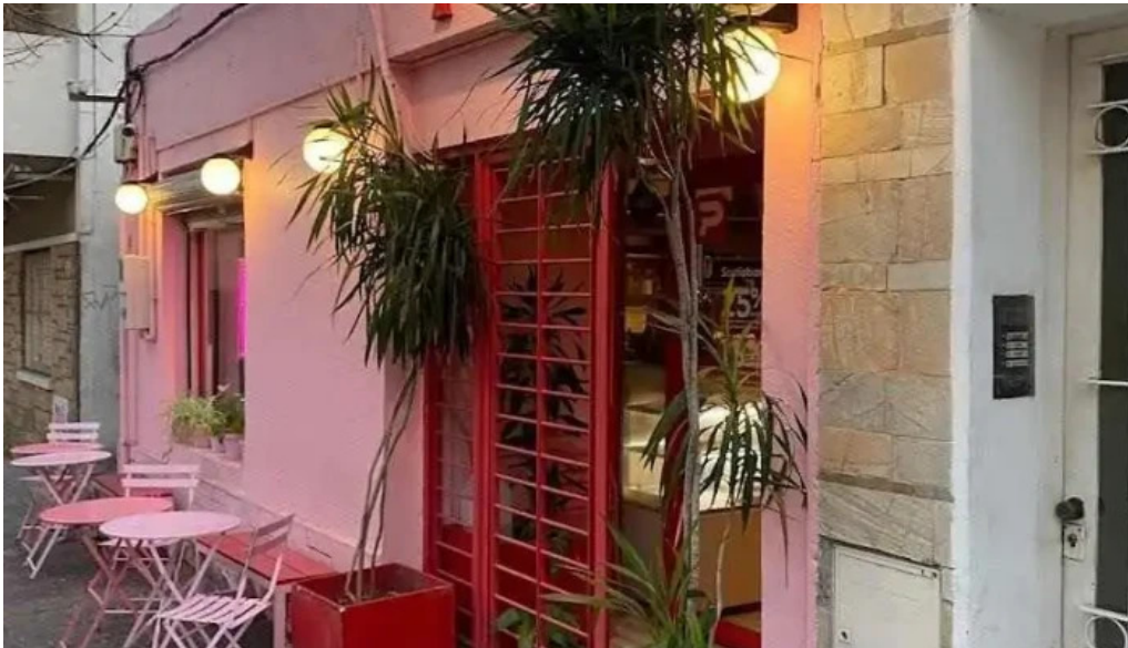
Pizza rosa todas