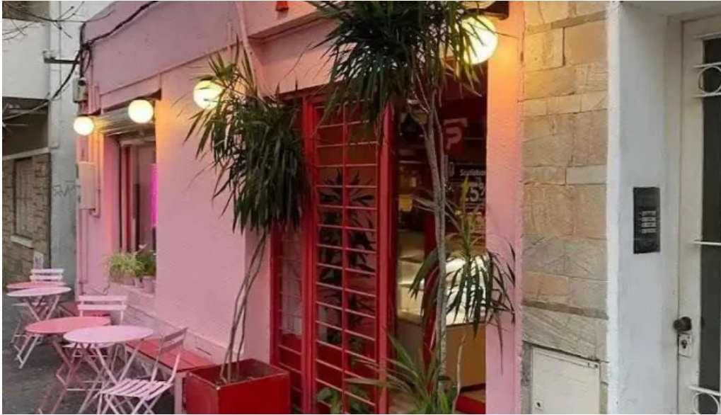
Pizza rosa montevideo