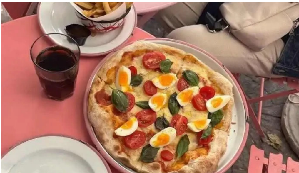
Pizza rosa pizza