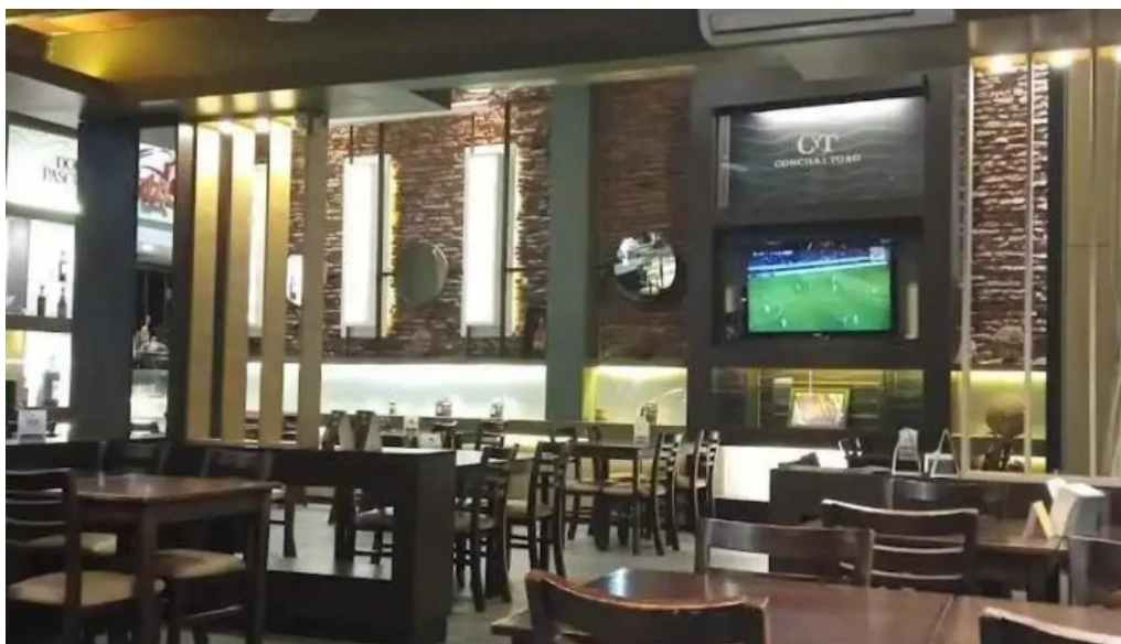
Pan z restaurante ambiente