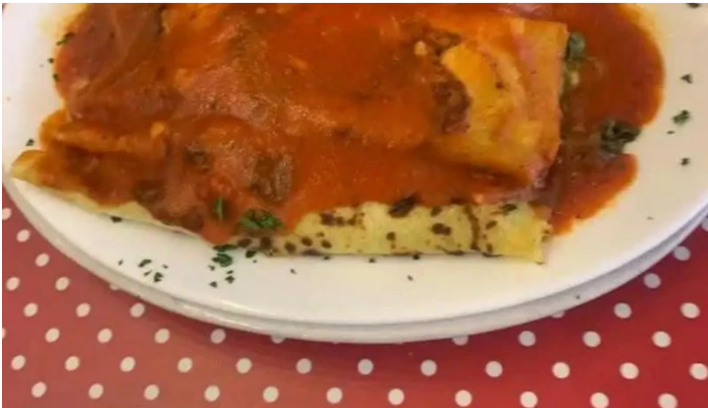
Pan z restaurante lasana