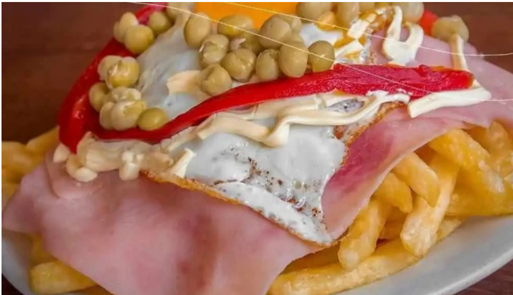
Pan z restaurante del propietario