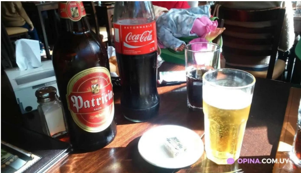
Pan z restaurante cerveza