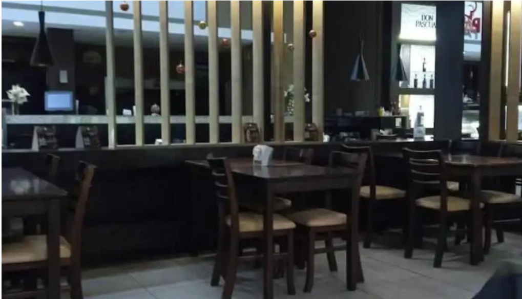
Pan z restaurante comida y bebida