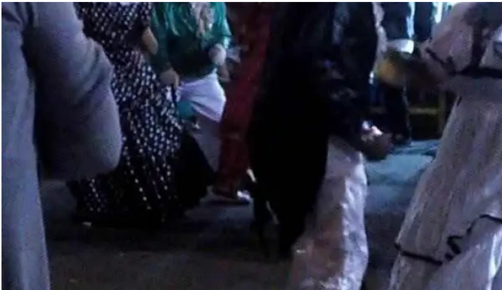
Pan z restaurante videos