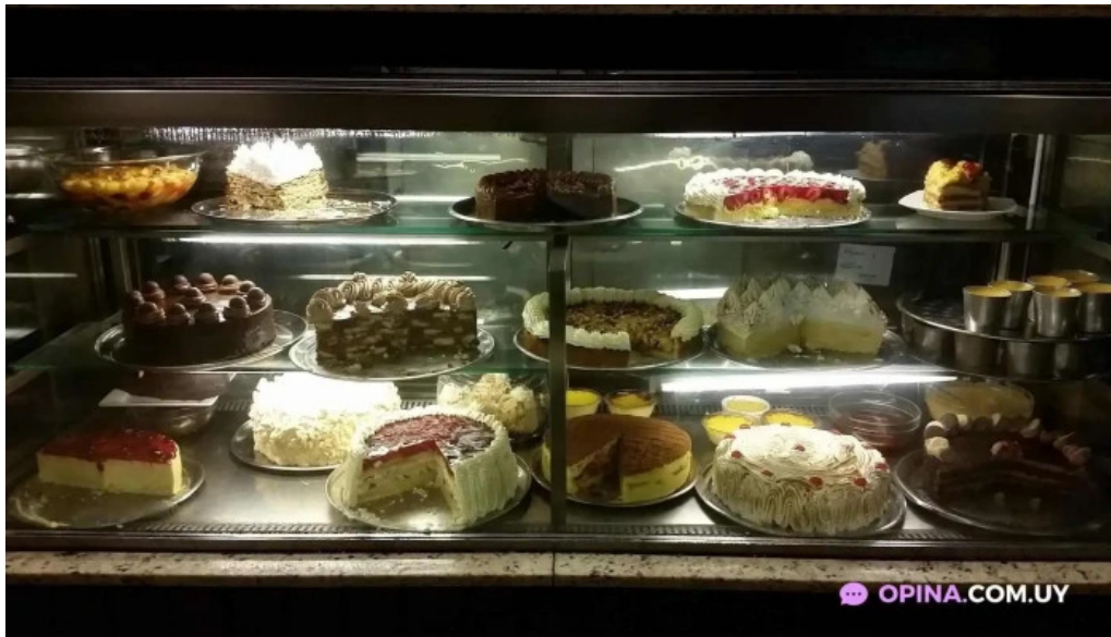
Pan z restaurante todas