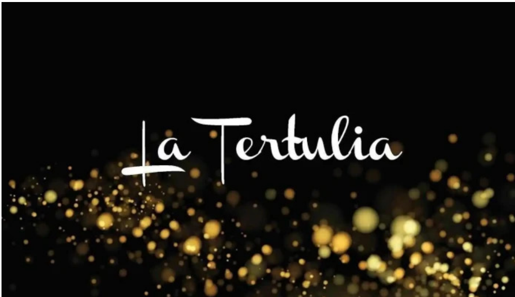
La tertulia del propietario