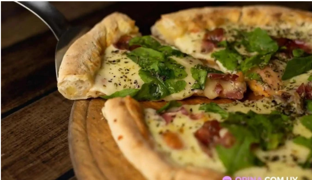
La tertulia mas recientes