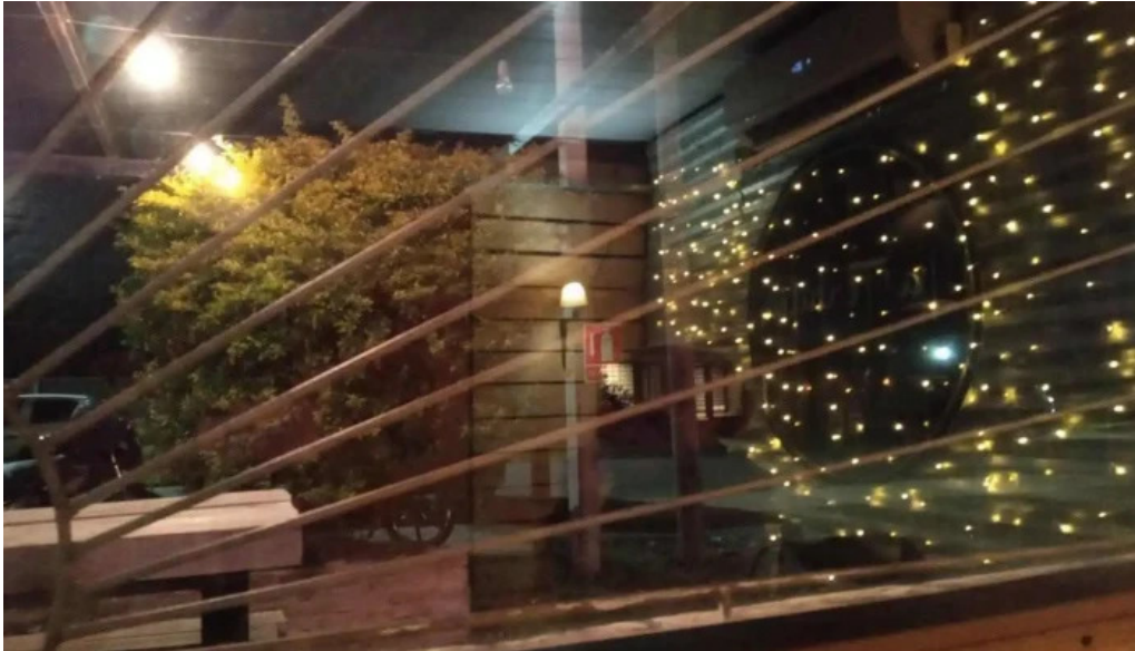
La tertulia ambiente