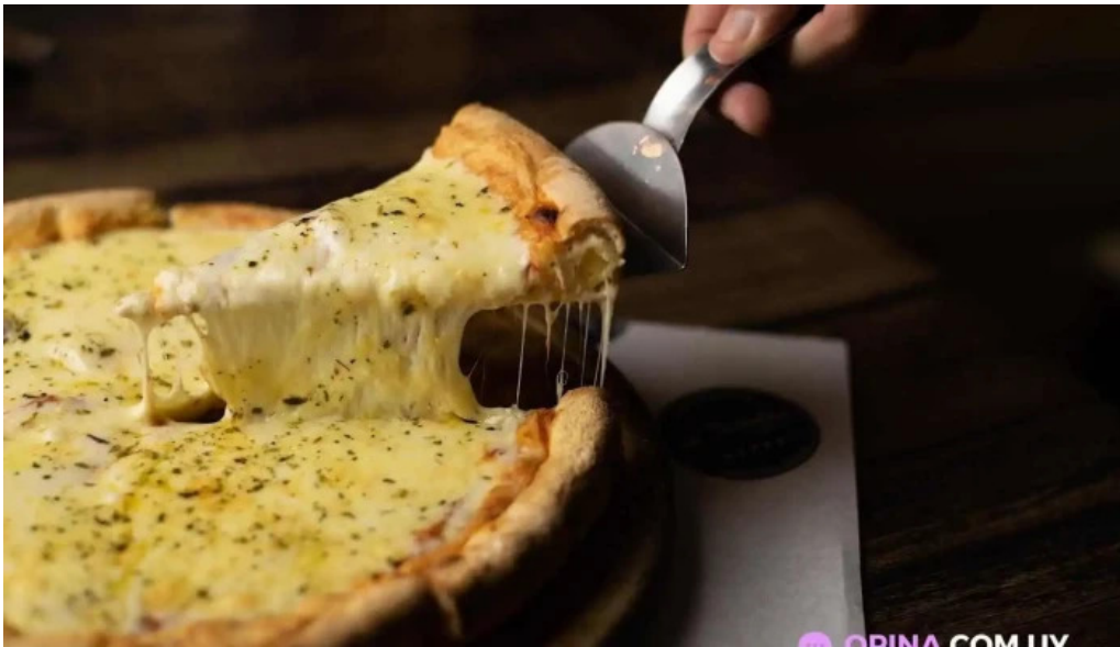
La tertulia comida y bebida