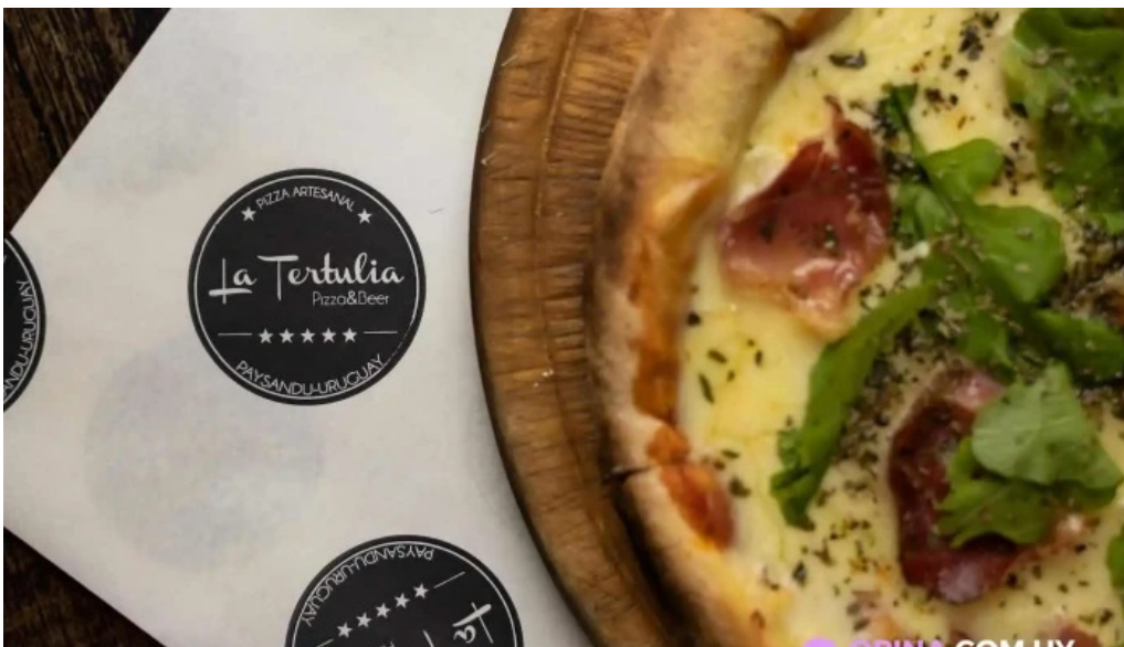
La tertulia pizza