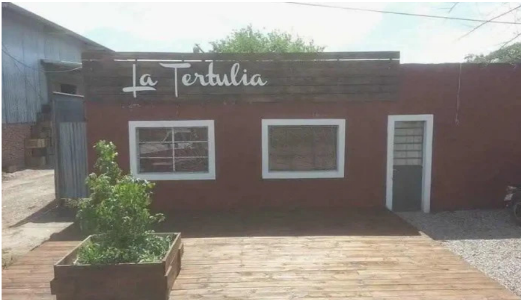
La tertulia nuevo paysandu