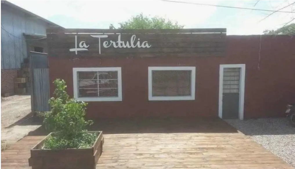
La tertulia todas