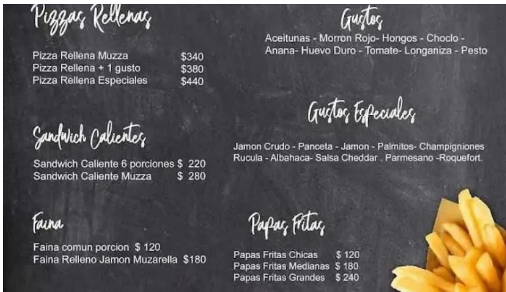
La tertulia menu