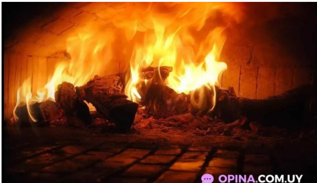
Pizzeria lele del propietario