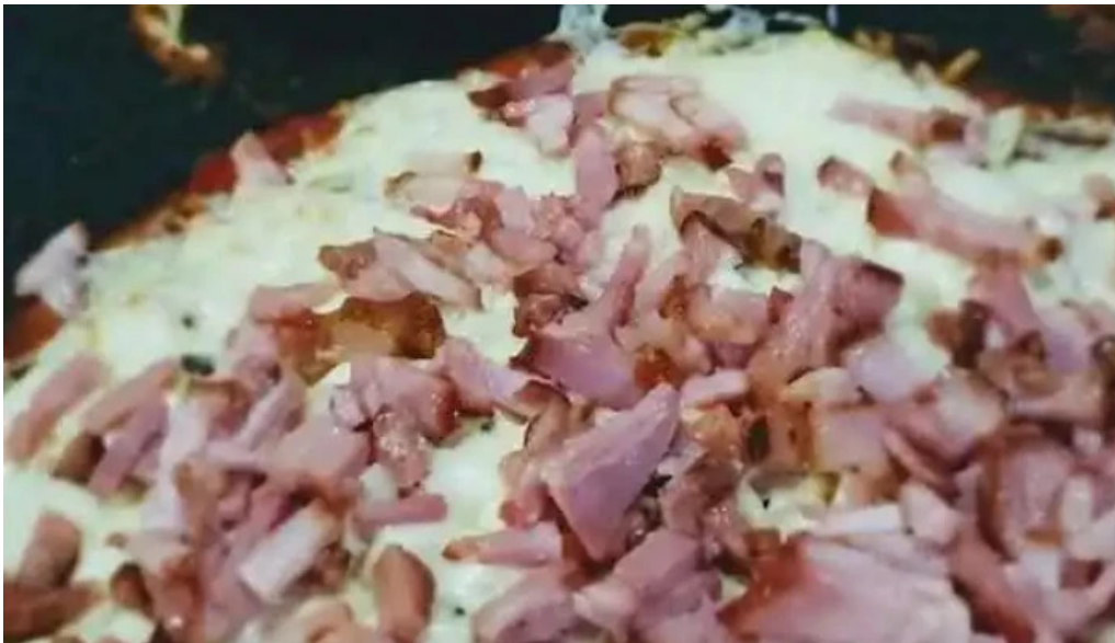
Pizzeria lele todas