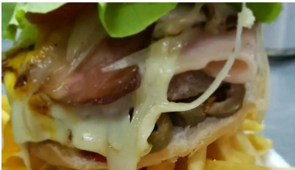
Pizzeria lele comida y bebida