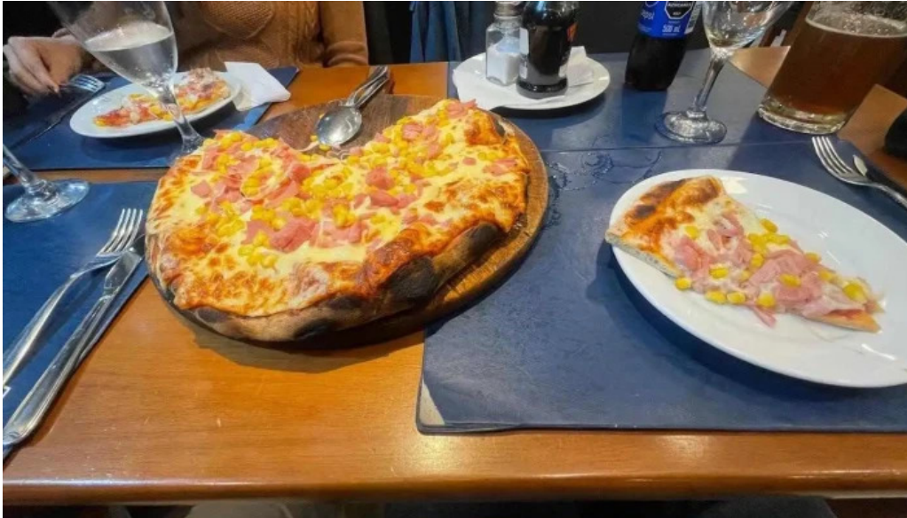
Pizzeria chez pineiro pizza