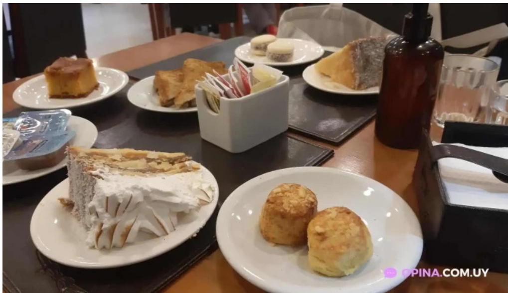
Pizzeria chez pineiro mas recientes