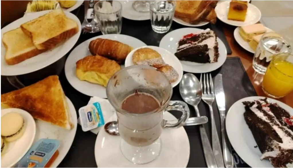
Pizzeria chez pineiro comida y bebida