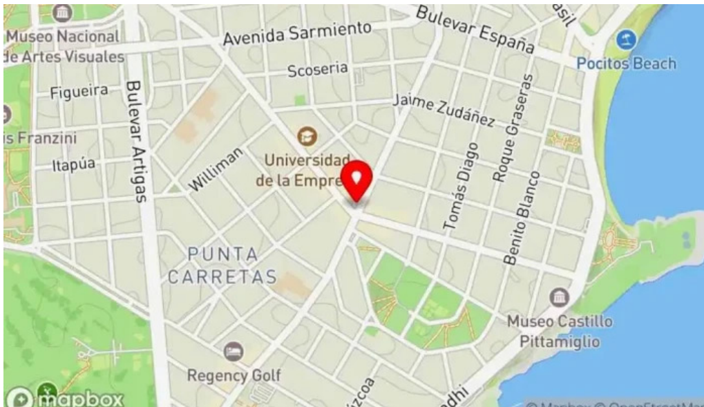
Pizzeria chez pineiro mapa