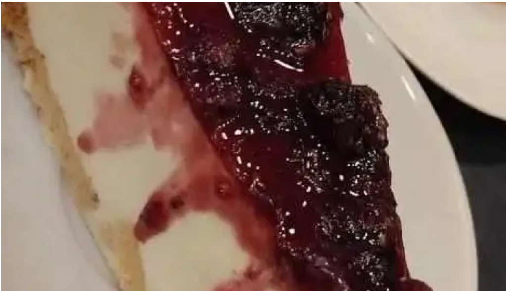
Pizzeria chez pineiro pastel de queso