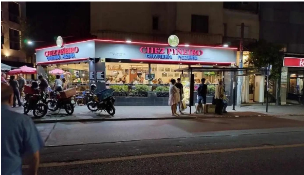
Pizzeria chez pineiro todas