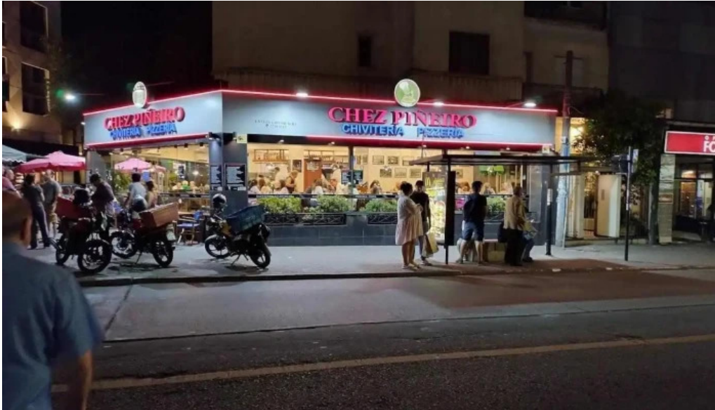
Pizzeria chez pineiro montevideo