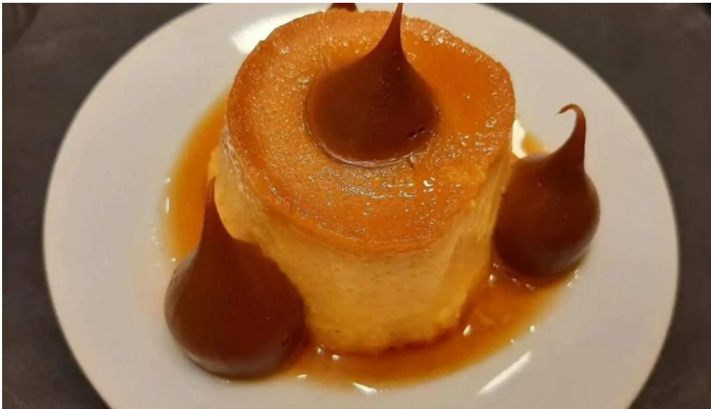
Pizzeria chez pineiro flan