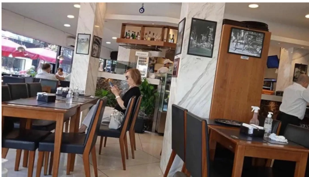
Pizzeria chez pineiro ambiente