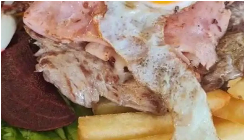
Pizzeria chez pineiro chivito