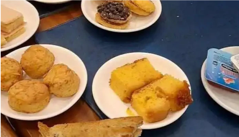
Pizzeria chez pineiro videos