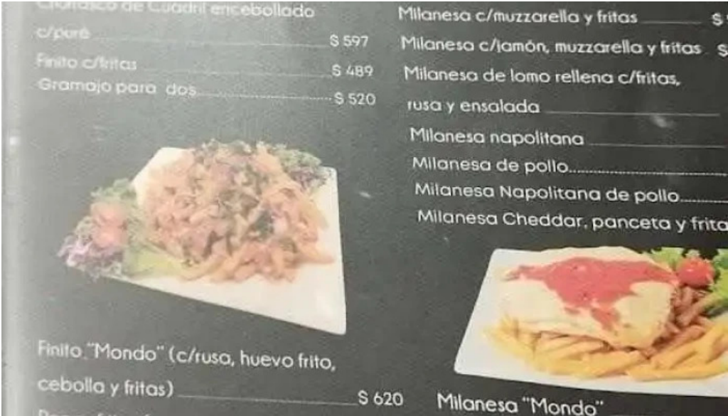
Il mondo della pizza menu