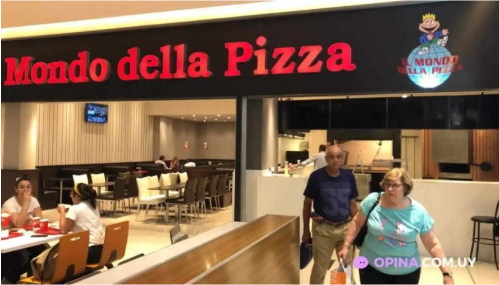
Il mondo della pizza montevideo