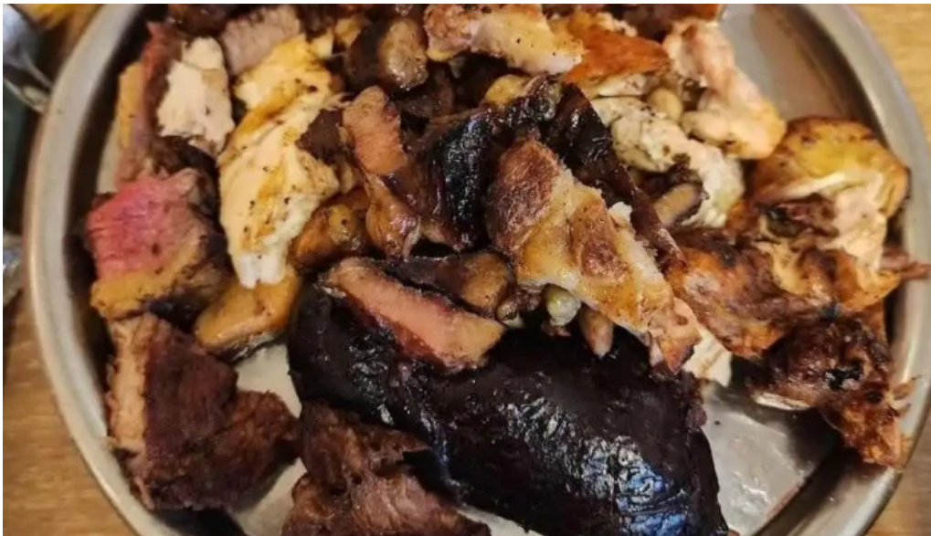
Il mondo della pizza comida y bebida