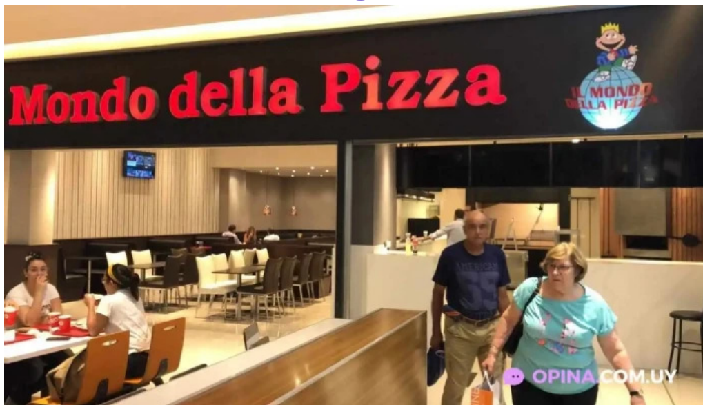
Il mondo della pizza todas