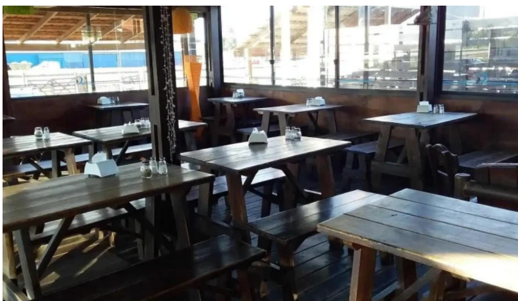
Mar abierto ambiente