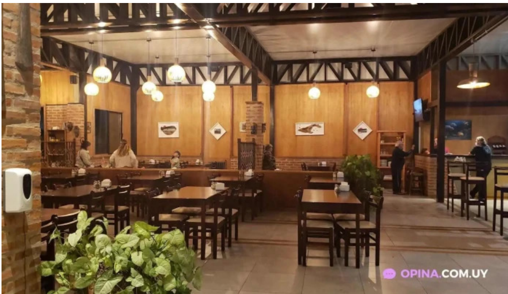
Mar abierto todas