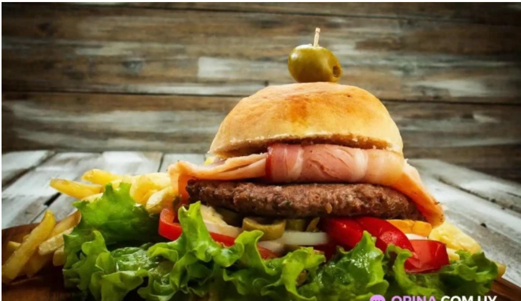
Mar abierto comida y bebida