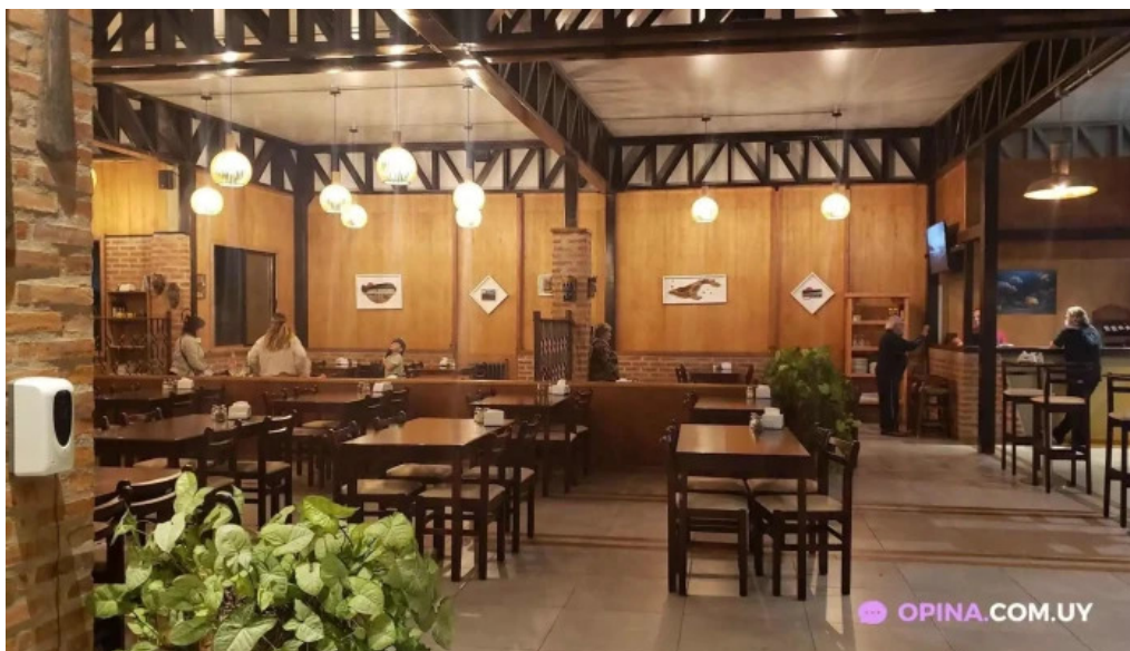
Mar abierto ciudad de la costa