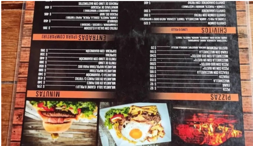
Mar abierto menu