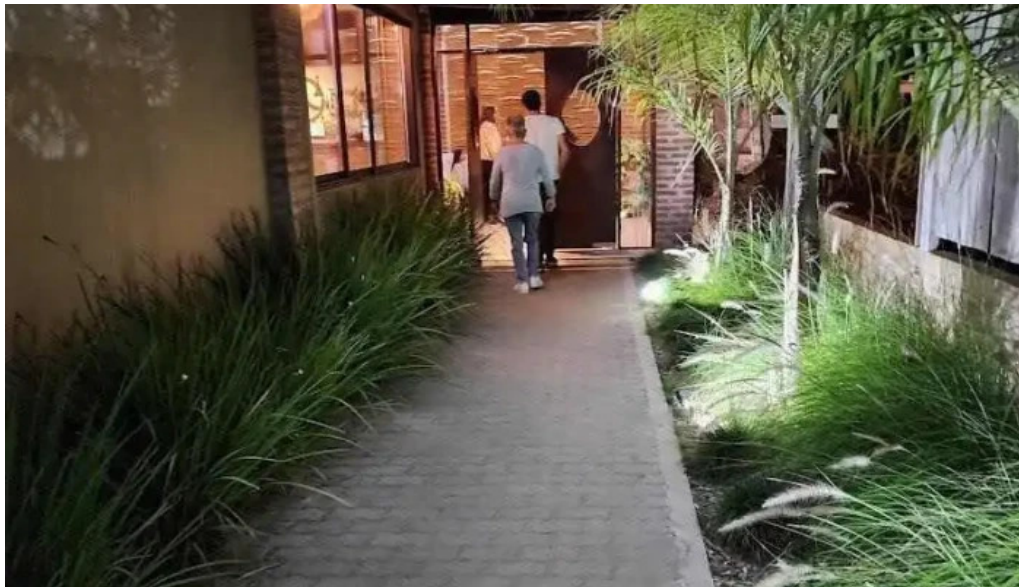
Mar abierto mas recientes