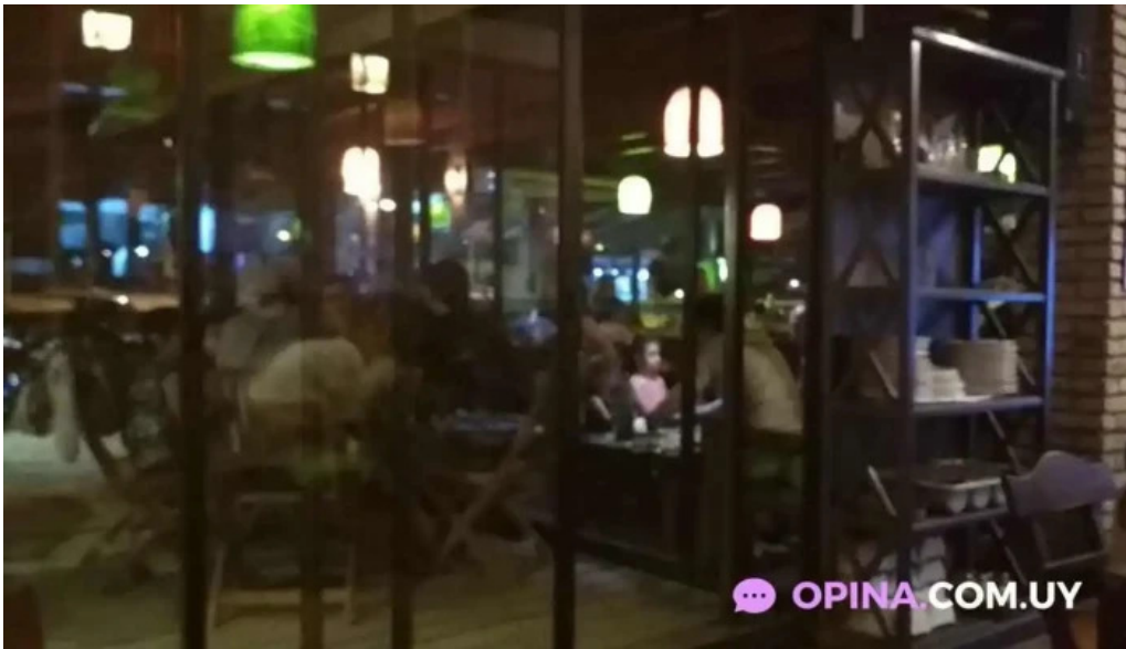
Mar abierto videos