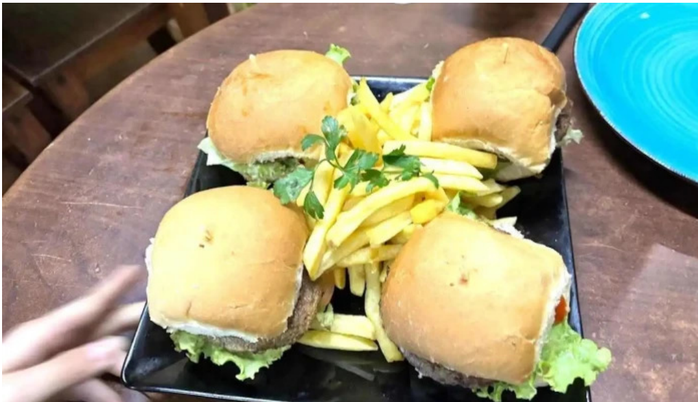
Pizzeria el gallego comida y bebida