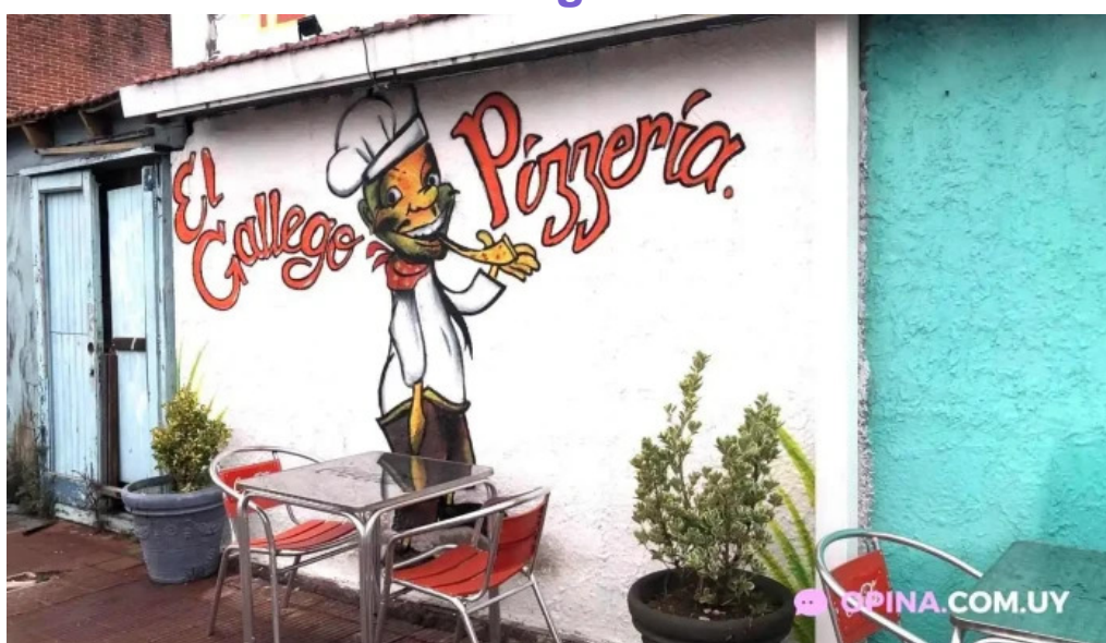
Pizzeria el gallego todas