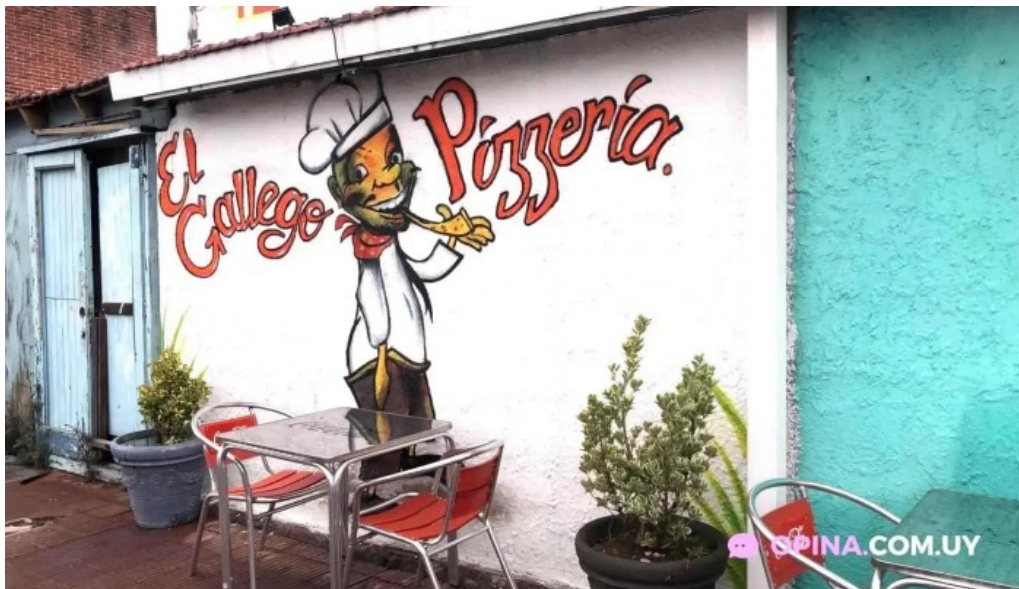
Pizzeria el gallego maldonado