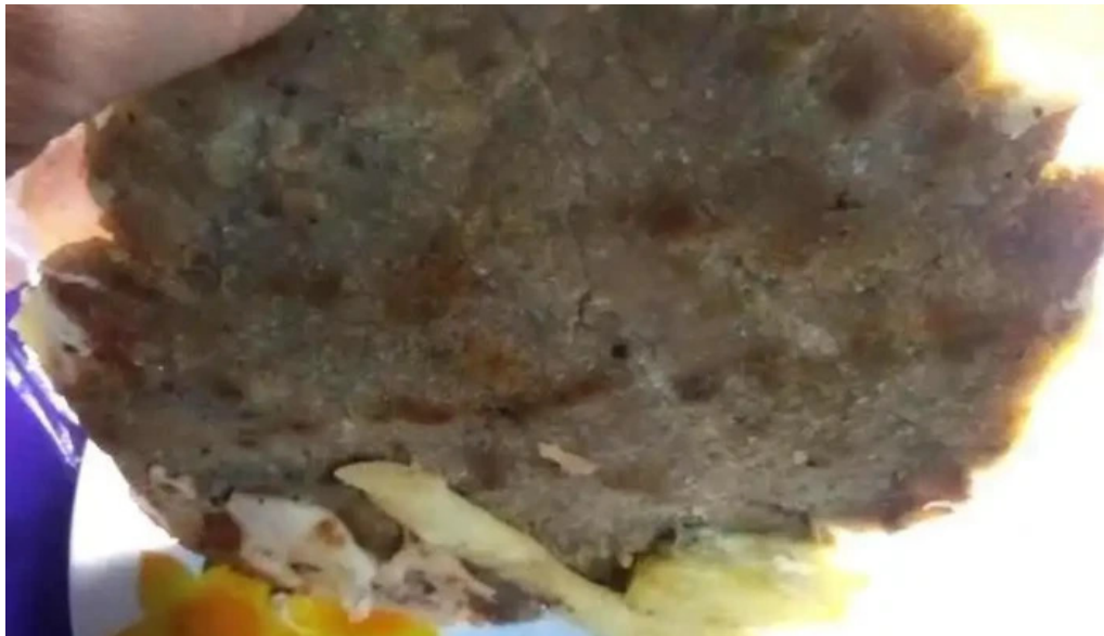
Pizzeria el gallego mas recientes