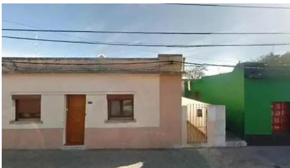
Pizzeria el gallego street view y 360