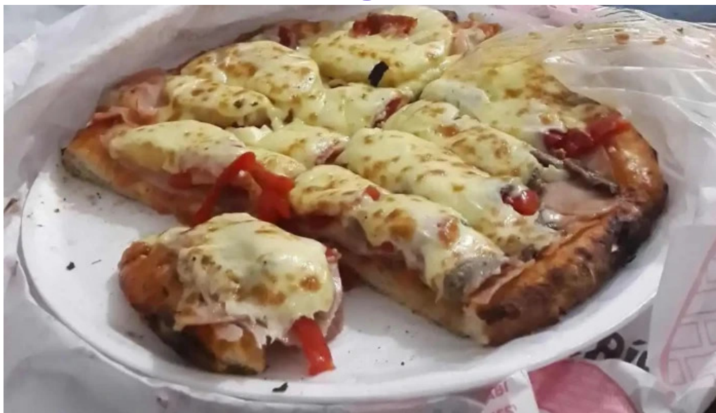
Los tarez todas