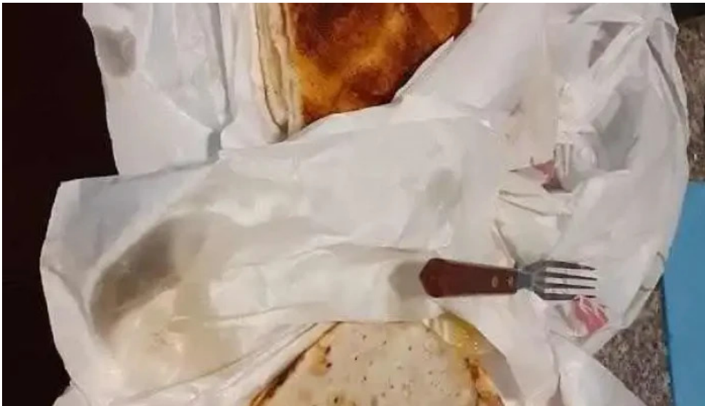
Los tarez comida y bebida