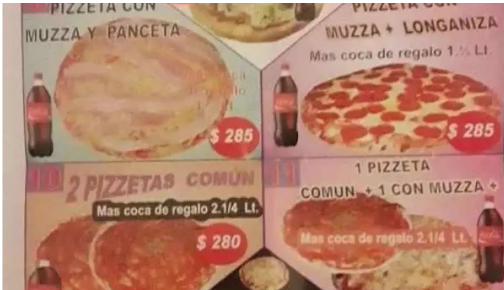
Los hermanos menu