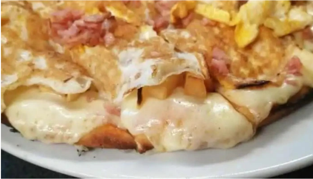
Los hermanos todas