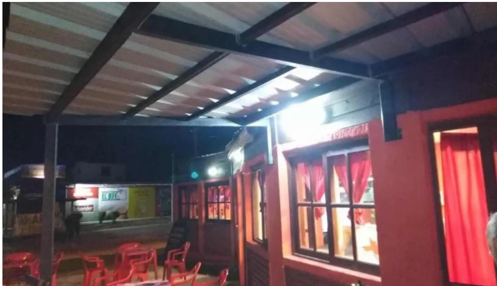
Los hermanos ambiente