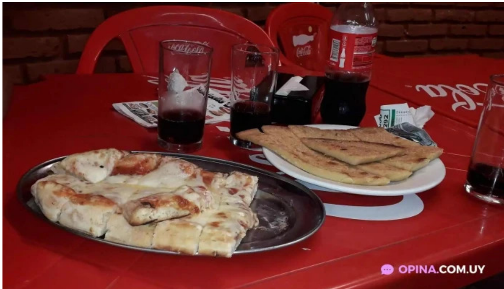
Los hermanos comida y bebida