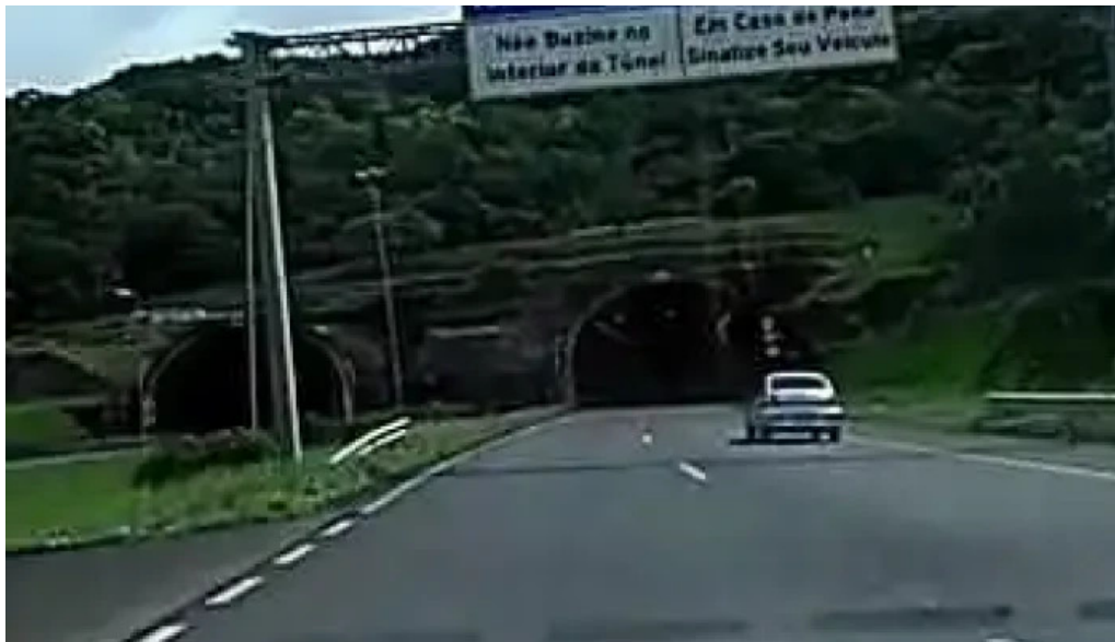
Los hermanos videos