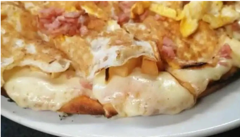
Los hermanos montevideo