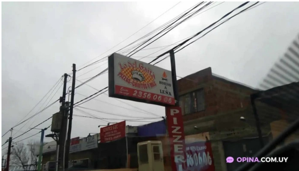
Lo del gaita videos