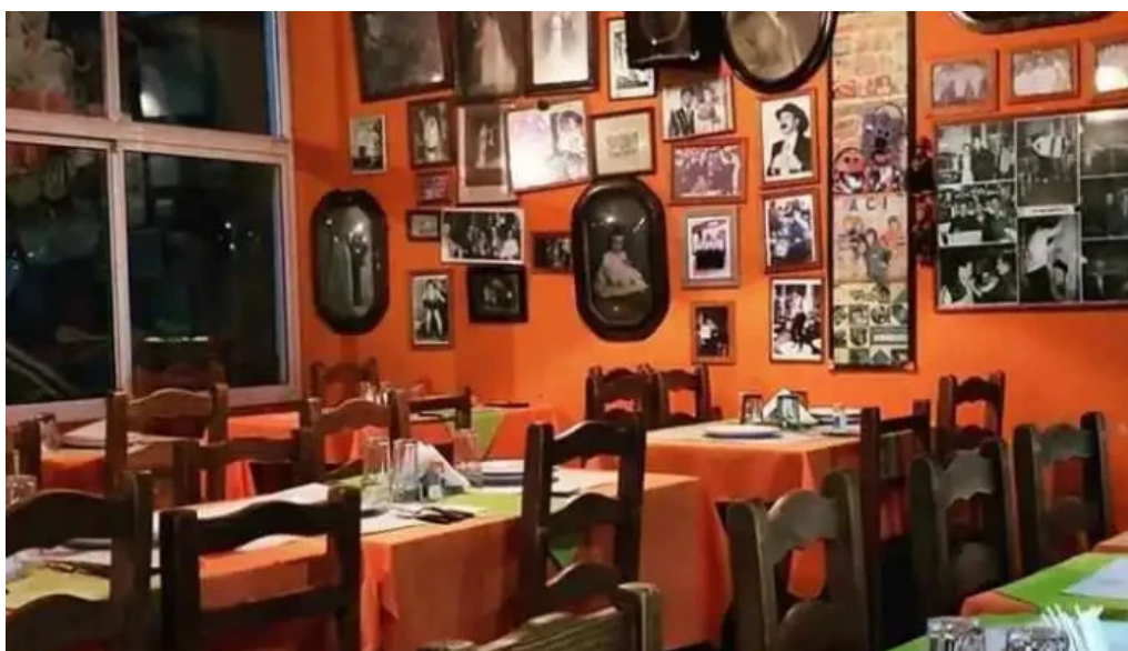
Lo del gaita ambiente