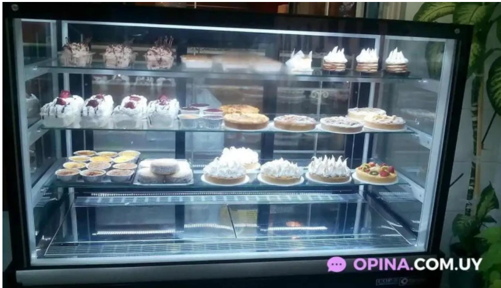
Lo del gaita todas