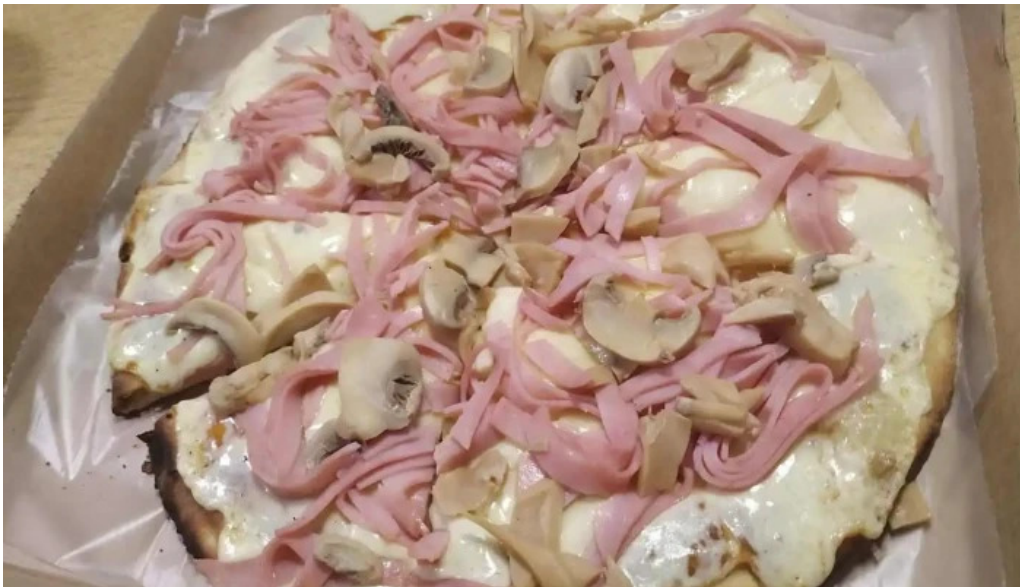
Lo del gaita comida y bebida