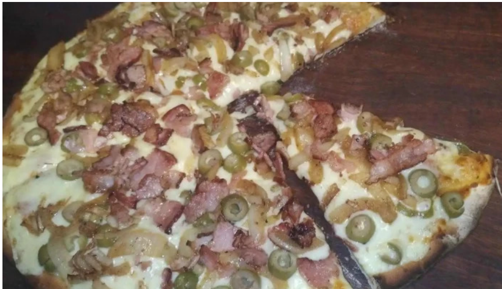
Lo del gaita pizza