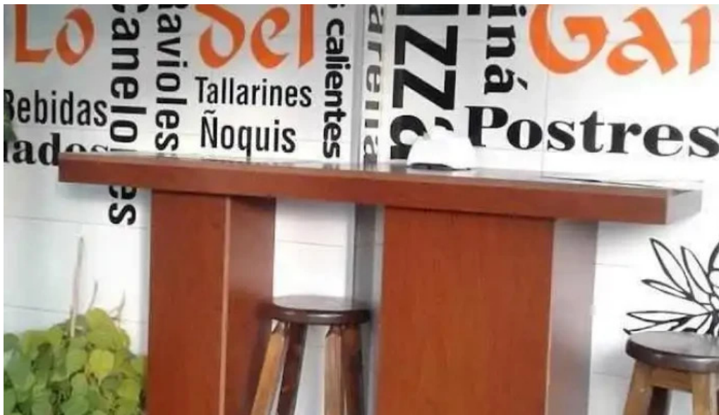
Lo del gaita menu