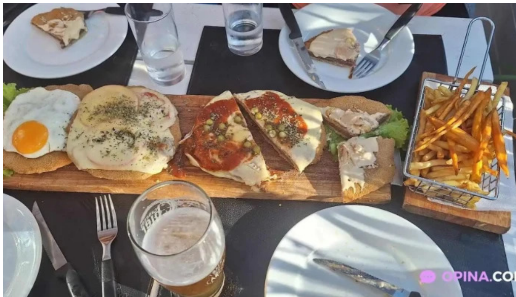
Il mondo della pizza mas recientes