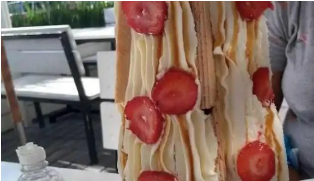
Il mondo della pizza comida y bebida