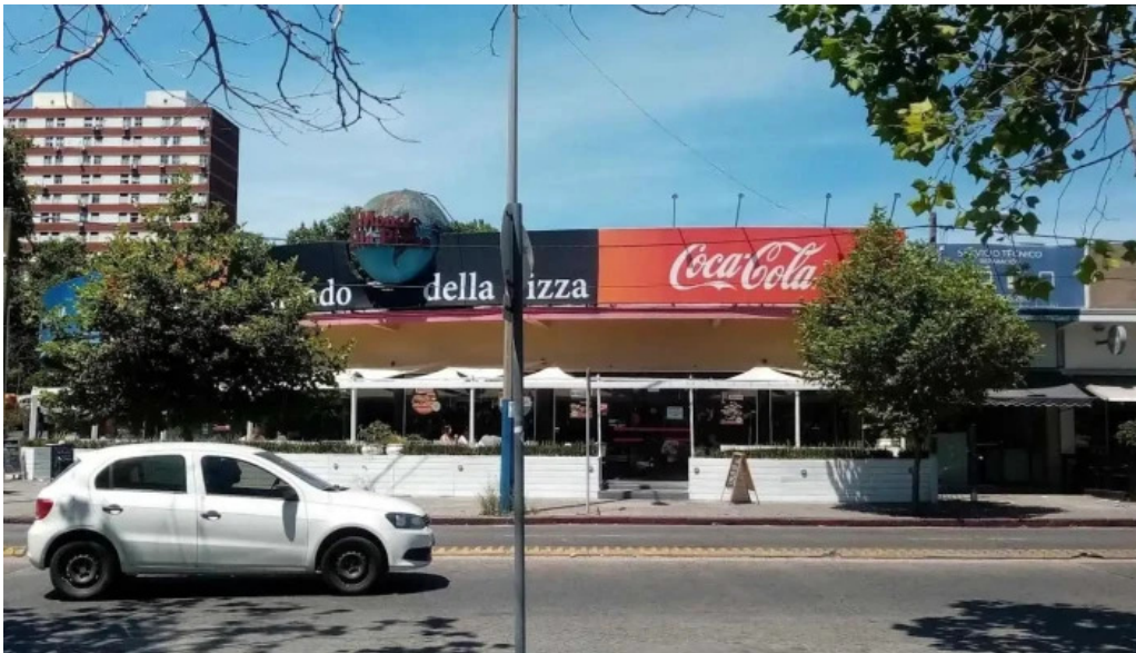
Il mondo della pizza todas