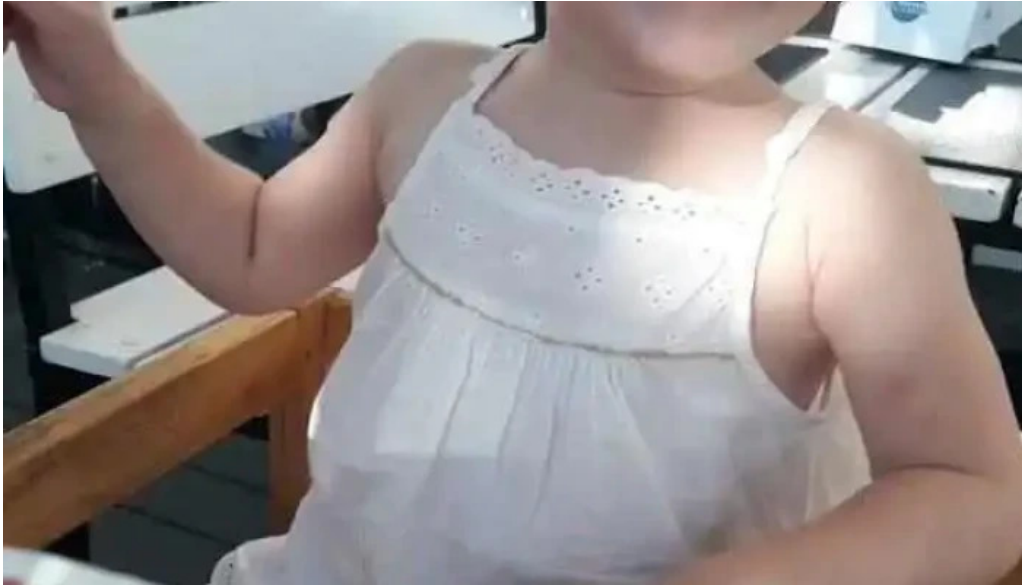
Il mondo della pizza videos