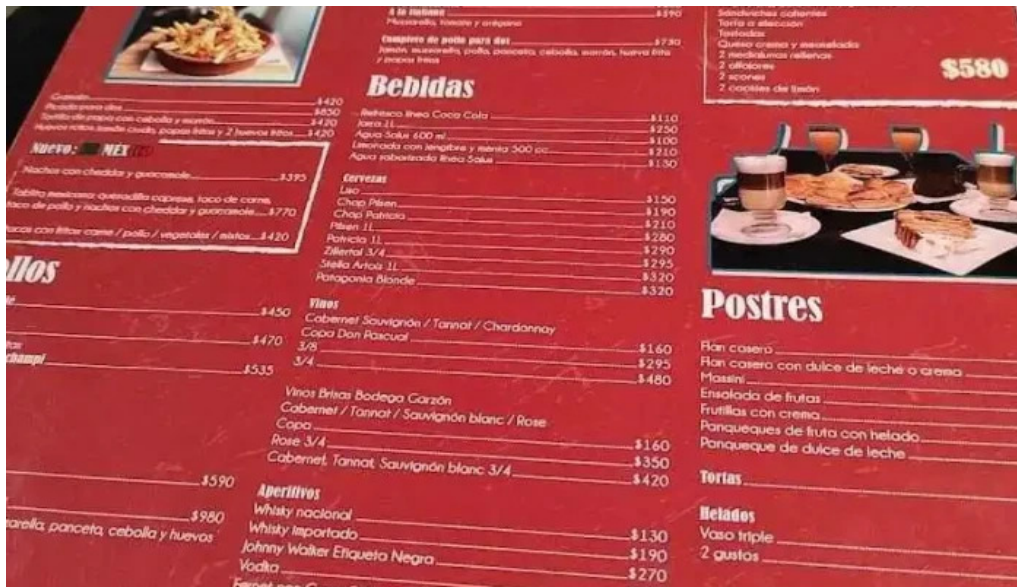
Il mondo della pizza menu