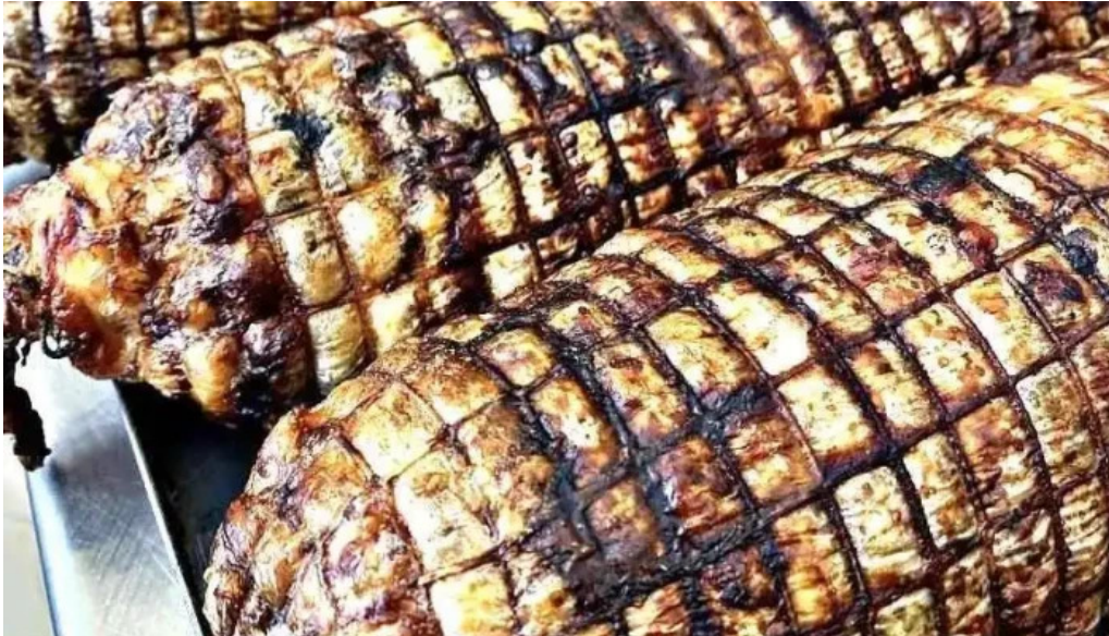
Frami comida y bebida