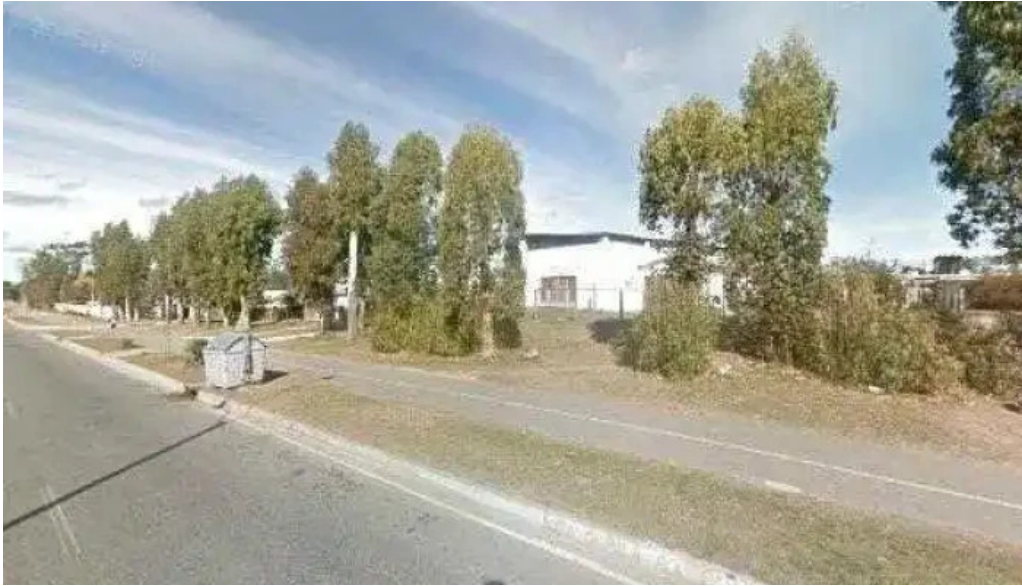
Frami street view y 360