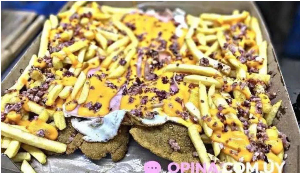
Frami papas fritas con queso