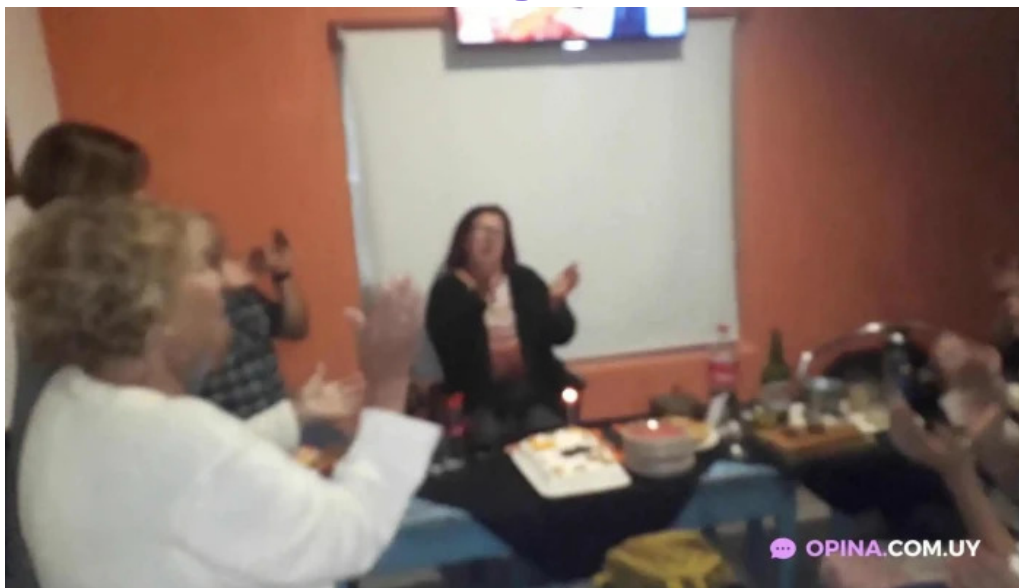
El maestro pizzeriachiveteria videos