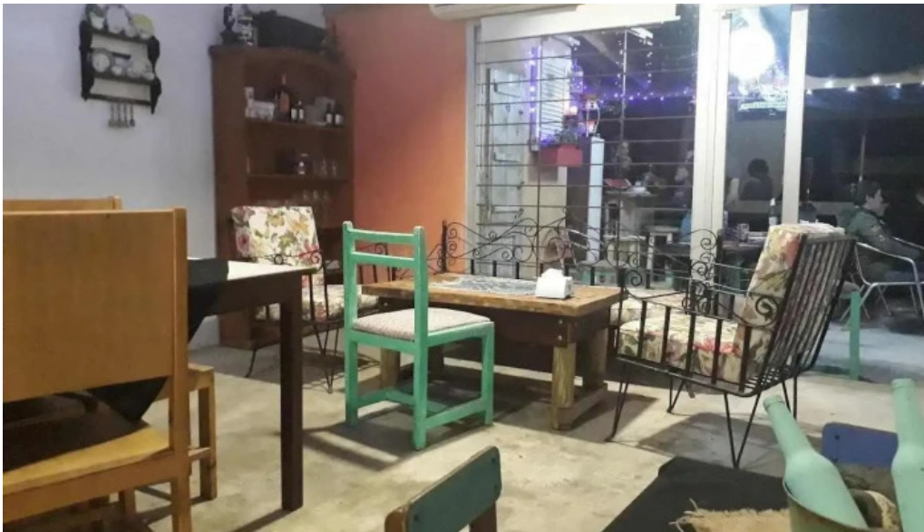
El maestro pizzeria chiveteria san carlos