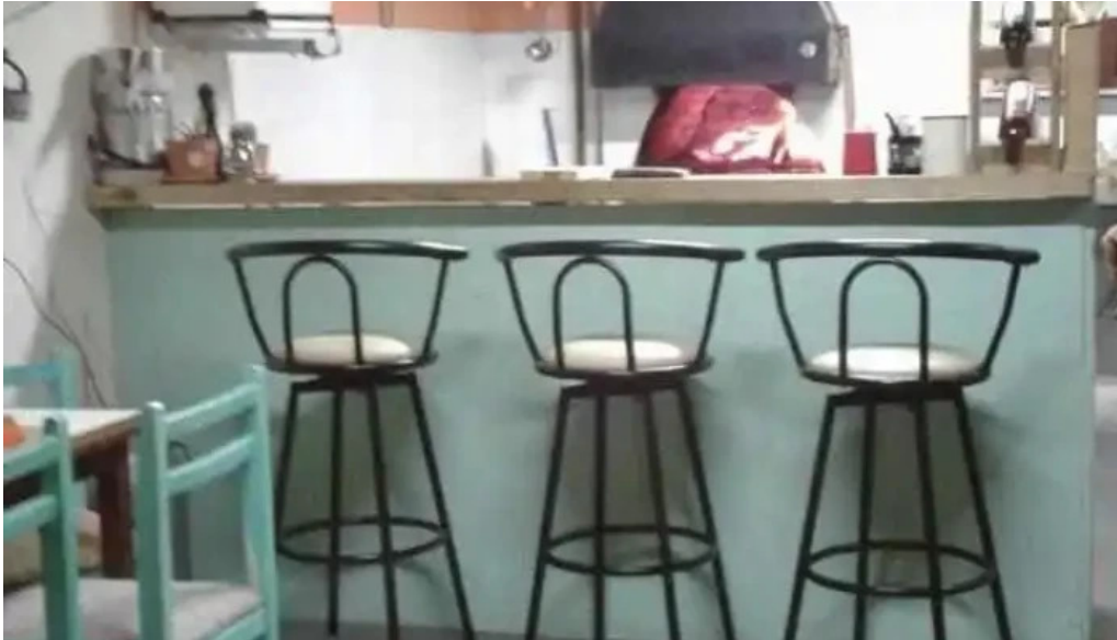
El maestro pizzeriachiveteria ambiente