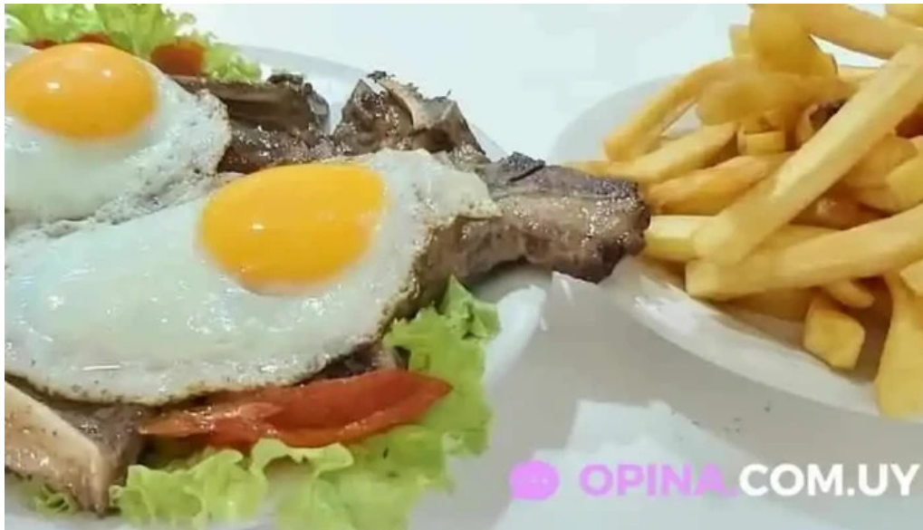
El imperio de la pizza comida y bebida