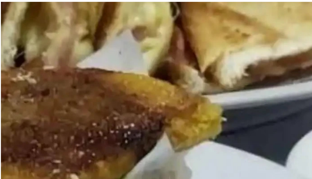
El imperio de la pizza videos