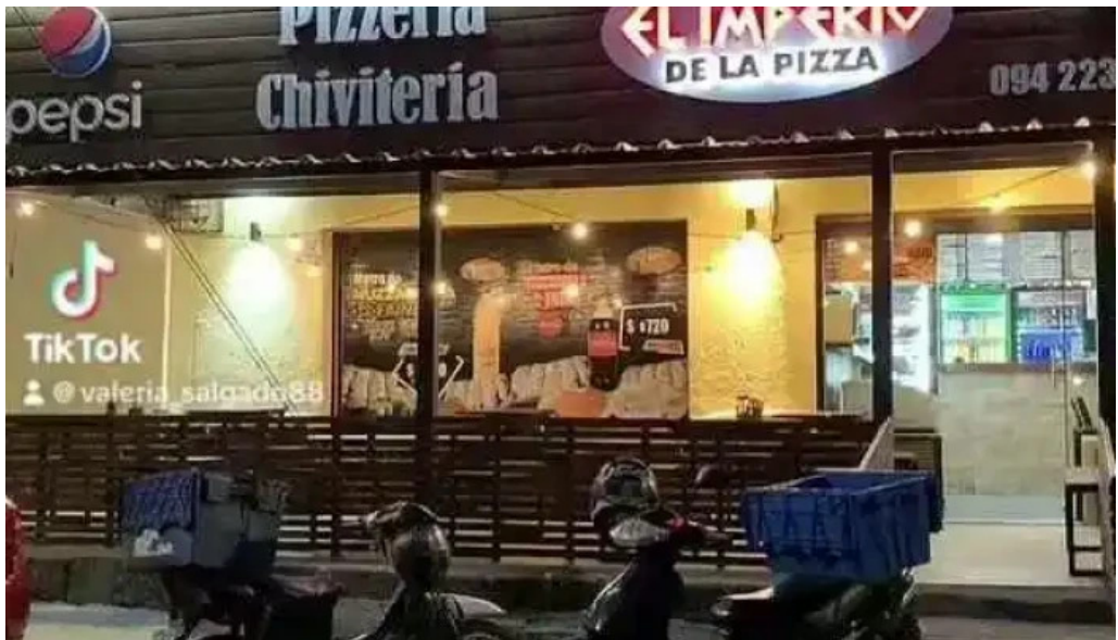
El imperio de la pizza la paz