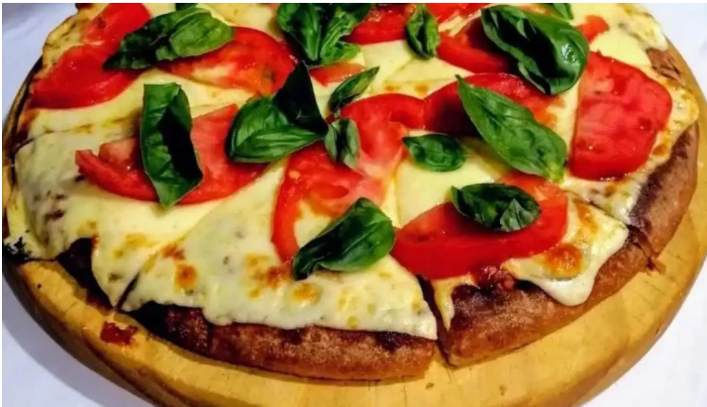
El imperio de la pizza pizza