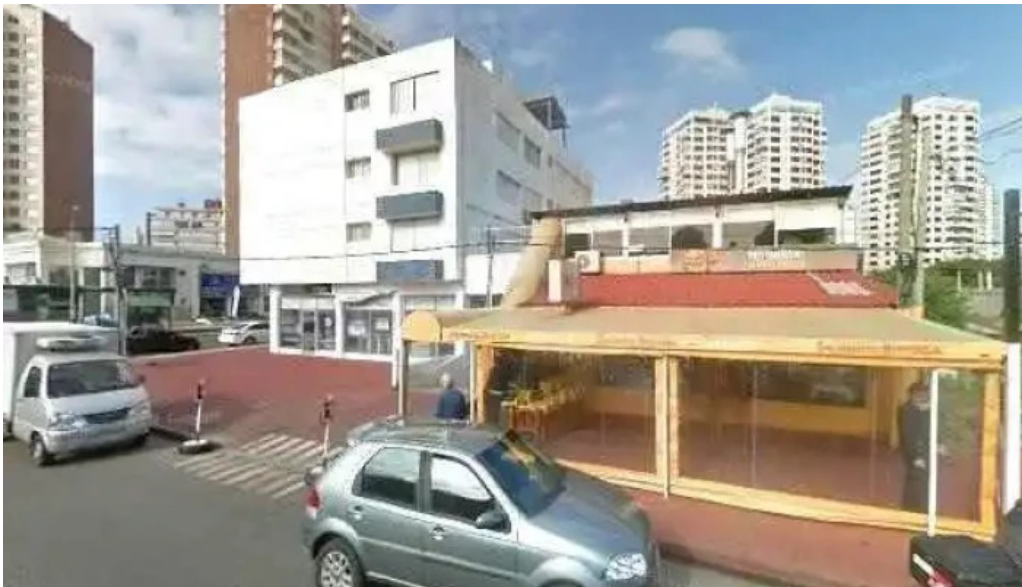
El horno de juan street view y 360