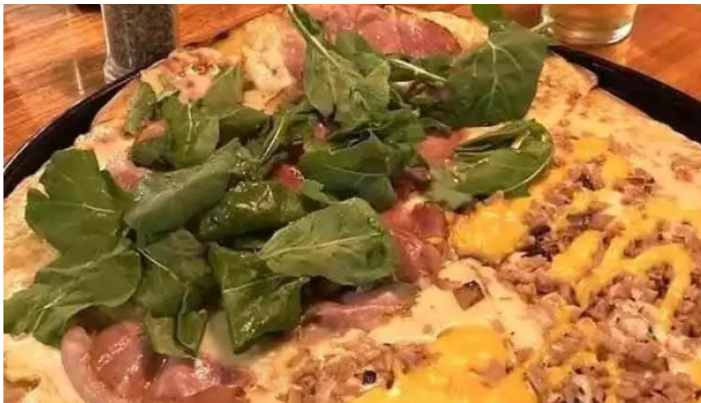
El horno de juan mas recientes