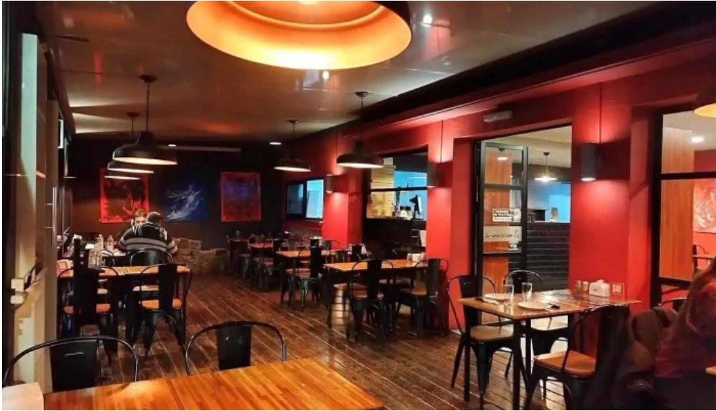
El horno de juan punta del este