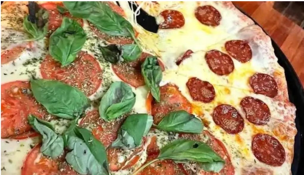
El horno de juan pizza