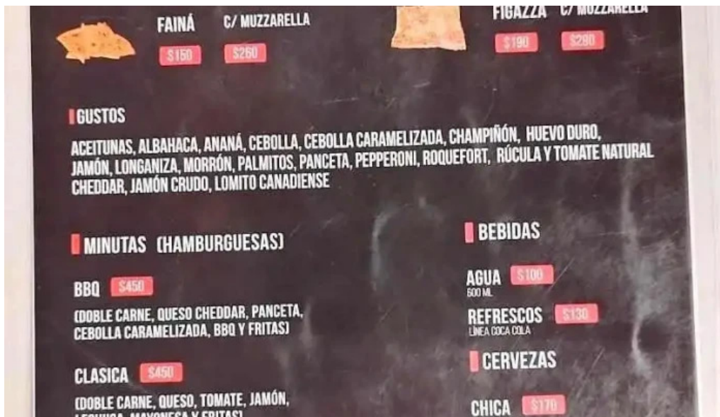
El horno de juan menu