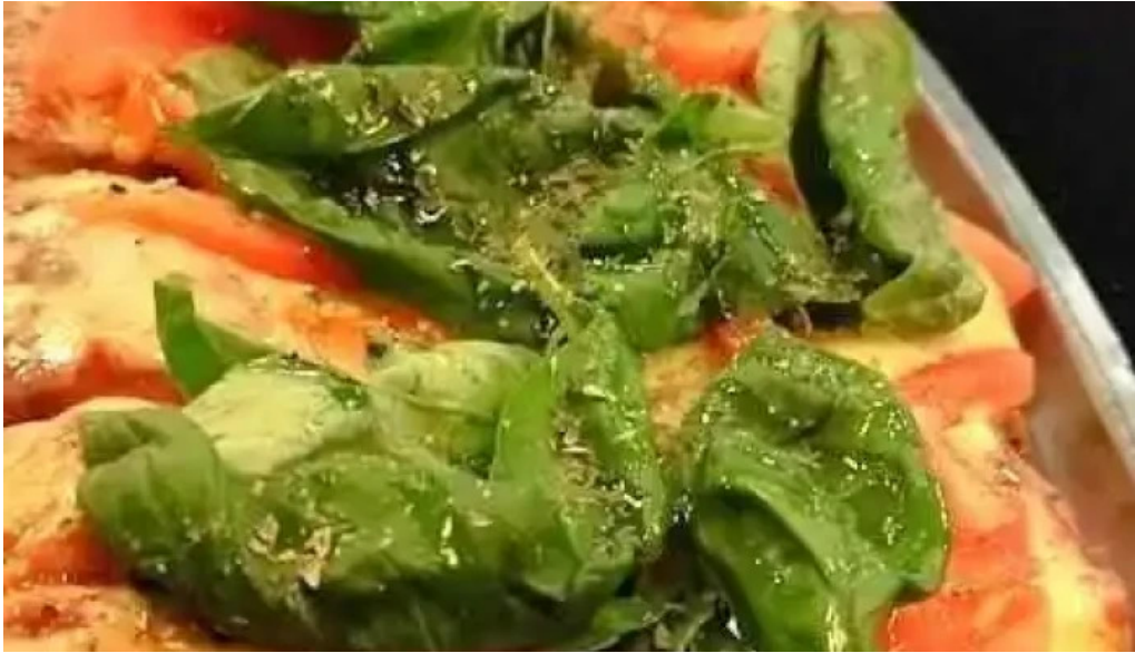
El horno de juan comida y bebida