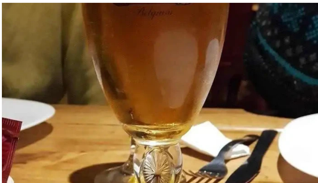
El hornito stella artois