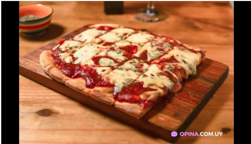
El hornito pizza