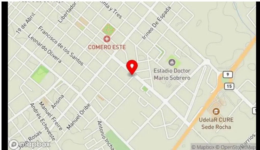
El hornito mapa