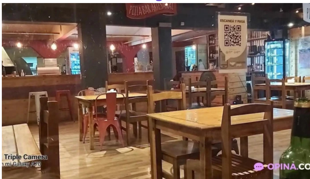
El hornito todas