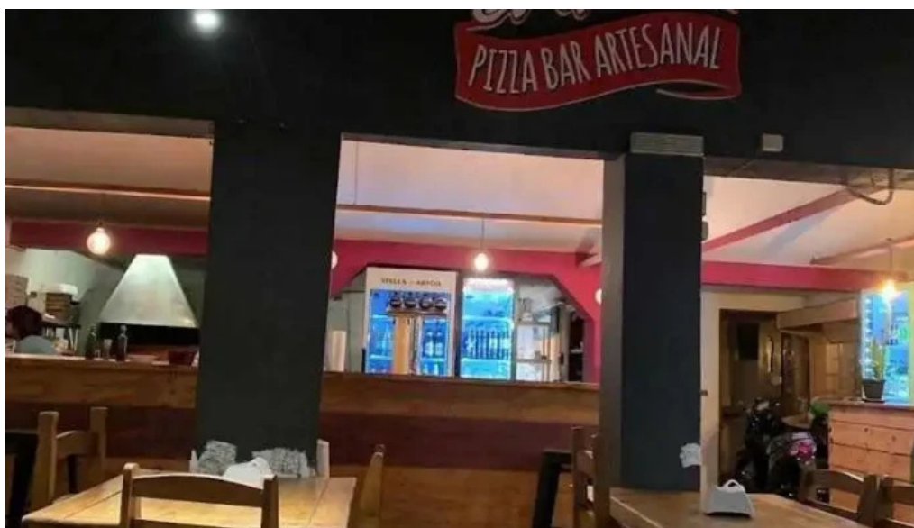
El hornito ambiente