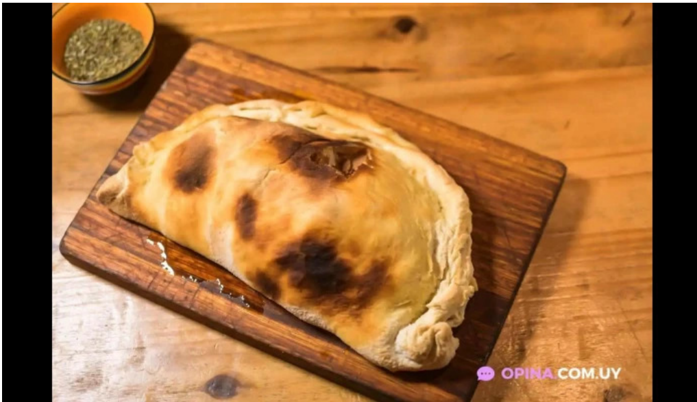
El hornito del propietario