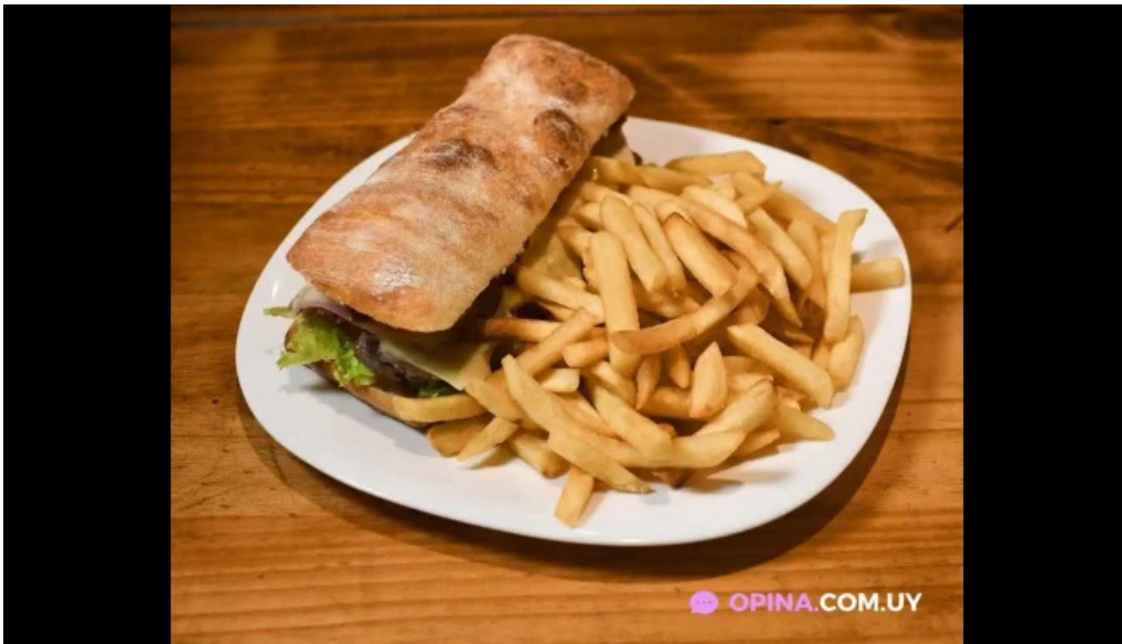
El hornito comida y bebida