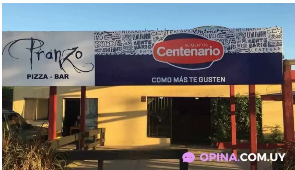
Pizzeria pranzo ciudad de la costa