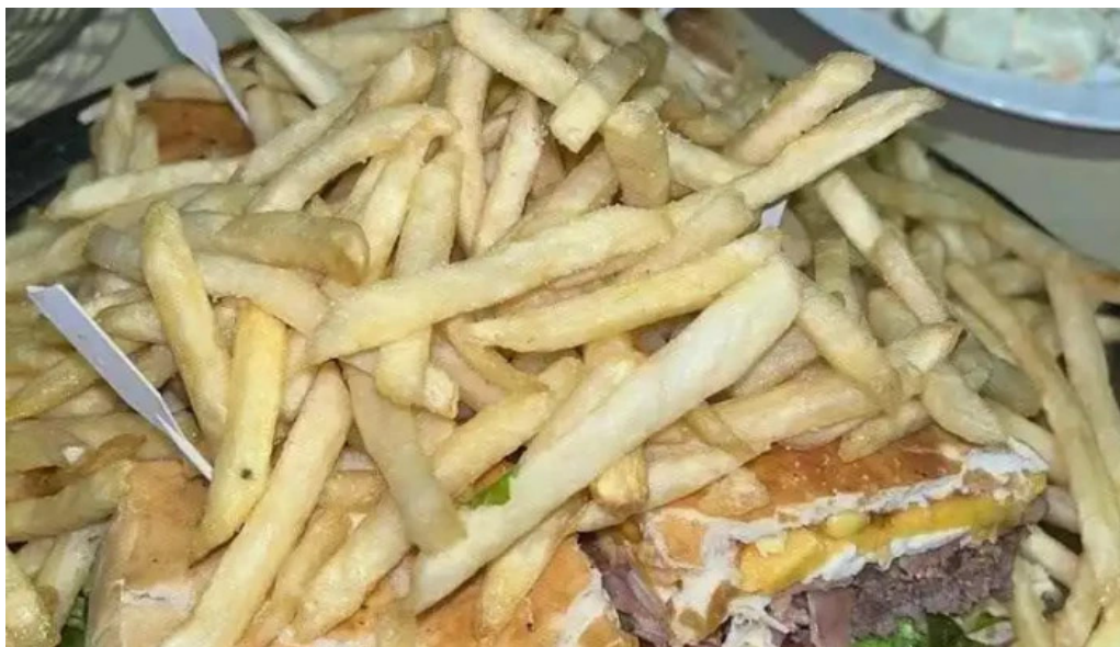
Pizzeria pranzo comida y bebida