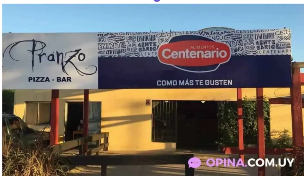
Pizzeria pranzo todas