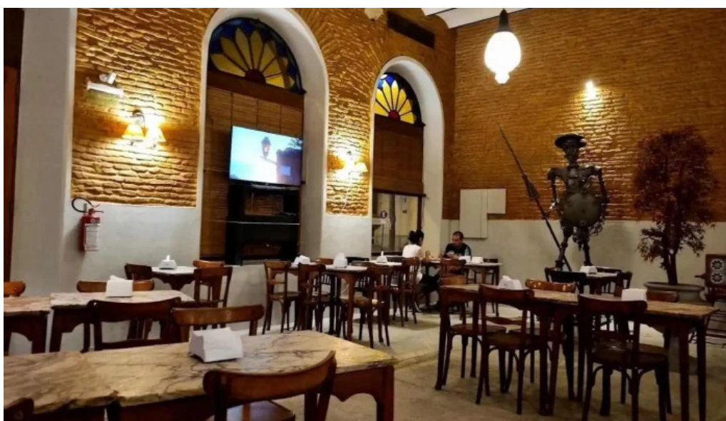
Bar tasende todas