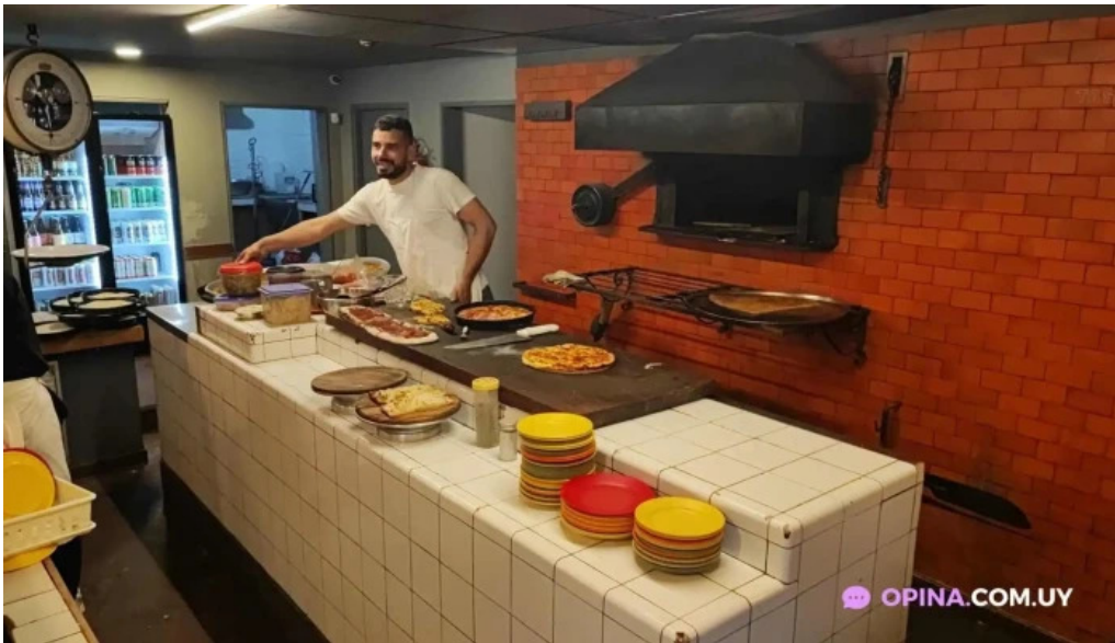
Bar tasende pizza