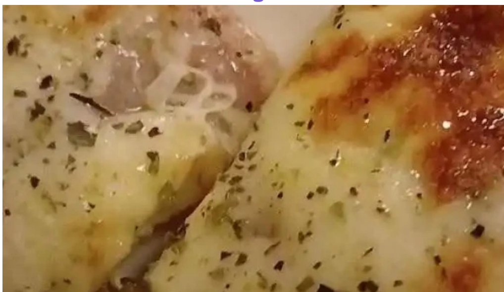
Bar tasende videos