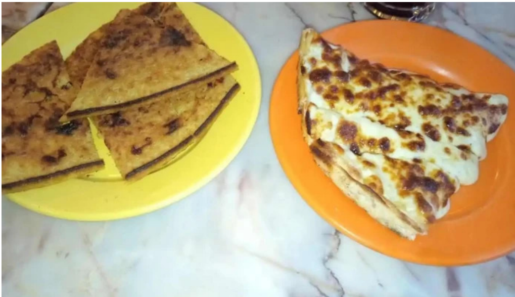
Bar tasende mas recientes