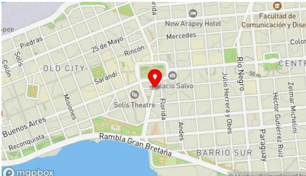
Bar tasende mapa