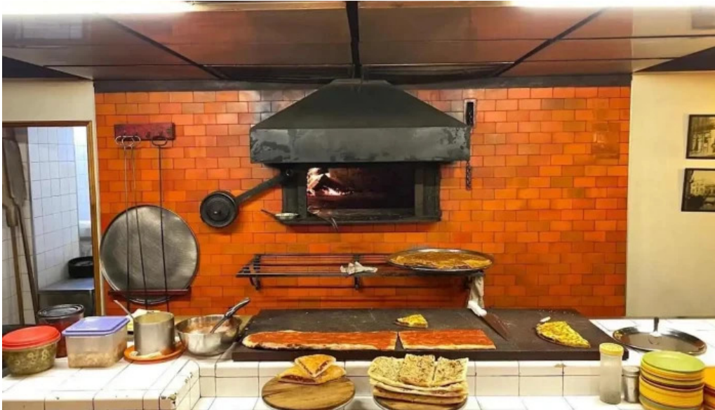
Bar tasende comida y bebida