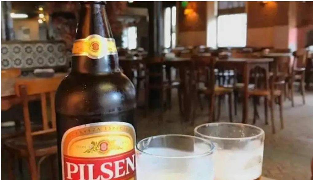
Bar tasende cerveza