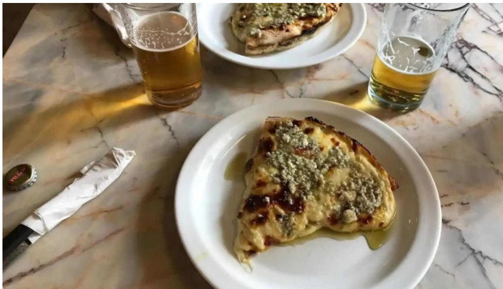
Bar tasende focaccia