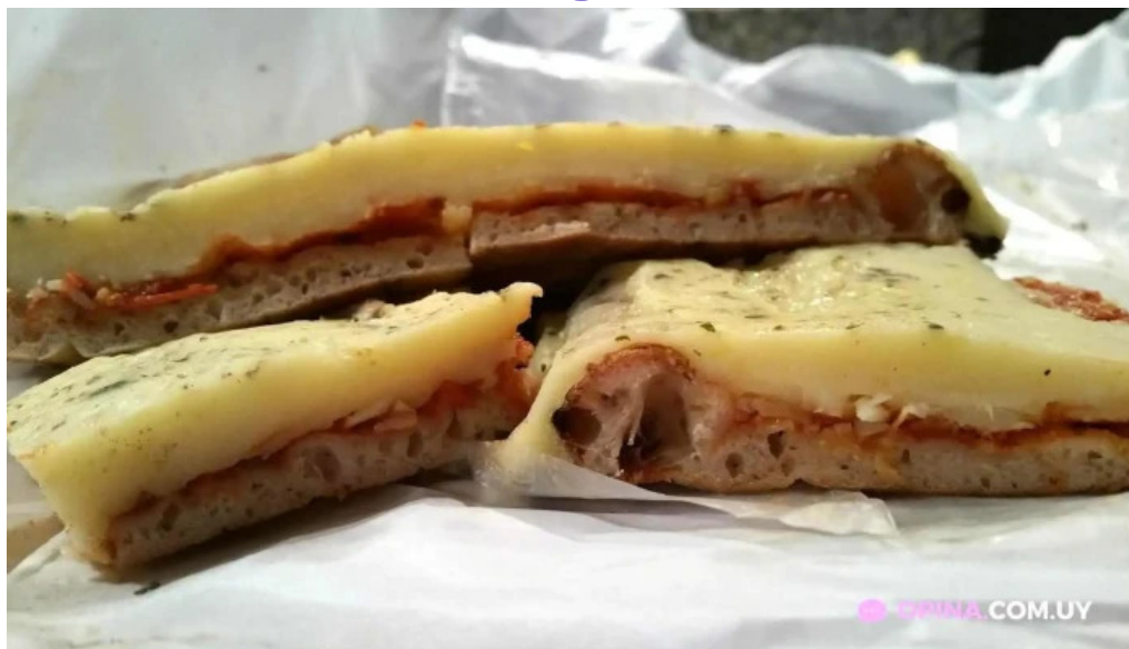
Pizzeria giordano todas