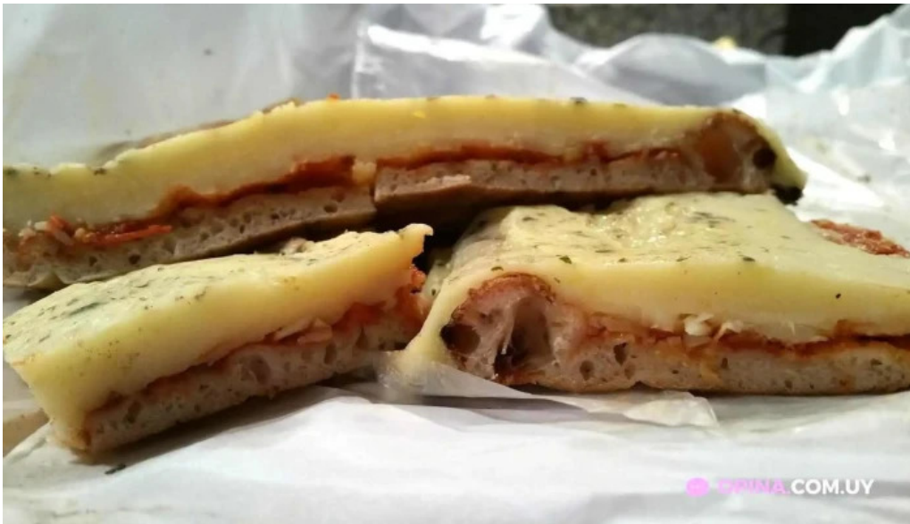
Pizzeria giordano progreso