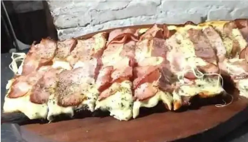
Pizzeria giordano comida y bebida