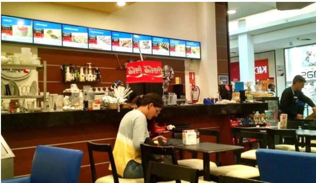
Pasteleria caffe porto vanila todas