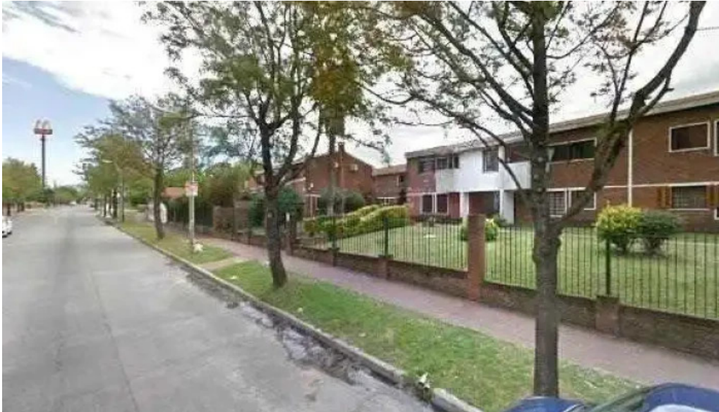
Pasteleria cafe porto vanilla street view y 360