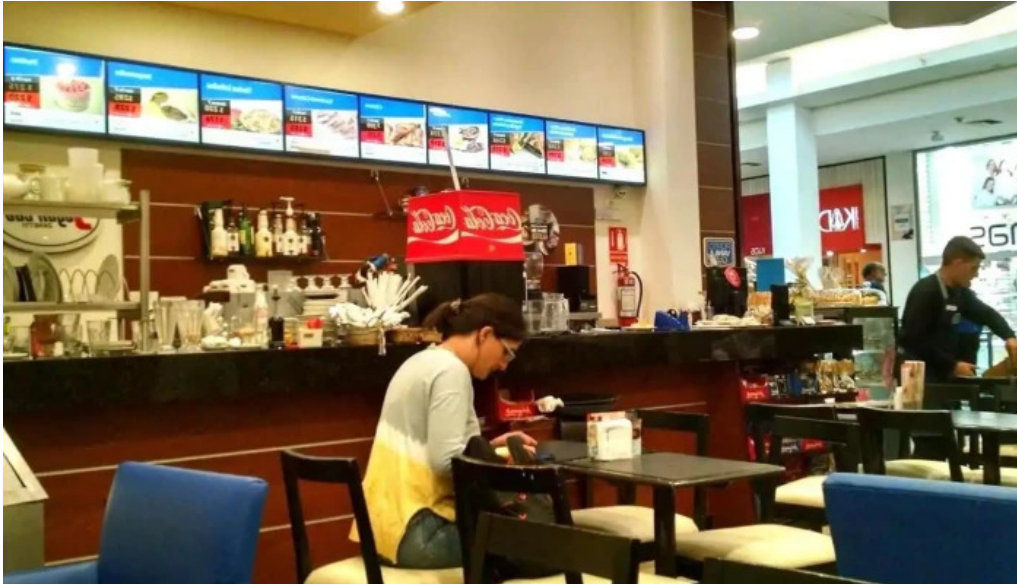
Pasteleria cafe porto vanila ambiente