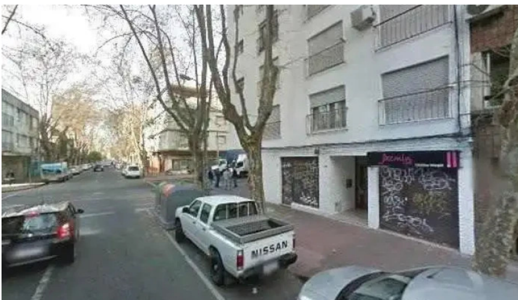
Pacazke street view y 360