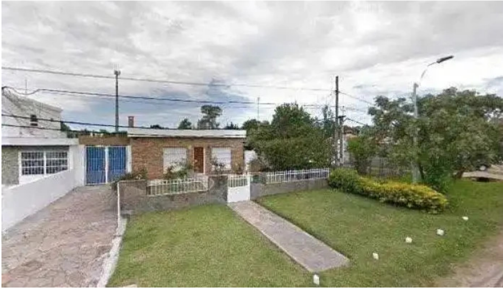
Juli iruleguy take away street view y 360