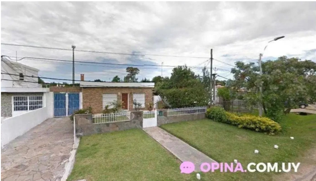
Juli iruleguy take away montevideo