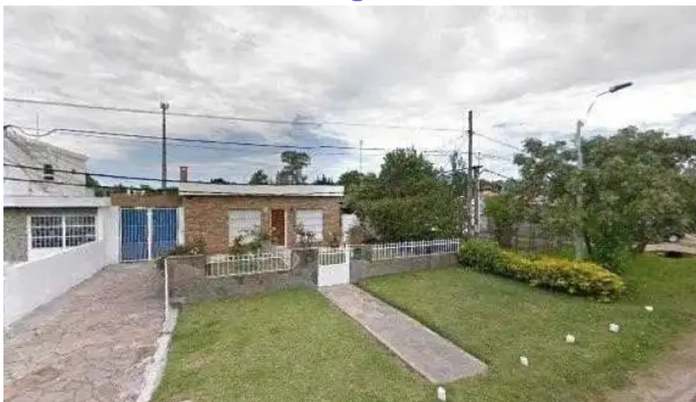
Juli iruleguy take away todas