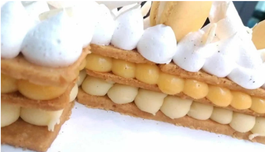
Gout gluten free del propietario