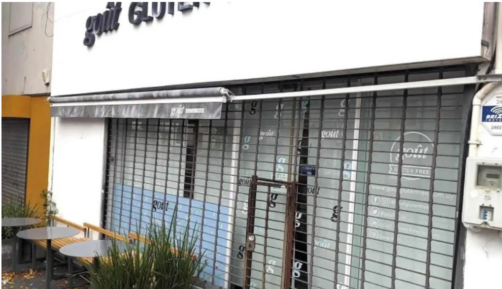
Gout gluten free todo