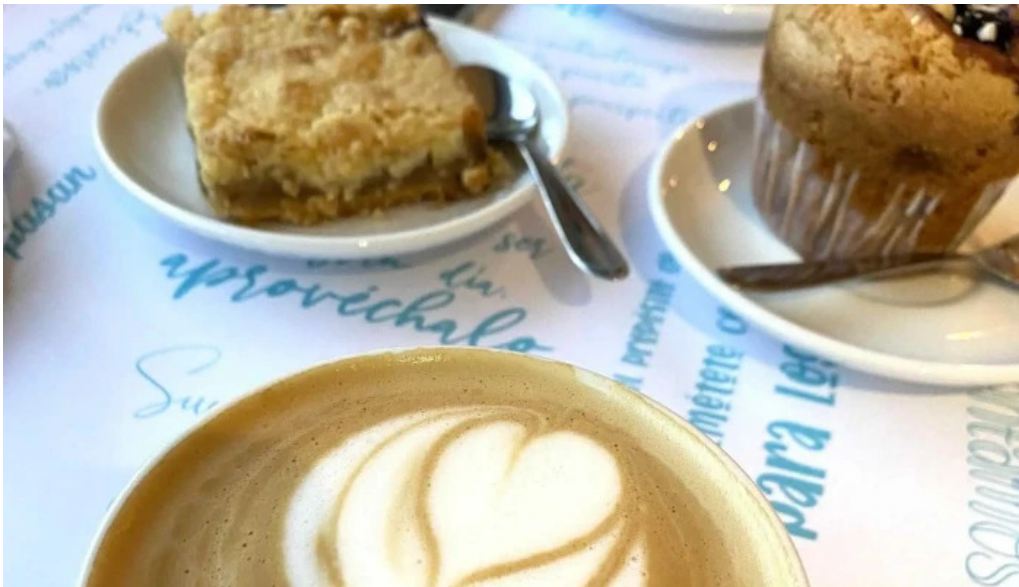
Gout gluten free comentario 6