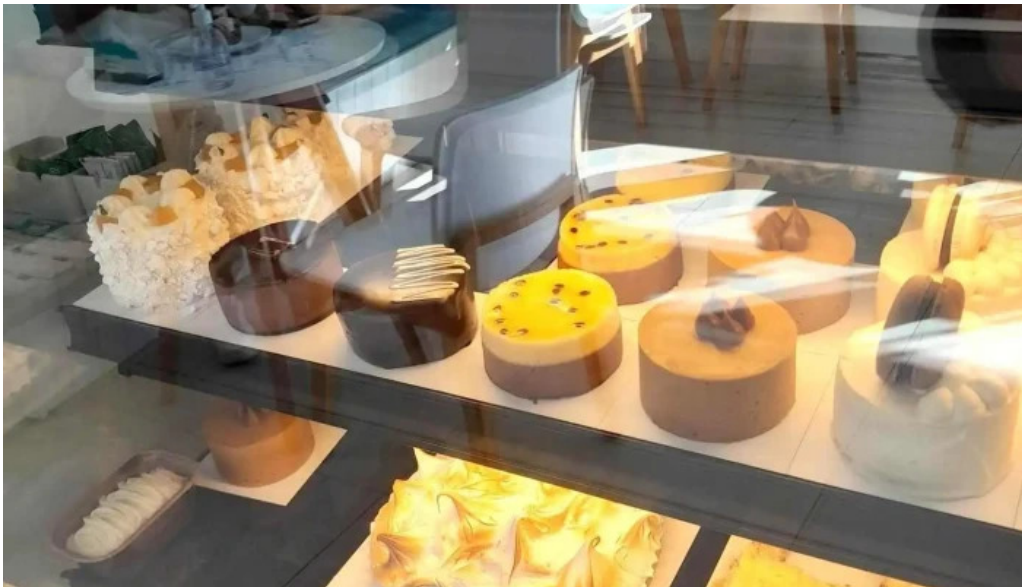
Gout gluten free comidas y bebidas