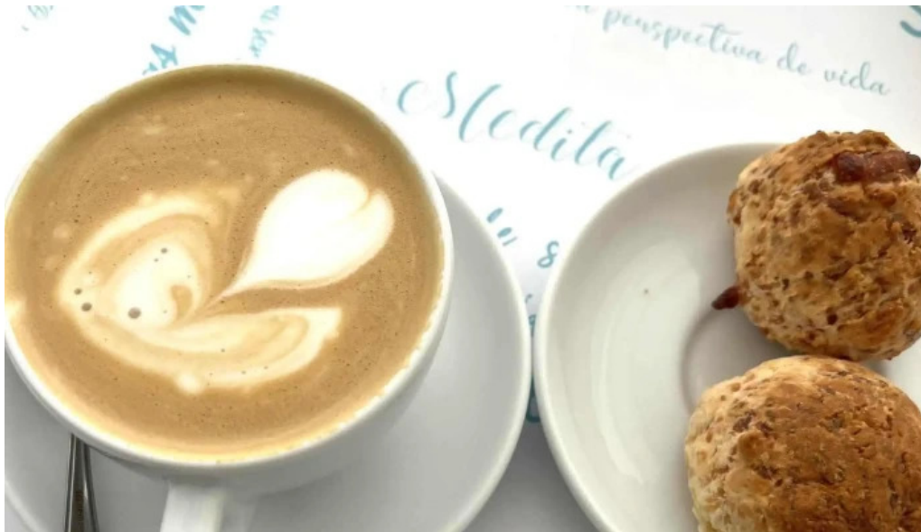
Gout gluten free comentario 4