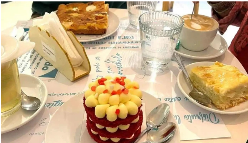
Gout gluten free pastel