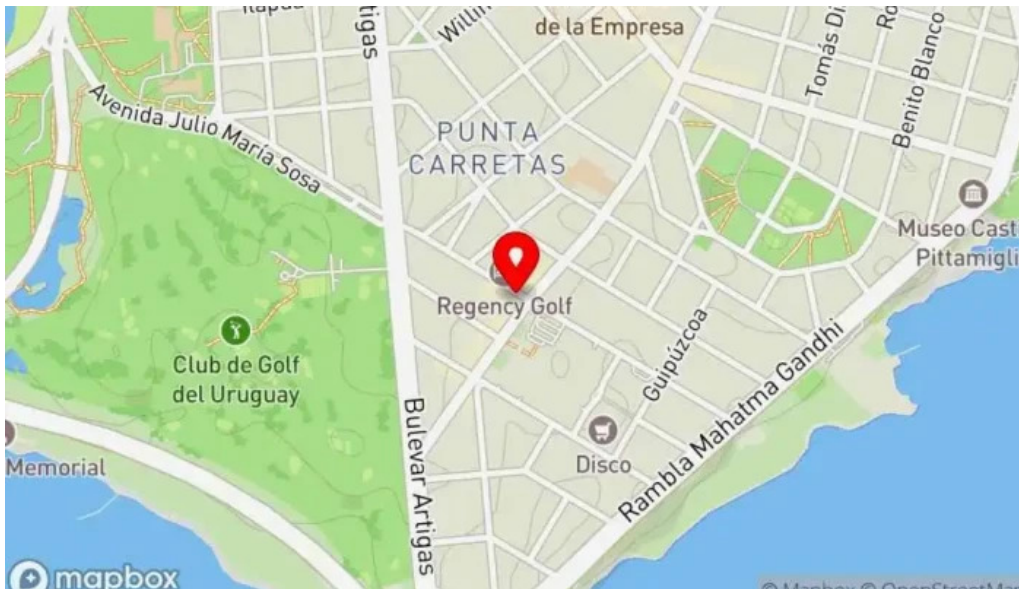
Gout gluten free mapa