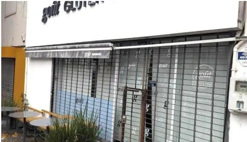
Gout gluten free montevideo