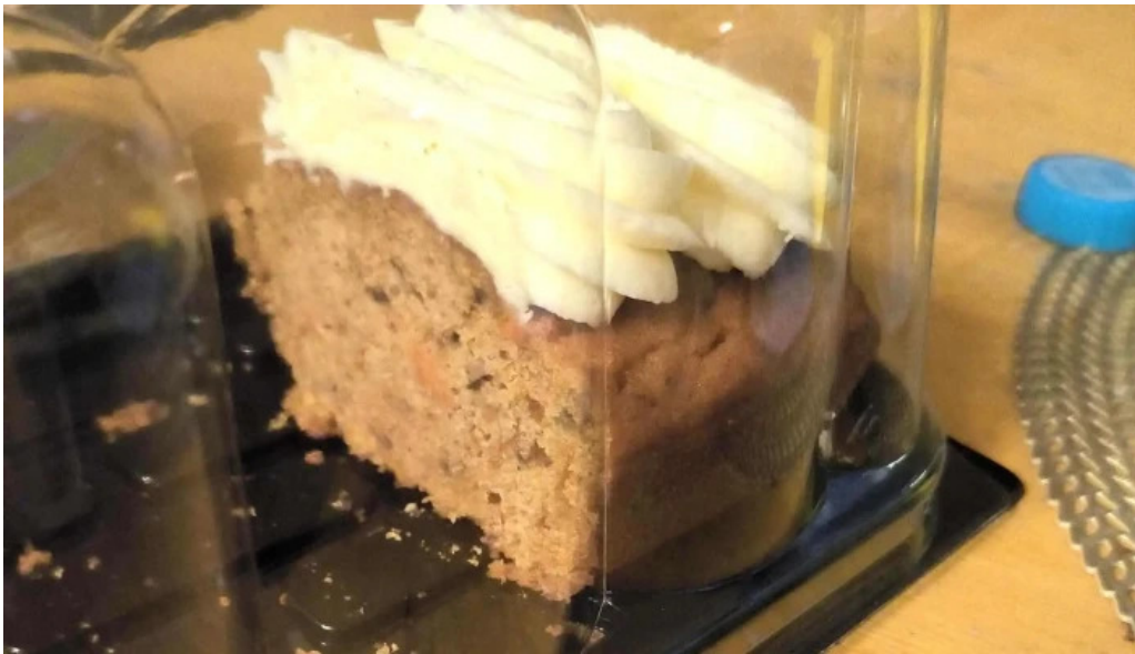
Gout gluten free comentario 1