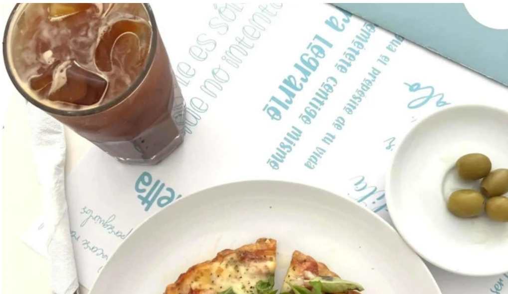
Gout gluten free comentario 5