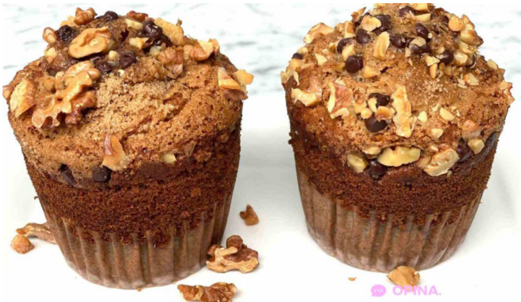
Gout gluten free horneado