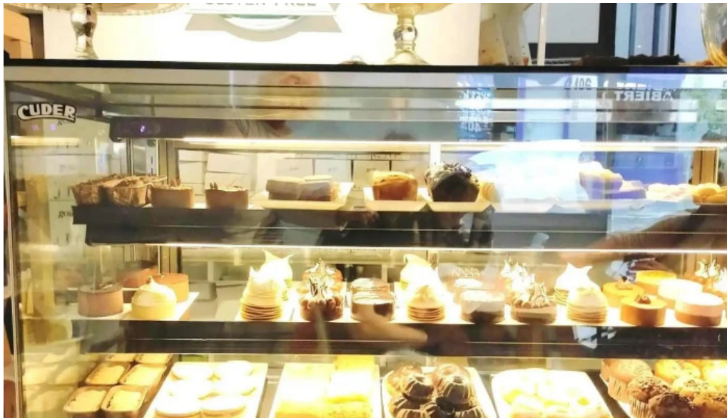
Gout gluten free ambiente