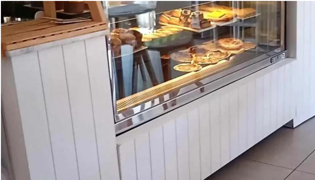
Gout gluten free videos