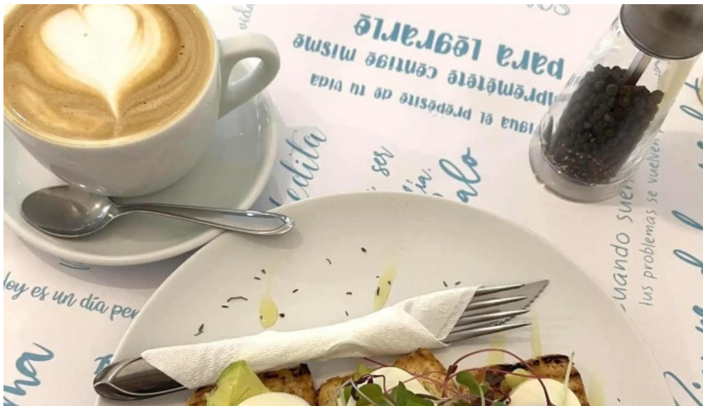
Gout gluten free comentario 3