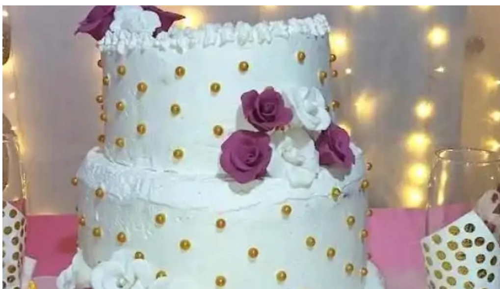
Deleites gazzaneo del propietario