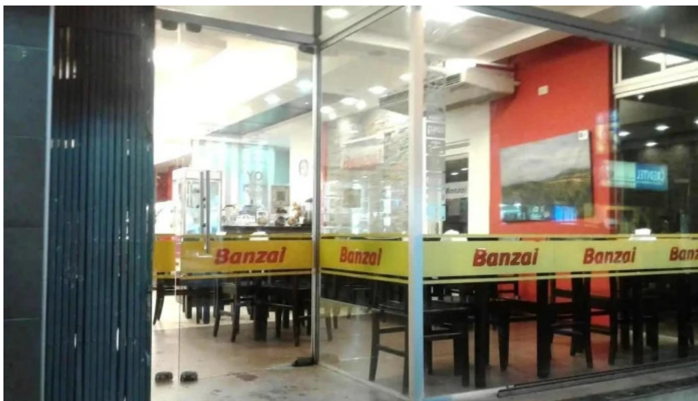
Confitería banzai interior