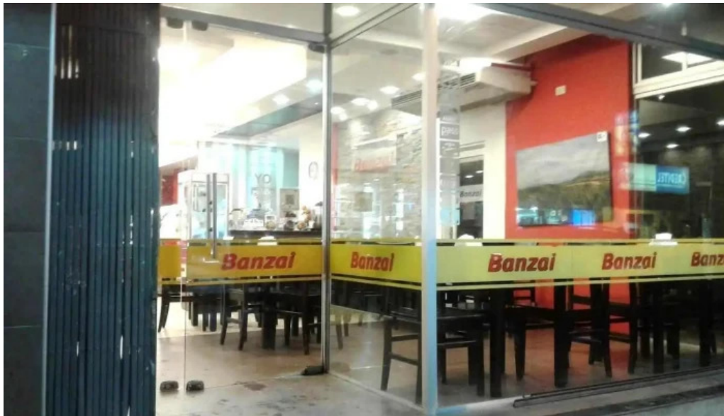
Confiteria banzai pando