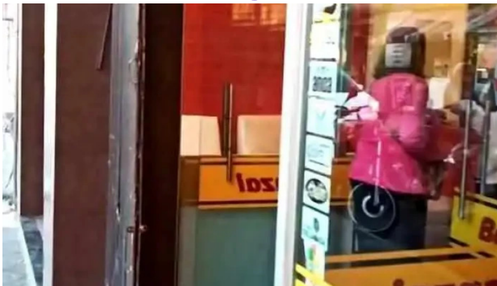
Confiteria banzai videos