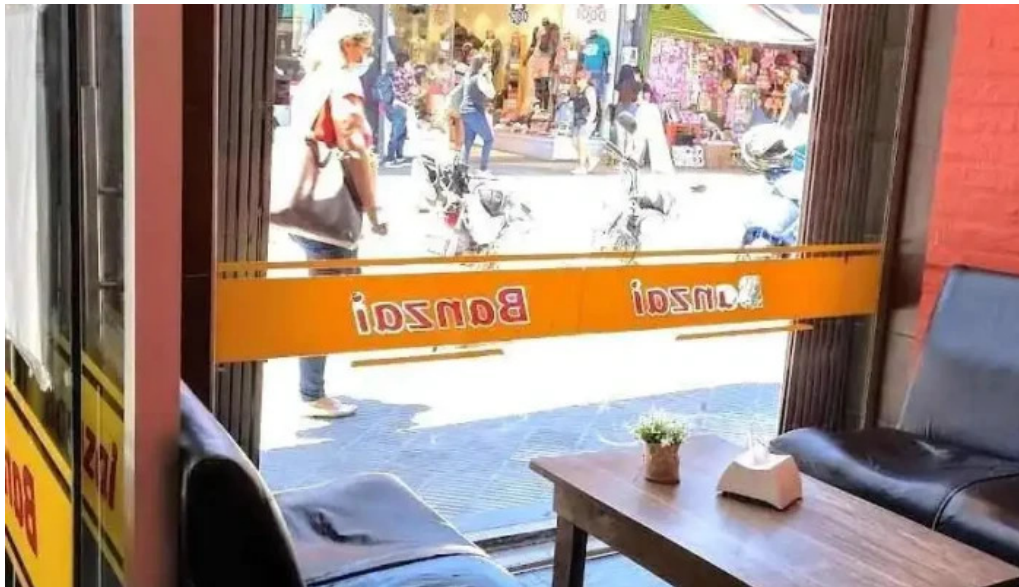
Confiteria banzai todas