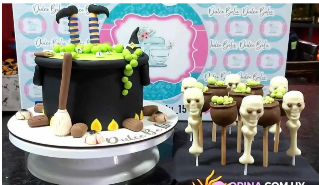
Dulce belu barras blancos