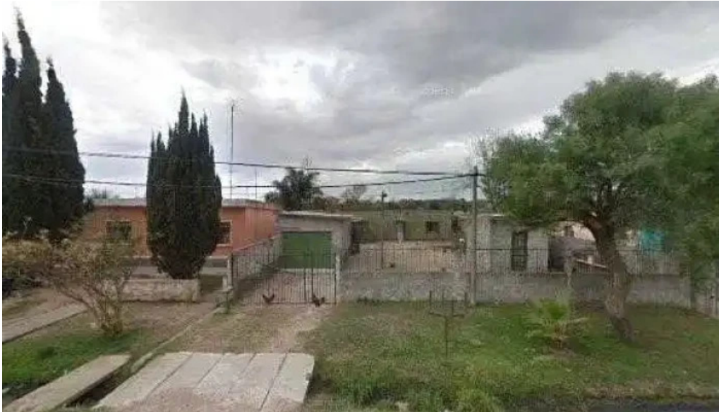
Dulce belu street view y 360