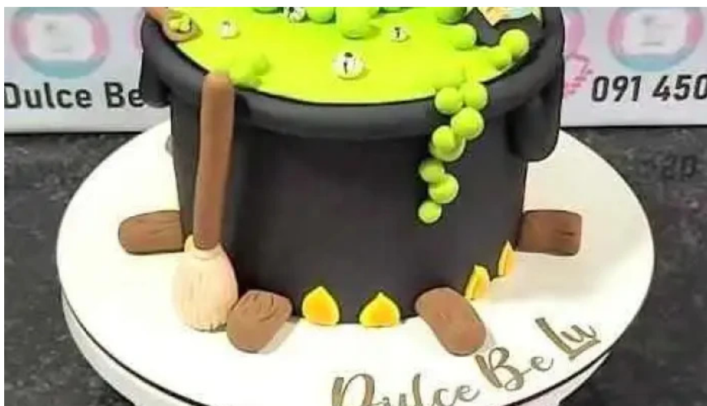
Dulce belu comida y bebida