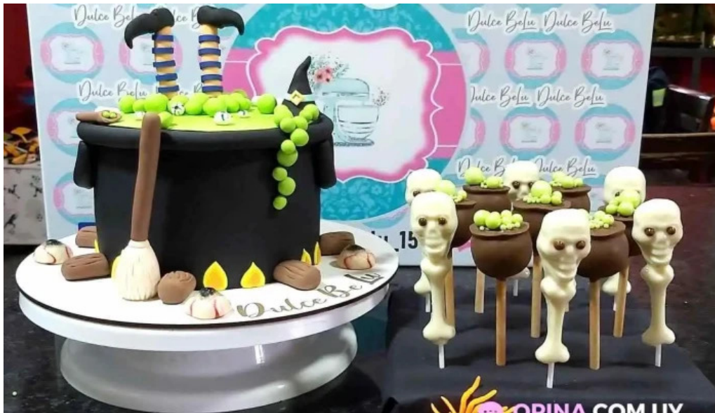
Dulce belu todas