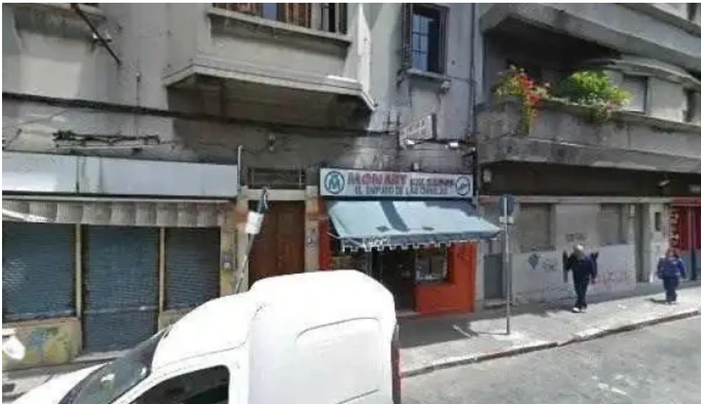
Agualada street view y 360