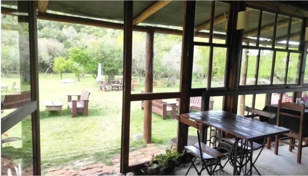
La ultima portera todas