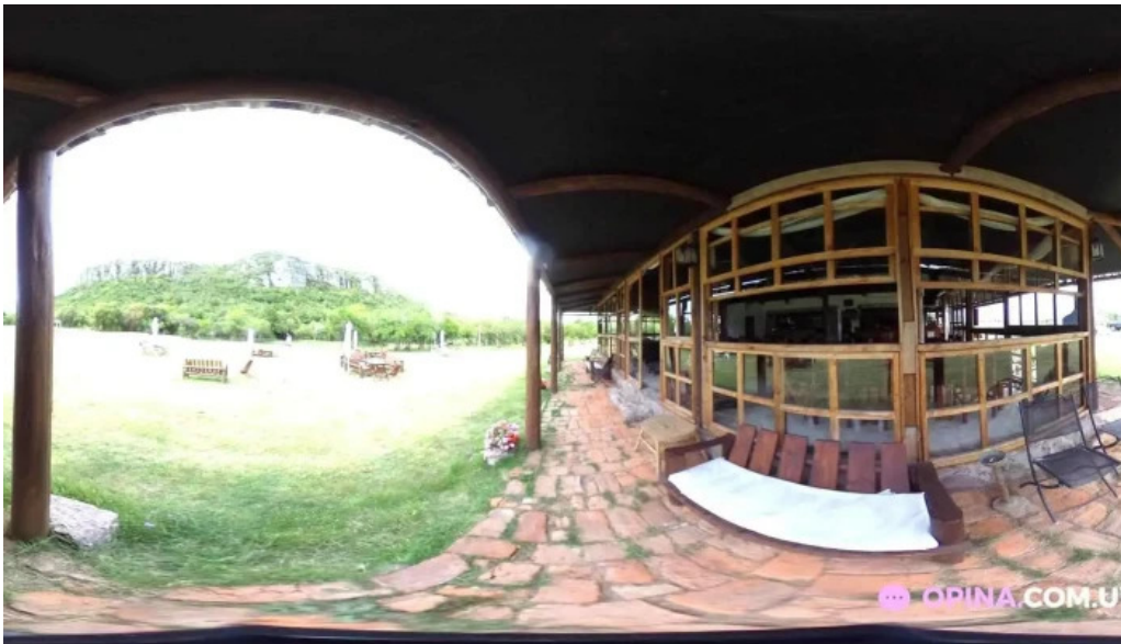
La ultima portera street view y 360