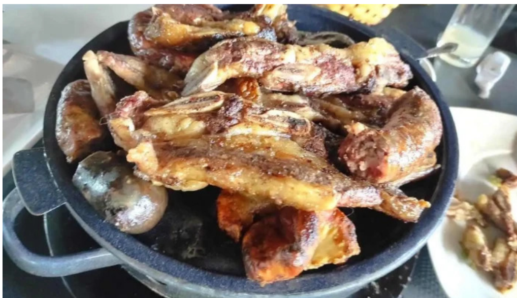
La ultima portera comida y bebida