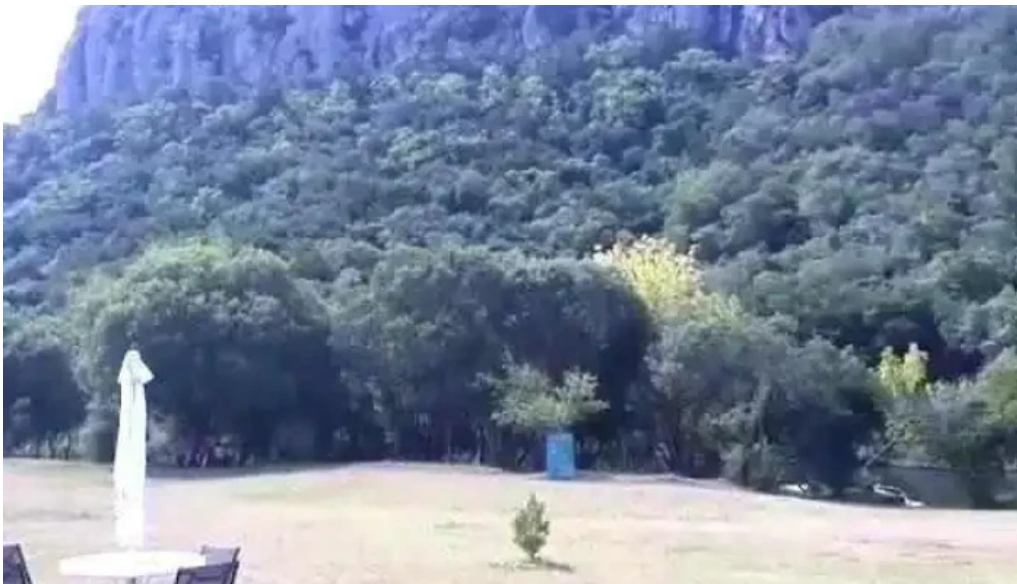
La ultima portera videos