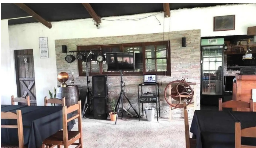
La ultima portera ambiente