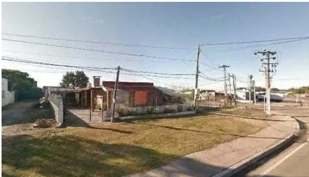
El repecho pizza y parrilla street view y 360