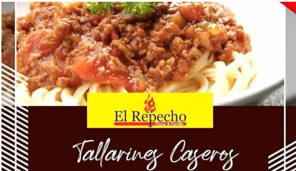
El repecho pizza y parrilla del propietario