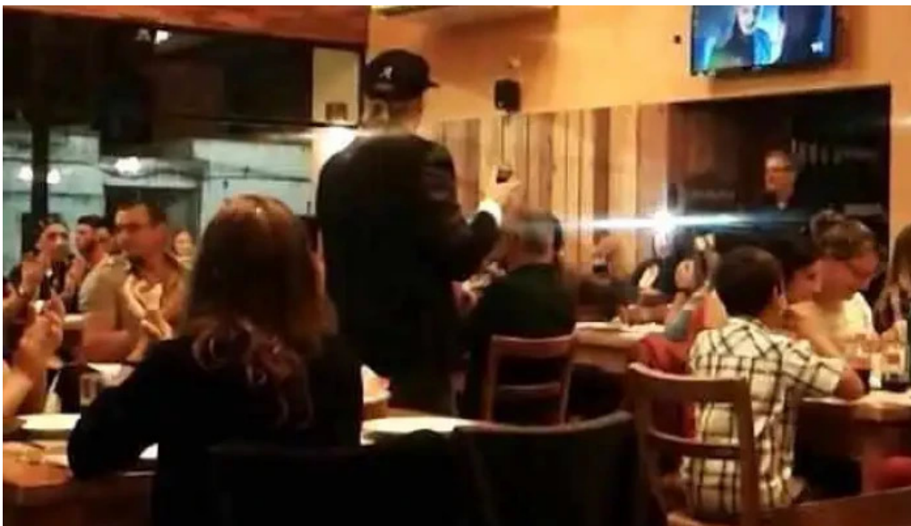
El repecho pizza y parrilla videos