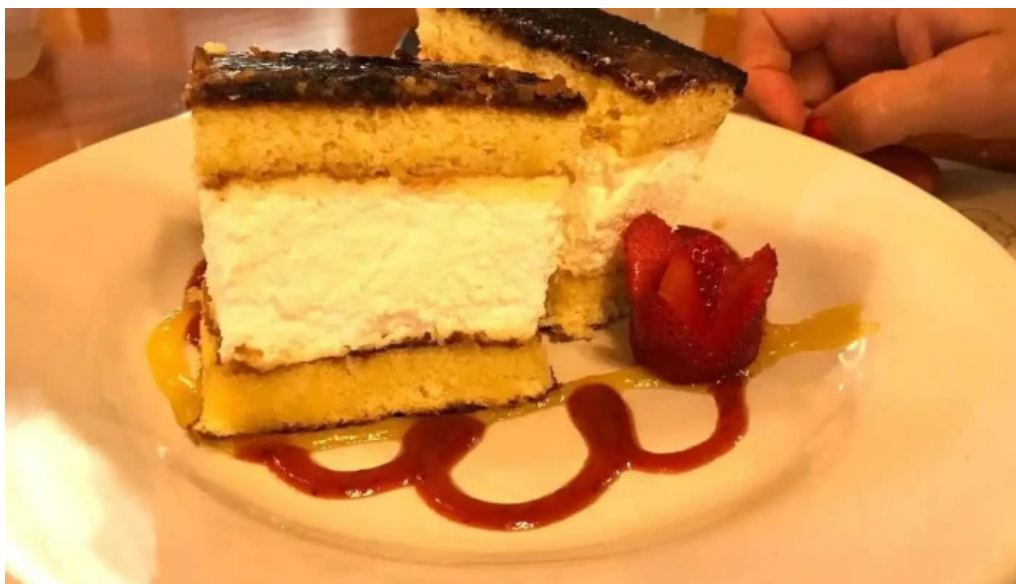
El repecho pizza y parrilla comida y bebida