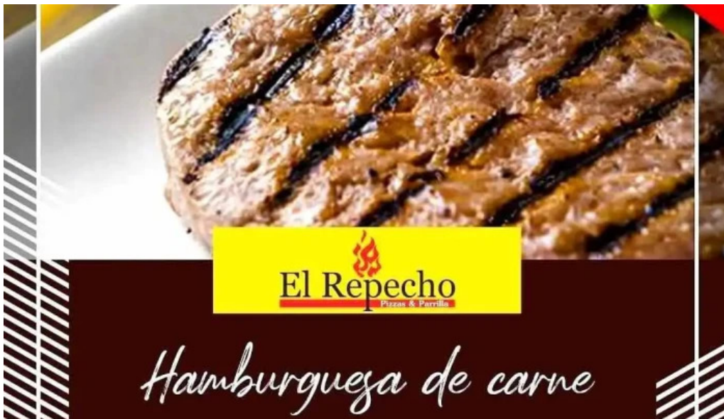
El repecho pizza y parrilla menu