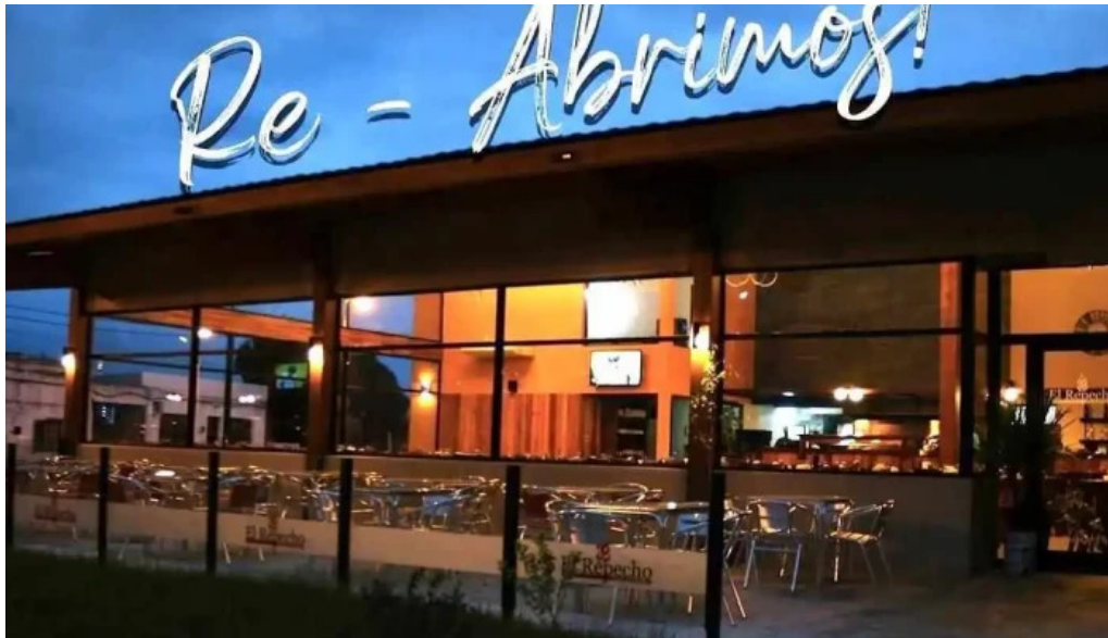
El repecho pizza y parrilla san jose de mayo