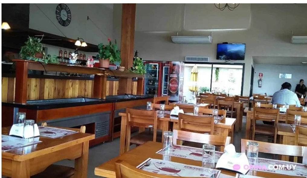
El repecho pizza y parrilla ambiente