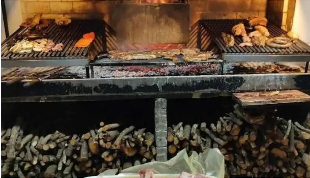
Lo de beto comida y bebida