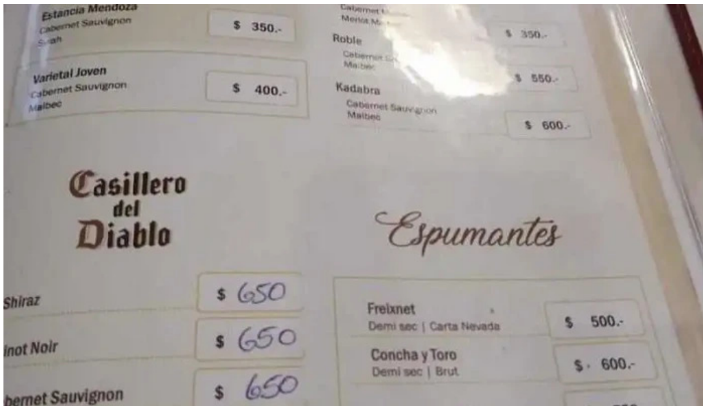
Lo de beto menu