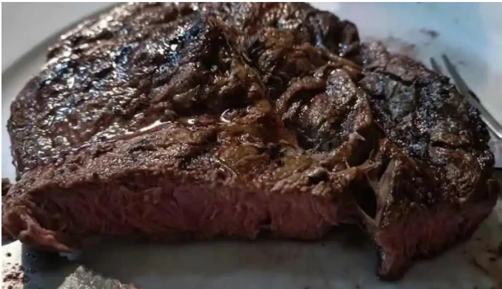
Lo de beto filete