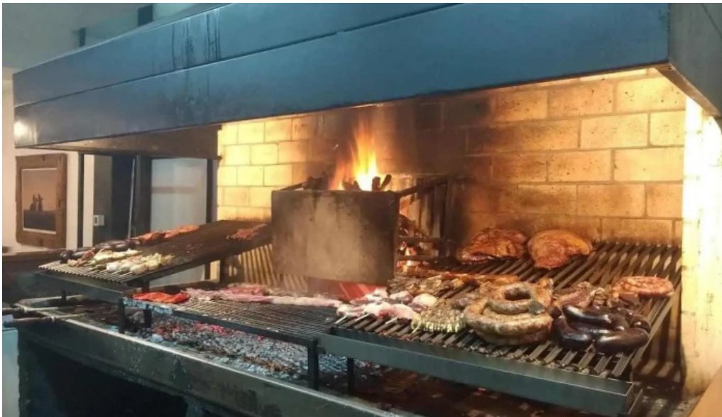
Lo de beto ambiente