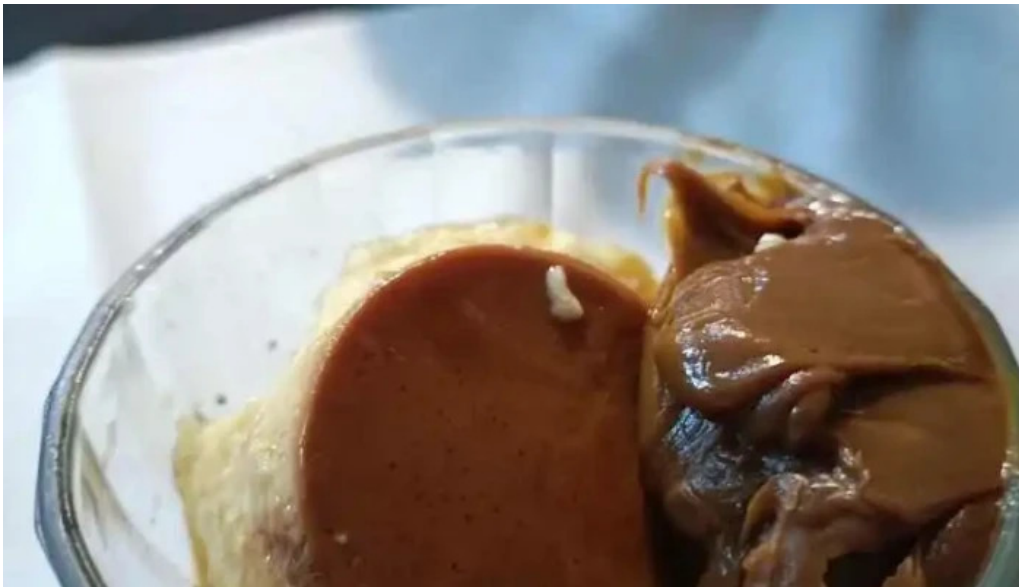
Lo de beto dulce de leche