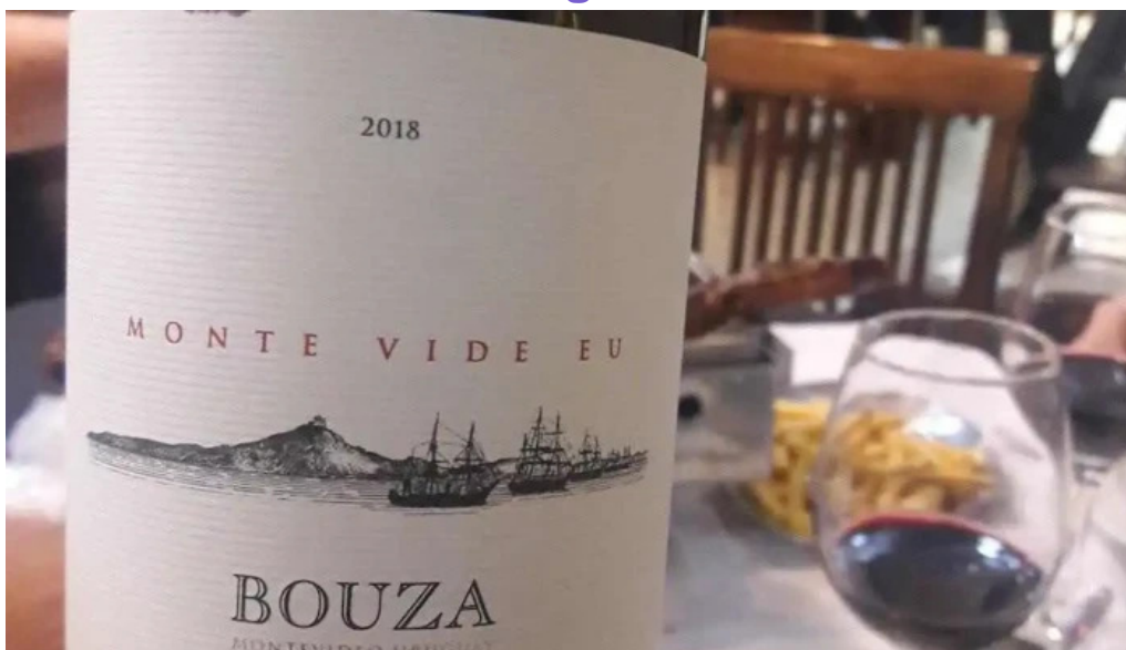
Lo de beto vino