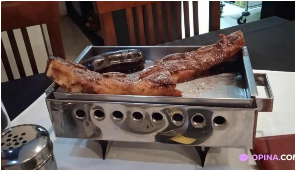
Lo de beto churrasco