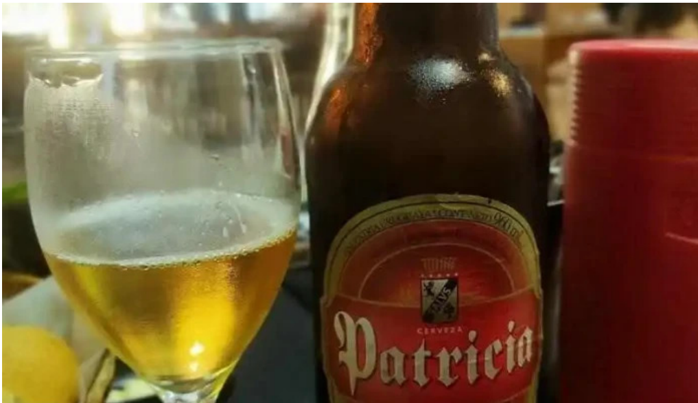
Lo de beto cerveza