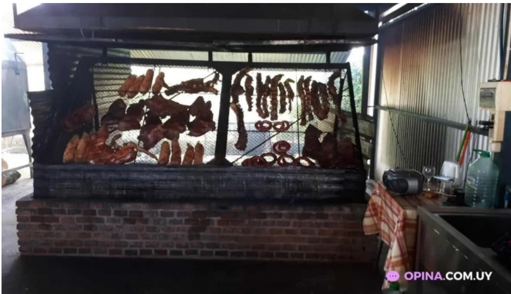
Parrilla el paton todas