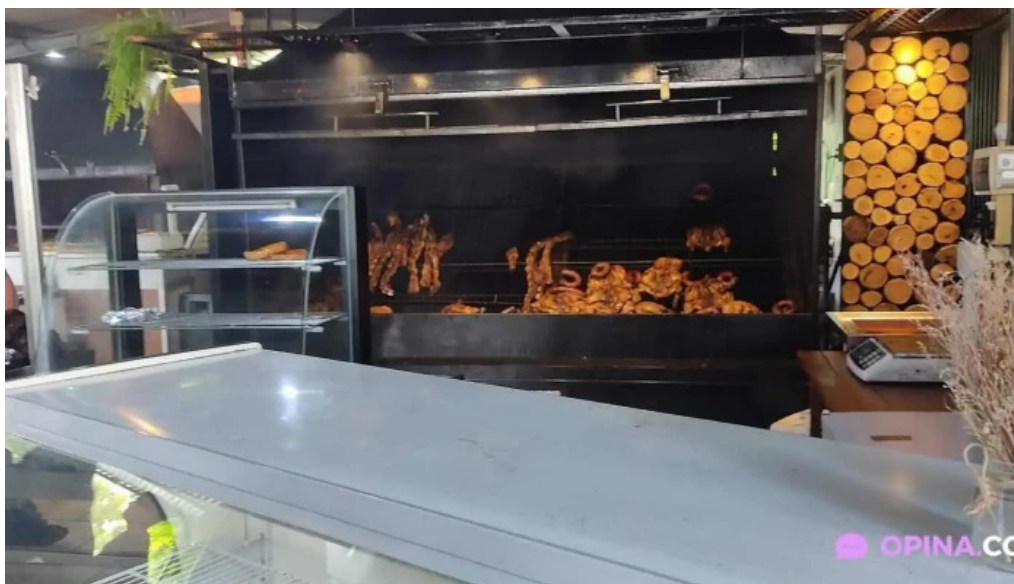
Parrilla el paton ambiente