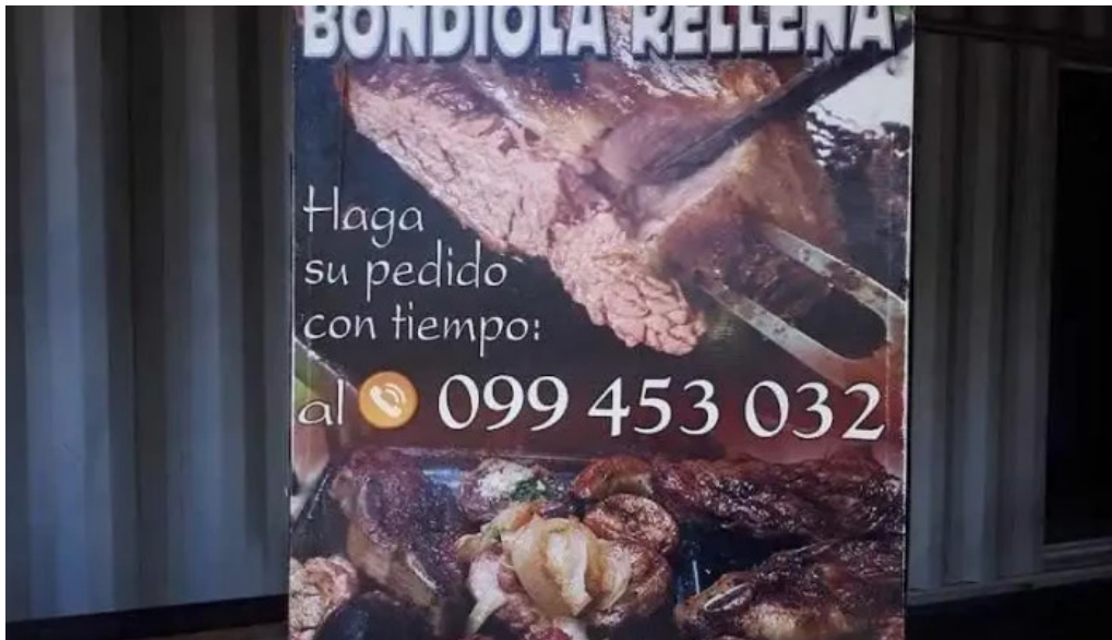
Parrilla el paton menu