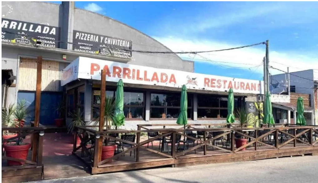
Las brasas parrillada y pizzeria pan de azucar