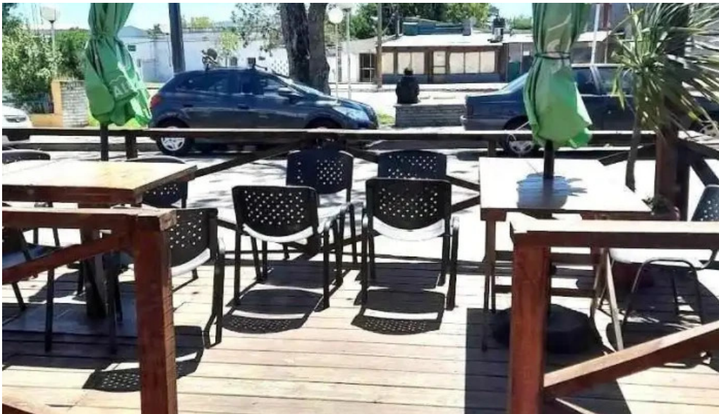
Las brasas parrillada y pizzeria ambiente