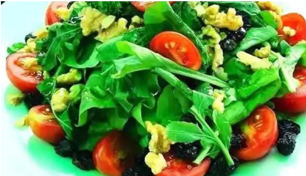
Las brasas parrillada y pizzeria comida y bebida