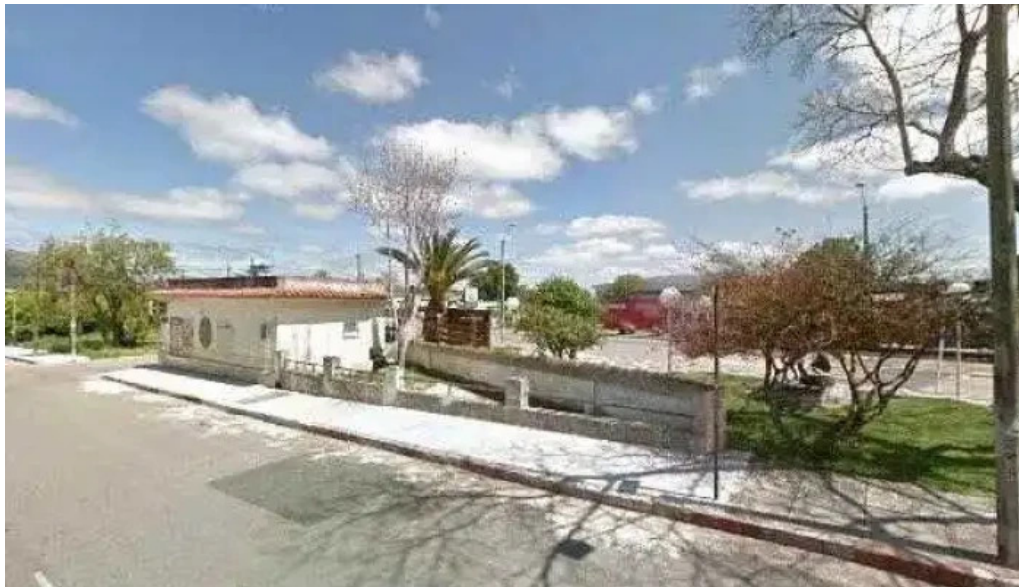
Las brasas parrillada y pizzeria street view y 360