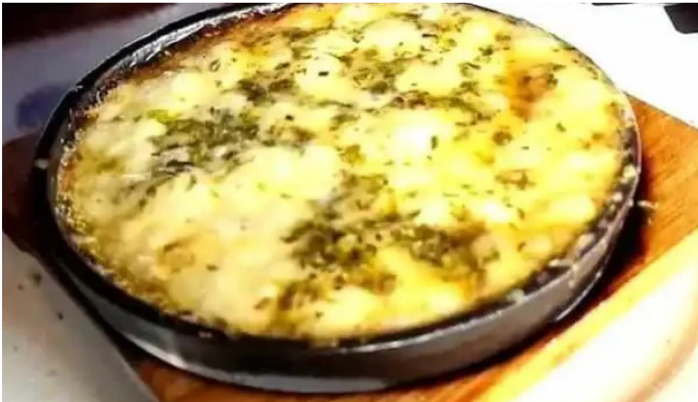
Las brasas parrillada y pizzeria videos