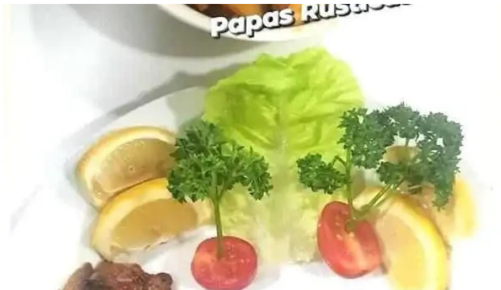
Las brasas parrillada y pizzeria del propietario