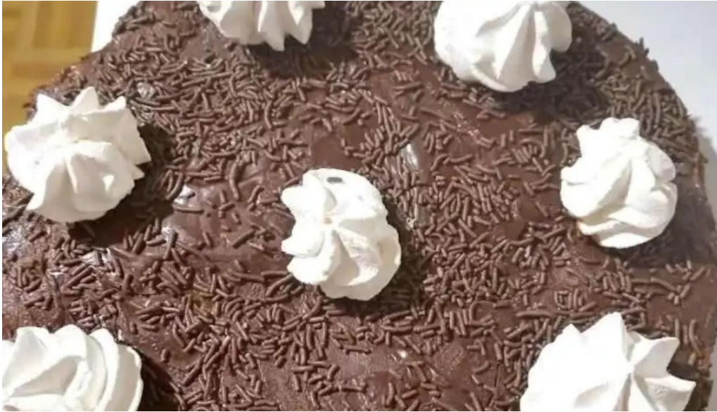
Comidas y almacen el tito pan de azucar