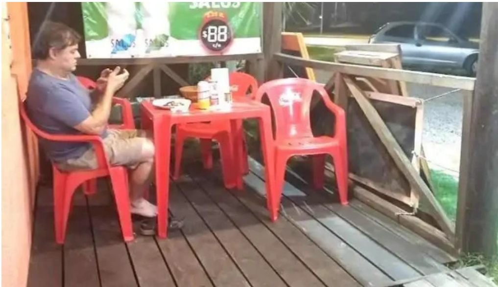
Comidas y almacén el tito ambiente