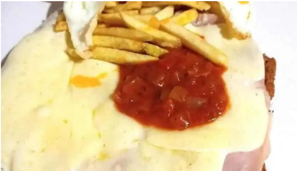
Comidas y almacén el tito comida y bebida