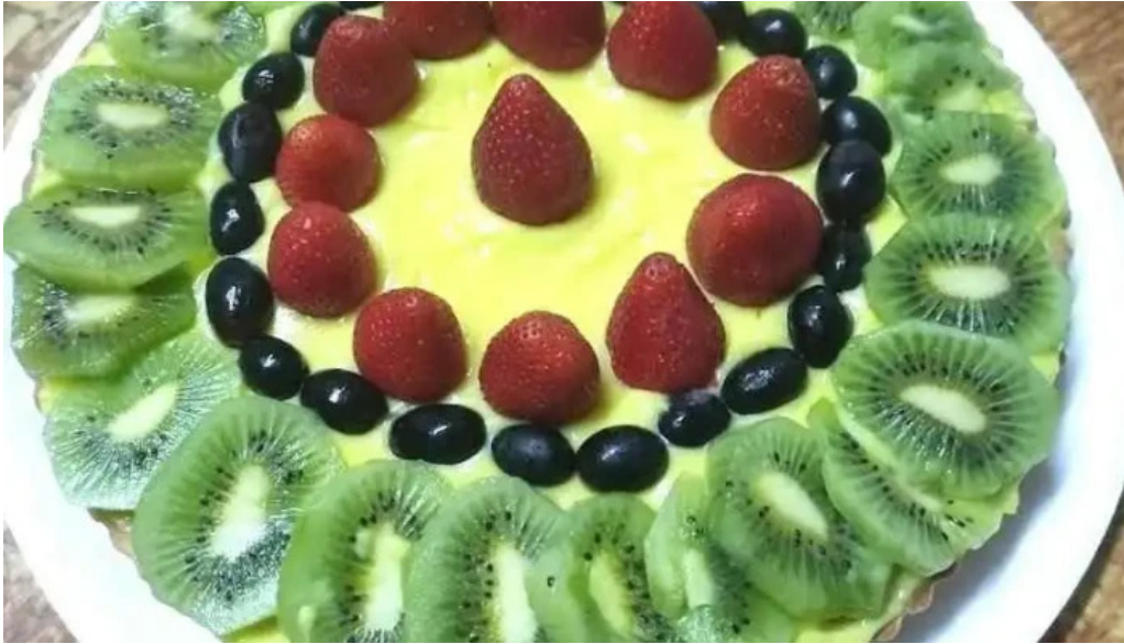
Comidas y almacén el tito del propietario