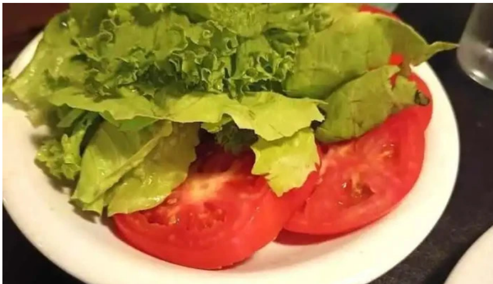
Tintos y rubias mas recientes