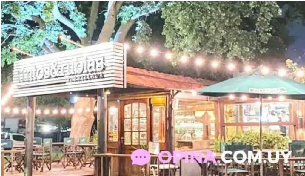
Tintos y rubias monteideo