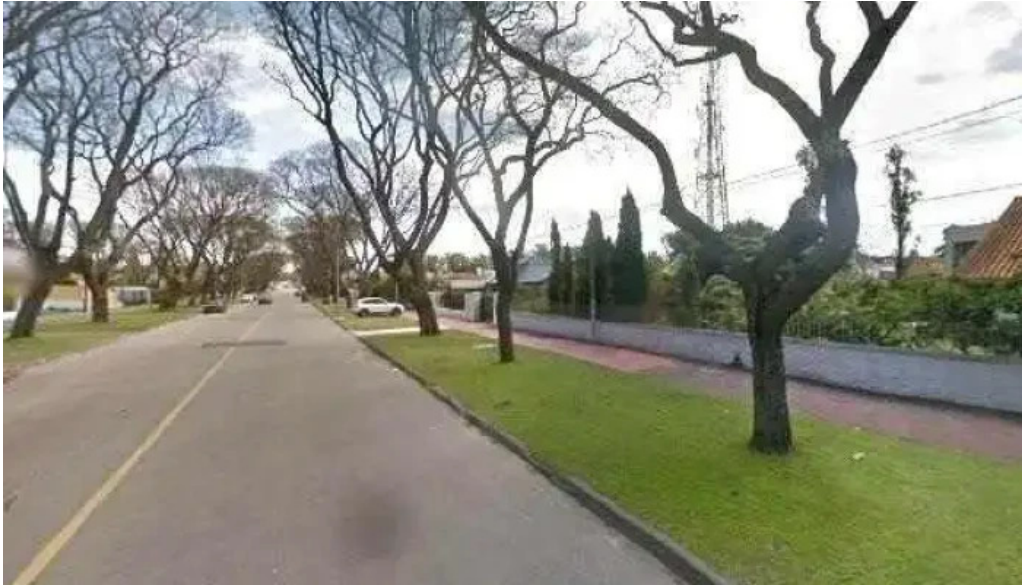
Tintos y rubias street view y 360