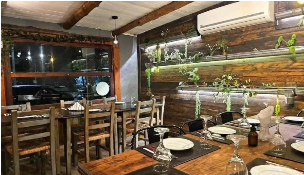
Tintos y rubias ambiente