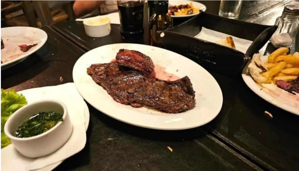
Tintos y rubias comida y bebida