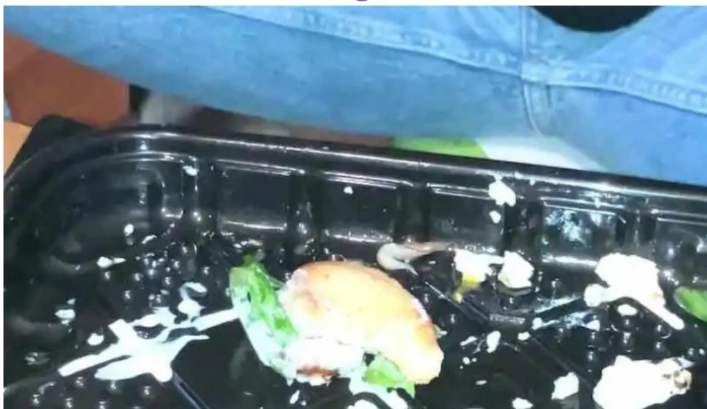
Tintos y rubias videos