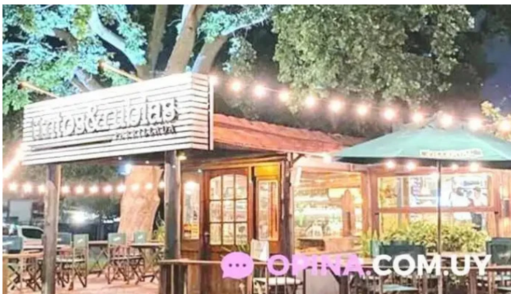
Tintos y rubias todas