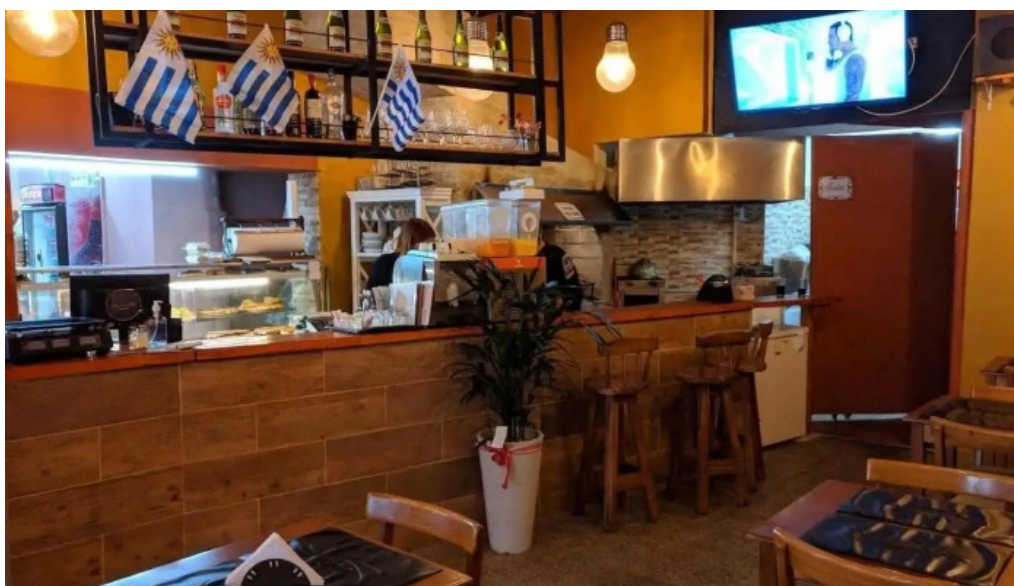
Radichetta parrilla buffet cafe ambiente