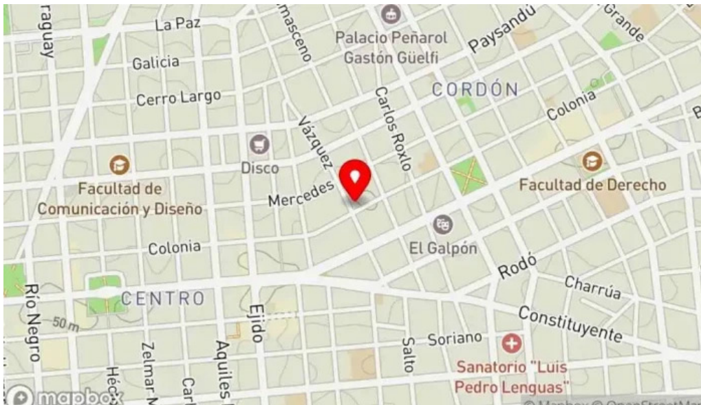
Radichetta parrilla buffet cafe mapa