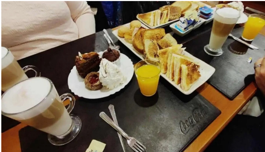
Radichetta parrilla buffet cafe mas recientes