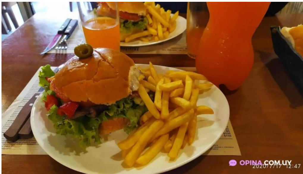
Radichetta parrilla buffet cafe comida y bebida