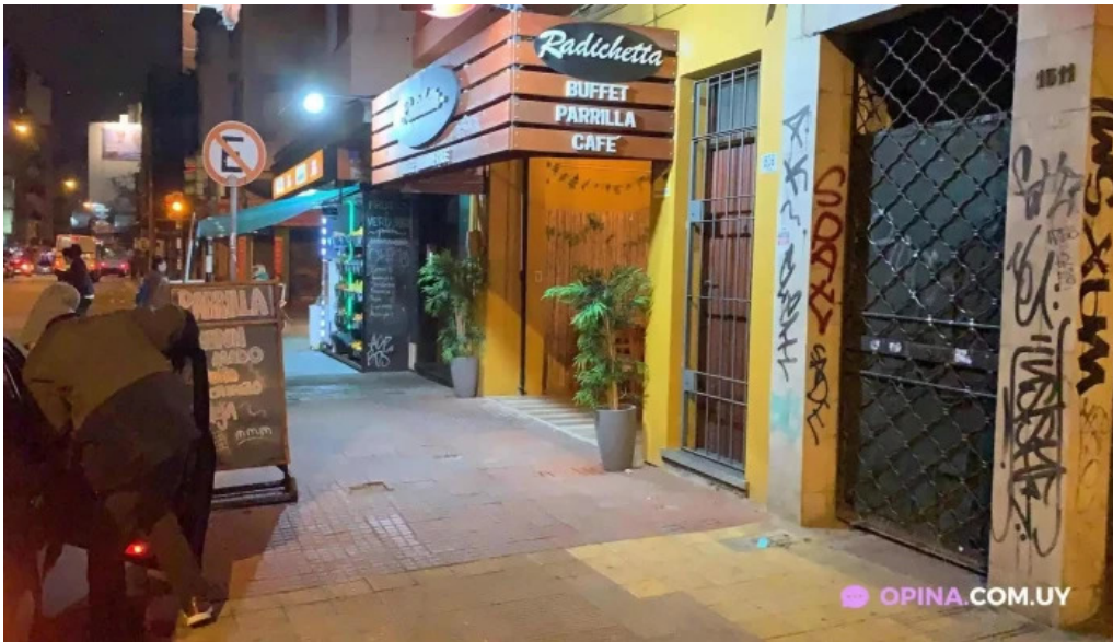
Radichetta parrilla buffet cafe todas