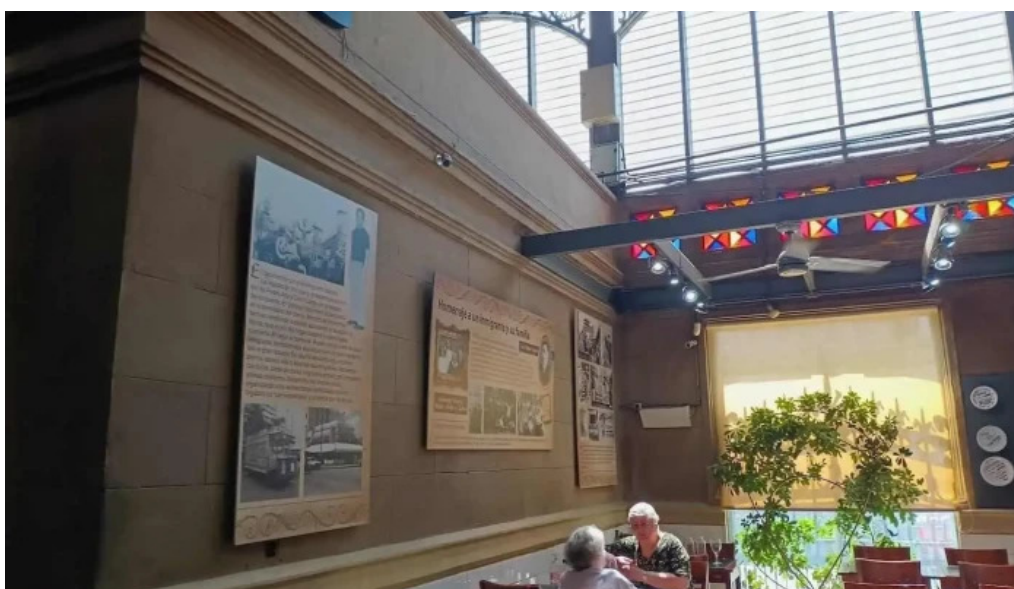
Pellicer parrilla gourmet ambiente