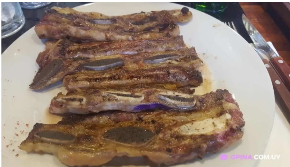
Pellicer parrilla gourmet churrasco