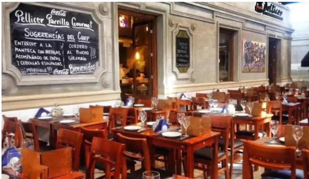
Pellicer parrilla gourmet todas