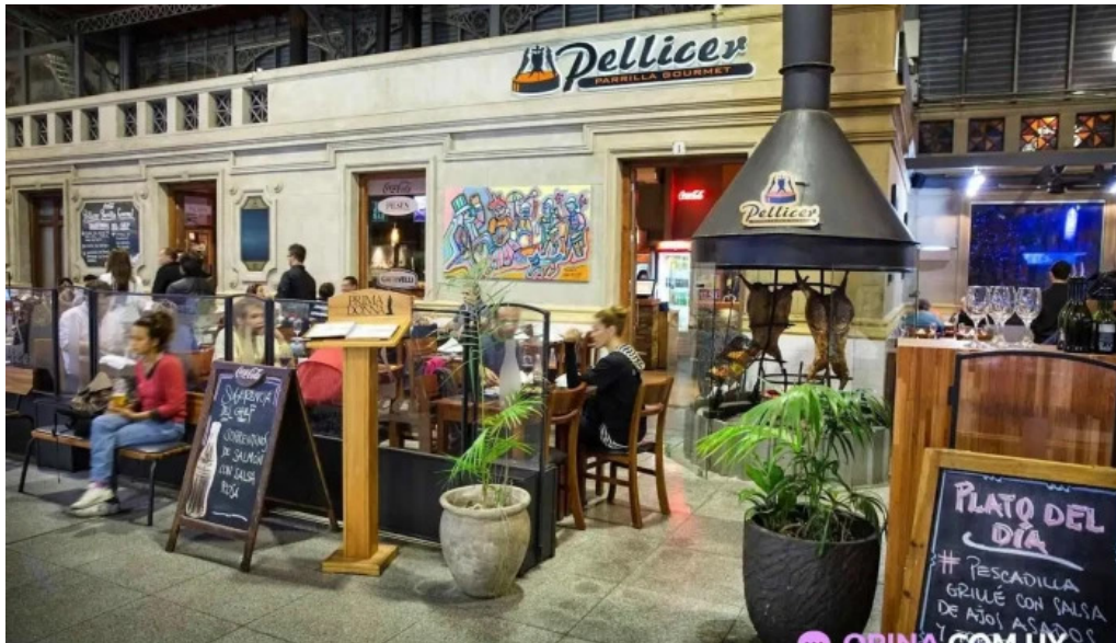
Pellicer parrilla gourmet del propietario