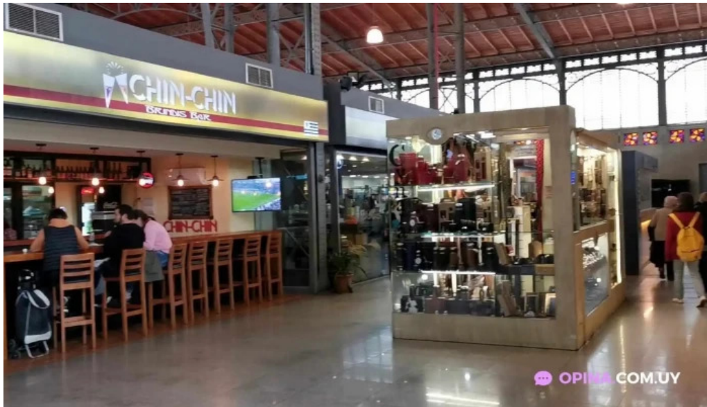
Pellicer parrilla gourmet videos