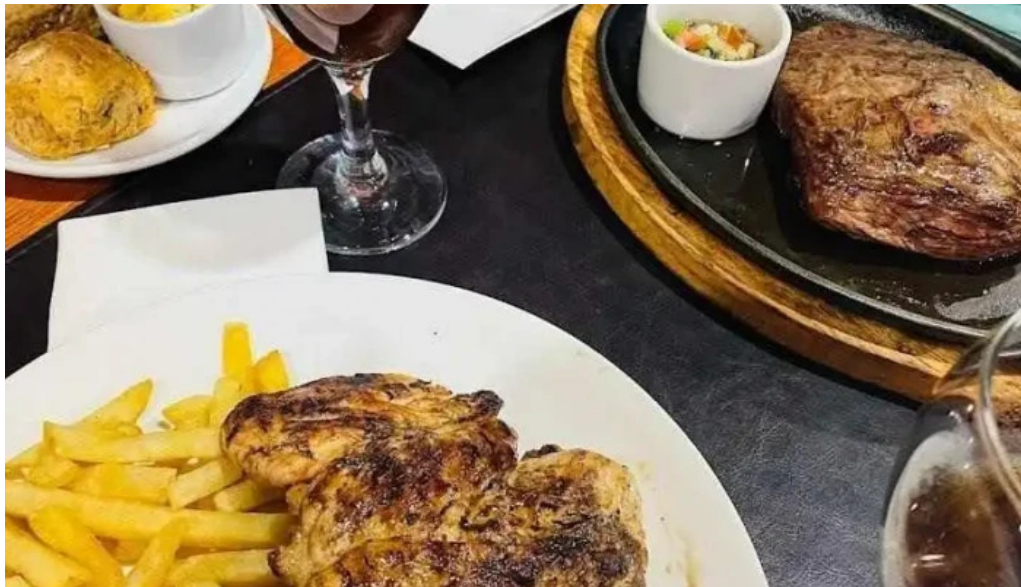
Pellicer parrilla gourmet solomillo