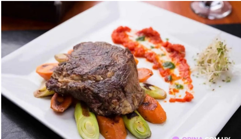
Pellicer parrilla gourmet comida y bebida