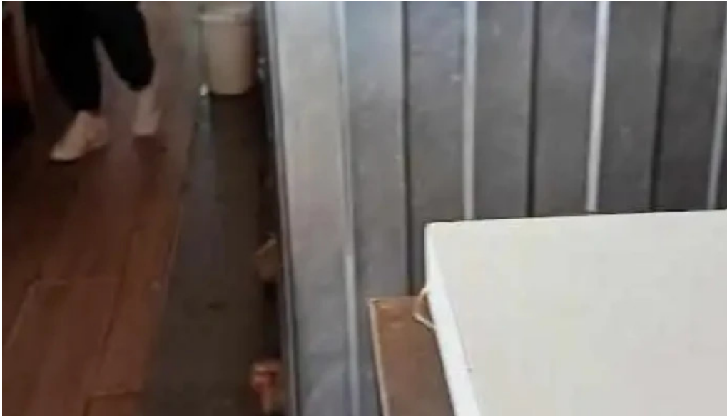
Parrillada el viejo telurio mas recientes