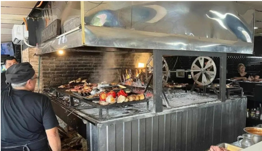
Parrillada el viejo telurio montevideo