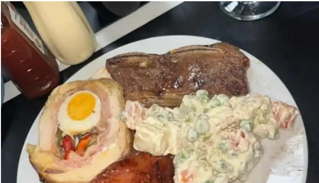
Parrillada el viejo telurio churrasco