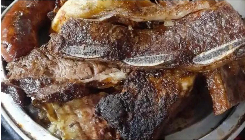
Parrillada el viejo telurio comida y bebida