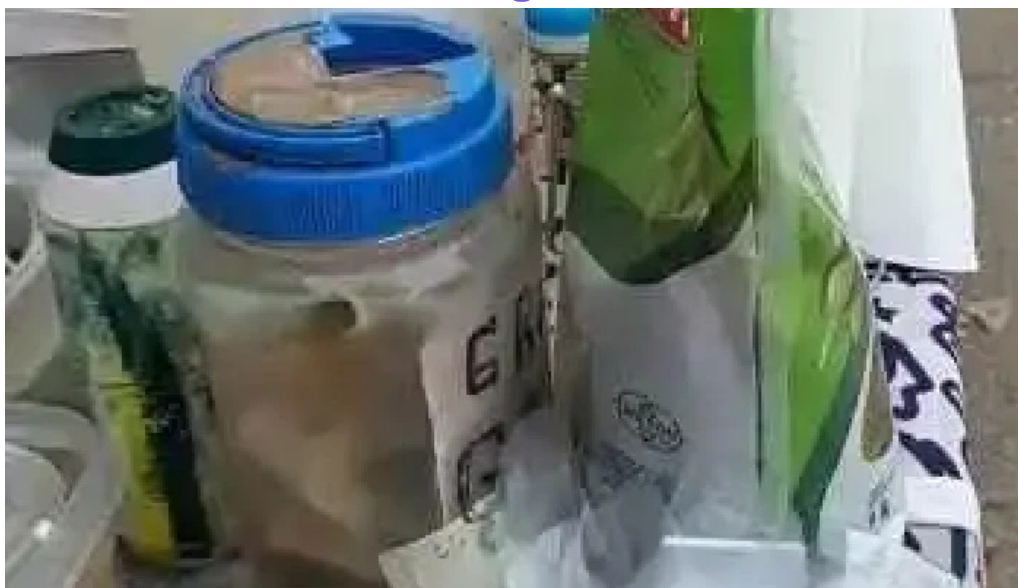
Parrilla el quebracho videos