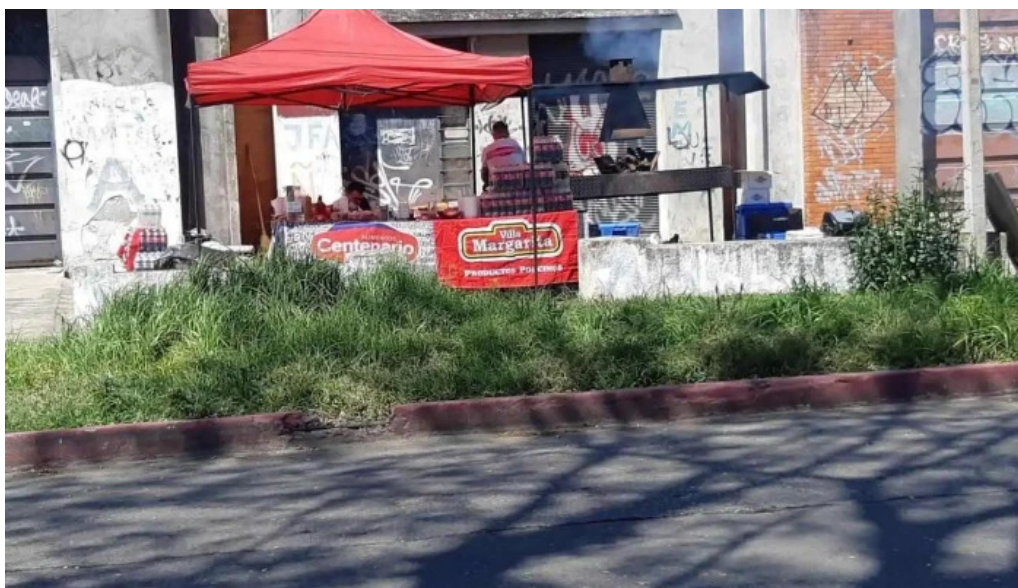
Parrilla el quebracho todas