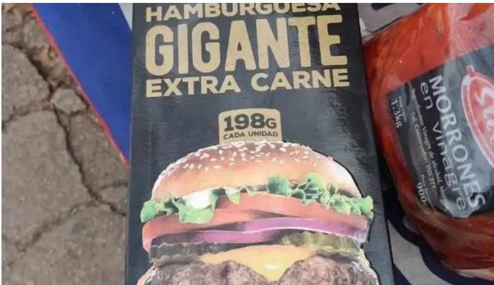
Parrilla el quebracho menu