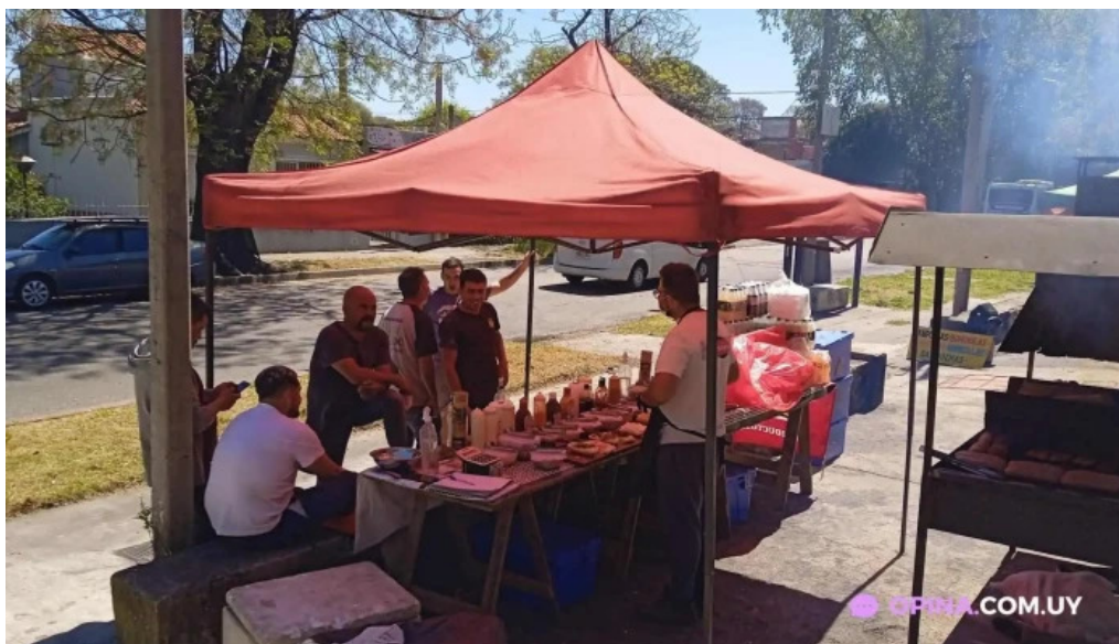
Parrilla el quebracho ambiente