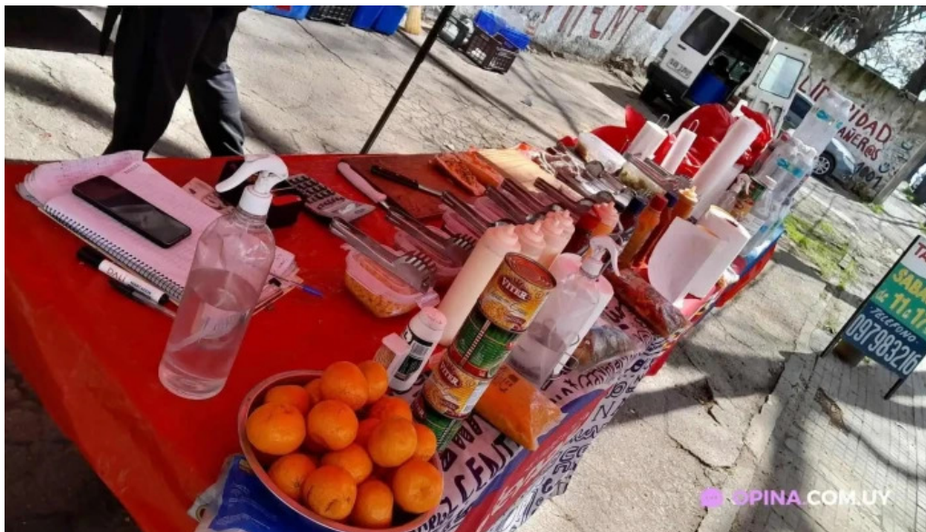
Parrilla el quebracho comida y bebida