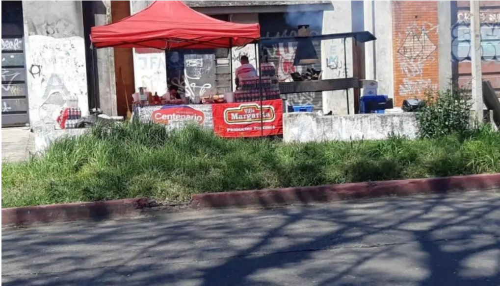
Parrilla el quebracho montevideo