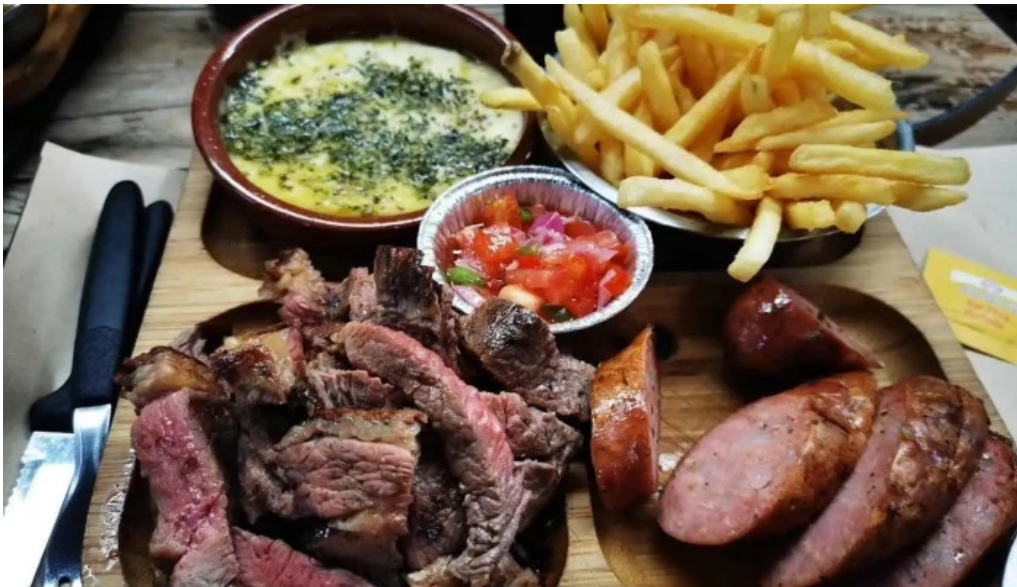
Lpm la parrilla del mercado comida y bebida