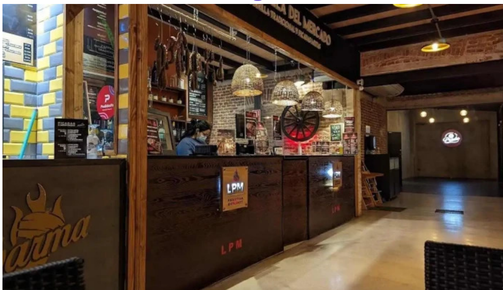
Lpm la parrilla del mercado todas