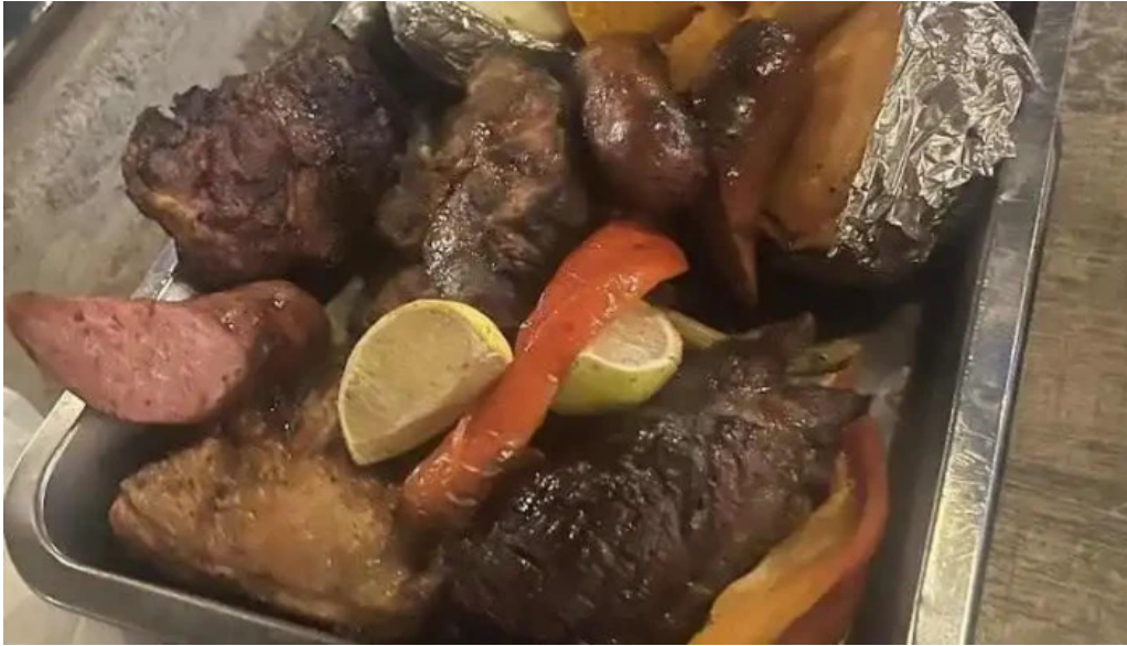
Lpm la parrilla del mercado mas recientes