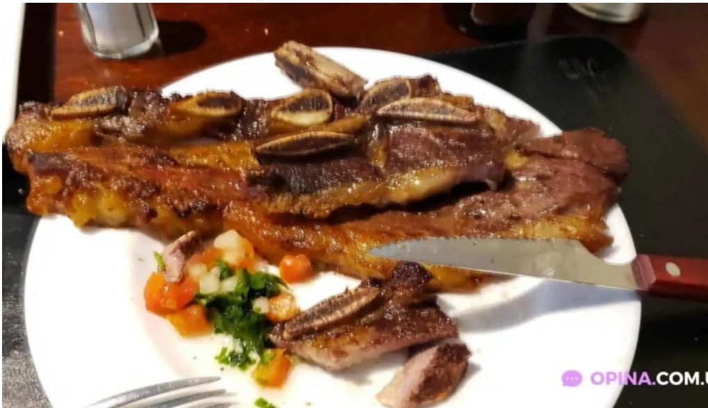
La otra parrilla churrasco