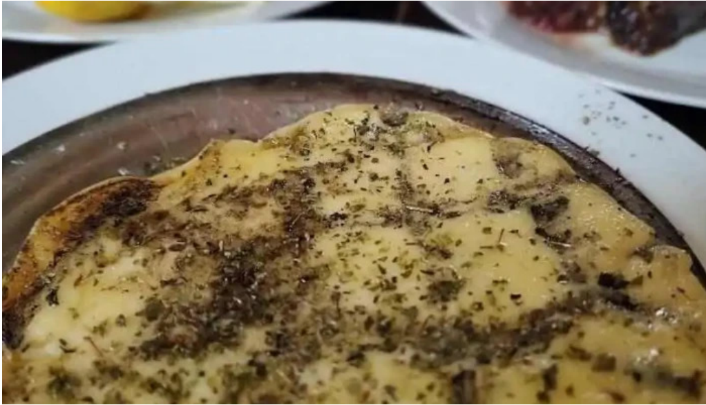
La otra parrilla provolone