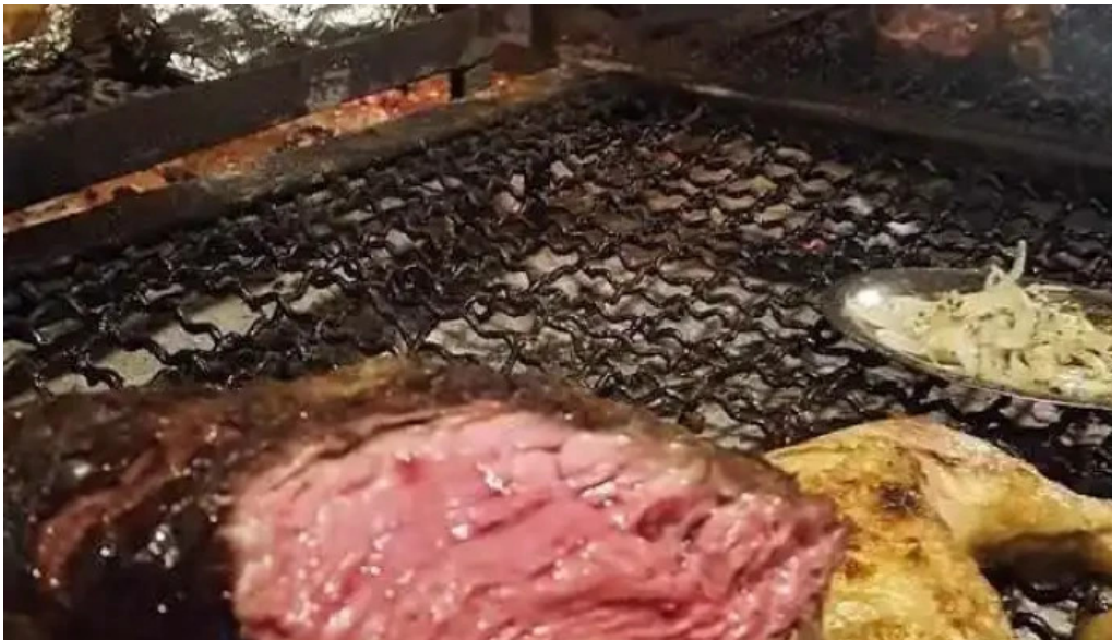
La otra parrilla comida y bebida