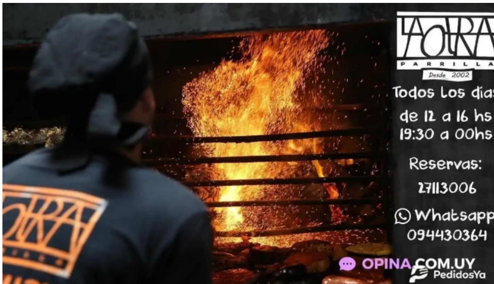
La otra parrilla del propietario