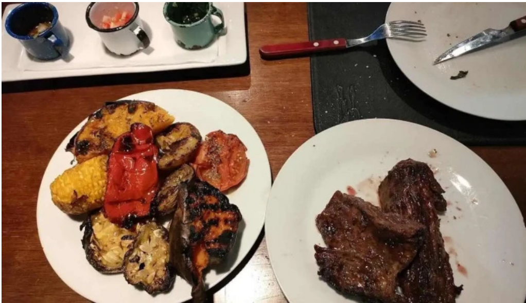
La otra parrilla filete