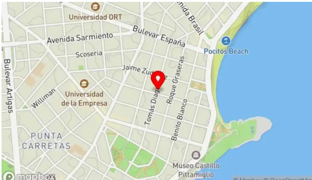
La otra parrilla mapa