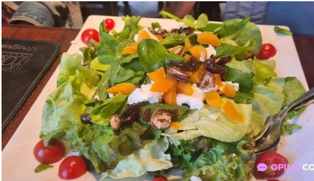
La otra parrilla ensalada