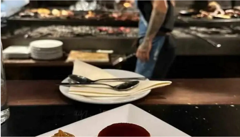
La otra parrilla flan