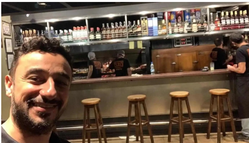
La otra parrilla ambiente