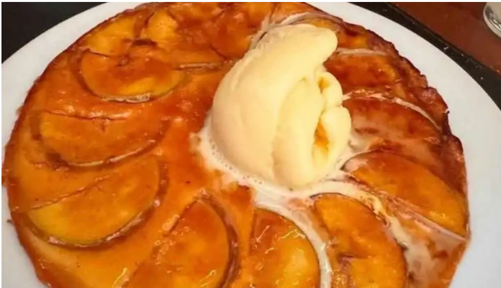
La otra parrilla tarta tatin