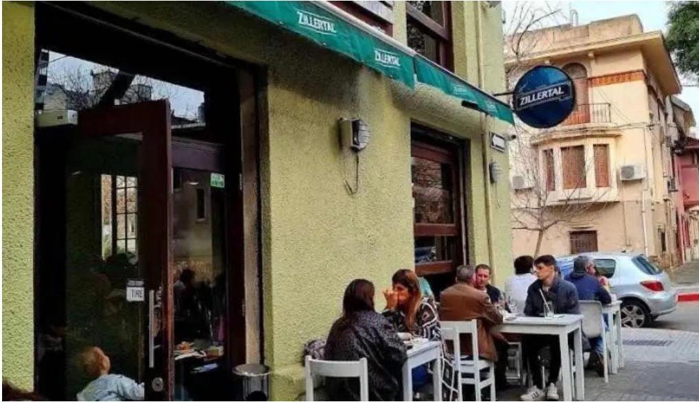
La otra parrilla todas