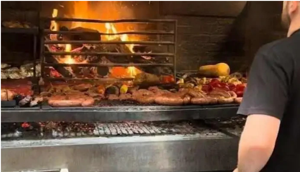
La otra parrilla videos