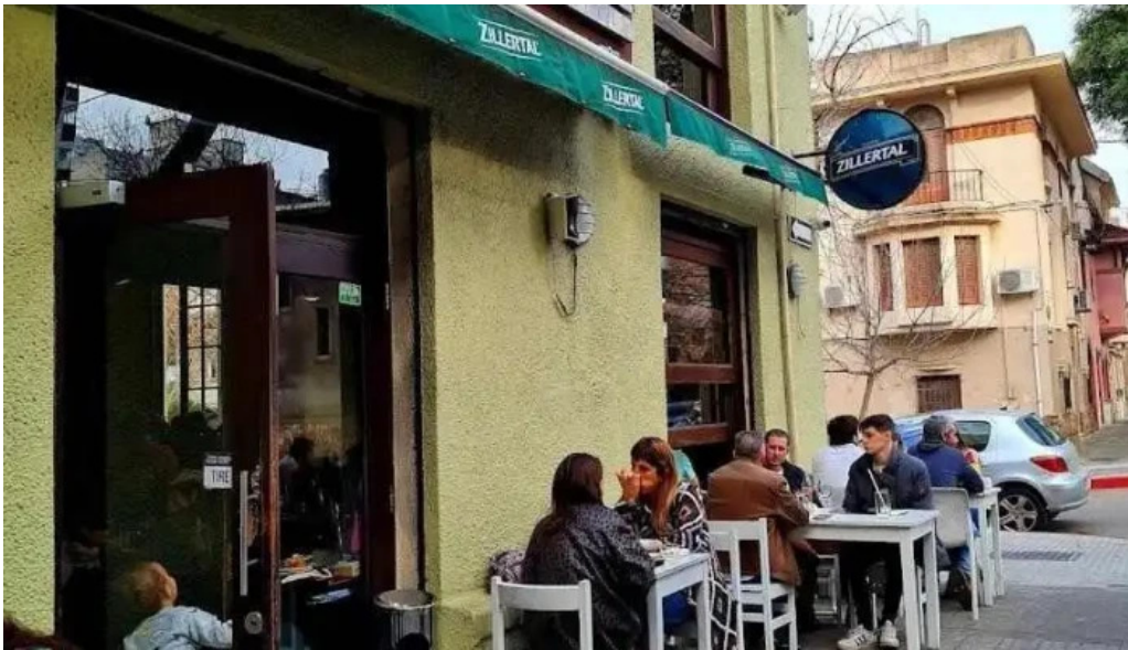
La otra parrilla montevideo