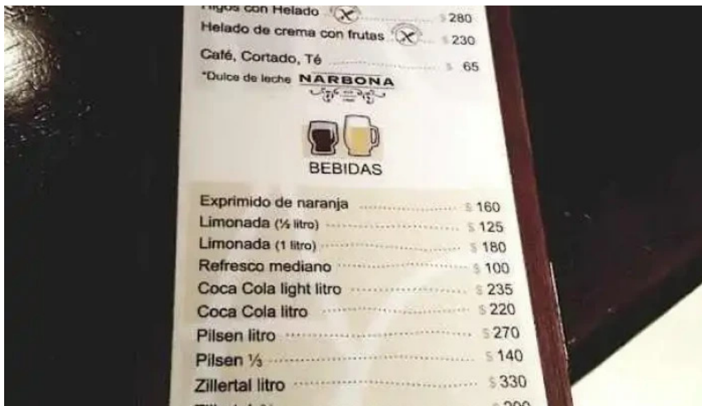
La otra parrilla menu